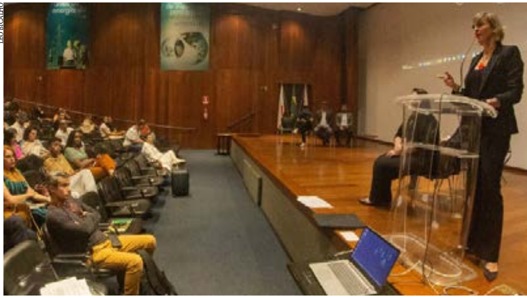
Prazo para adesão dos municípios mineiros aos recursos da lei se encerra no dia 11/7

A equipe da Secult-MG, o Conselho Estadual de Política Cultural, a Comissão de Gestão Estratégica e os técnicos do Ministério da Cultura darão todo o apoio necessário nestas etapas. (Agência Minas)