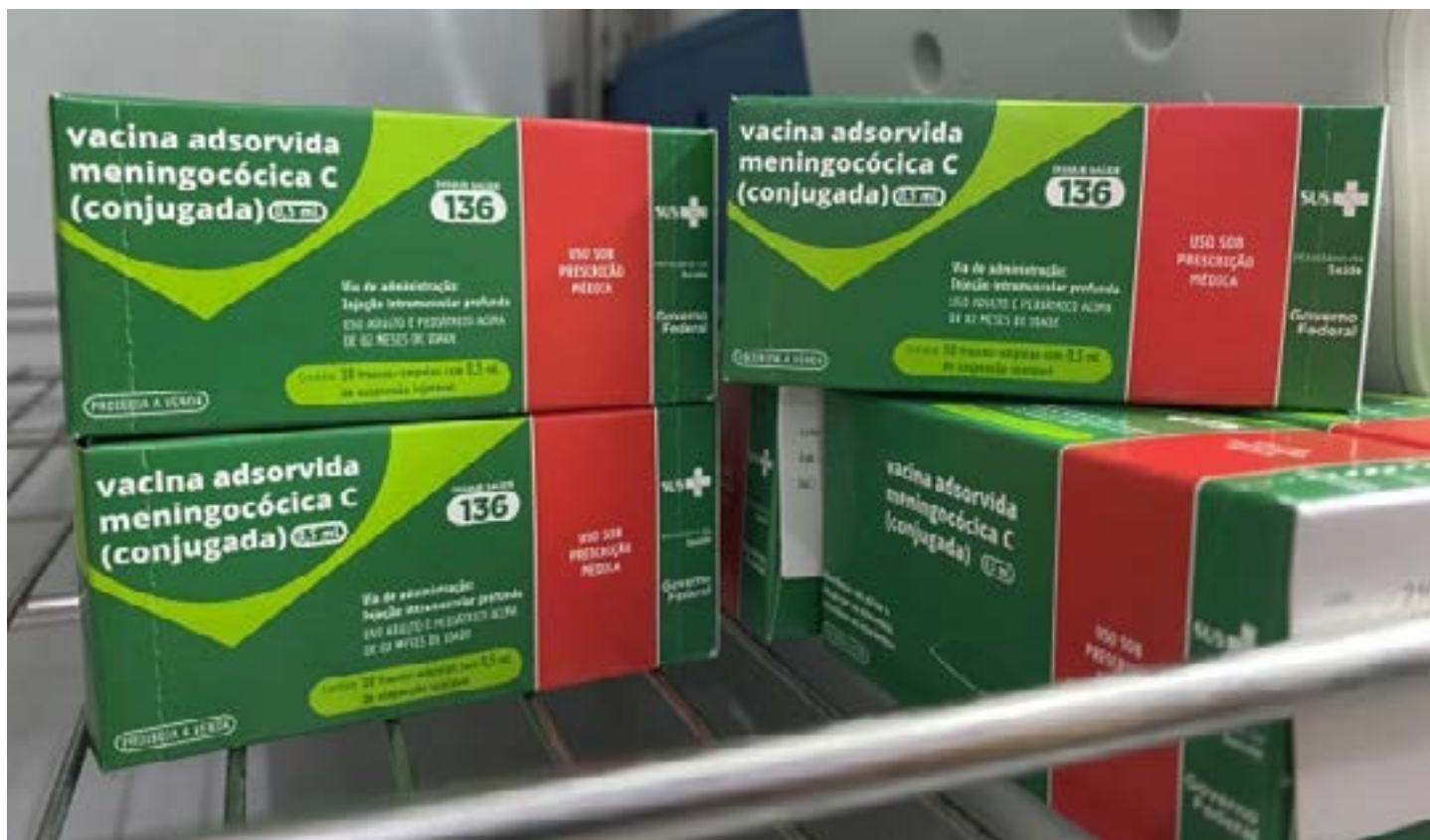
Imunizantes são oferecidos gratuitamente pelo SUS nas unidades de saúde de todo o estado

Em relação à meningocócica ACWY, a cobertura vacinal acumulada, em Minas Gerais, no período de 2017 a 2023, em adolescentes de 11 a 14 anos de idade, é de 34,06%. A meta preconizada para adolescentes é de 80%. (Agência Minas)