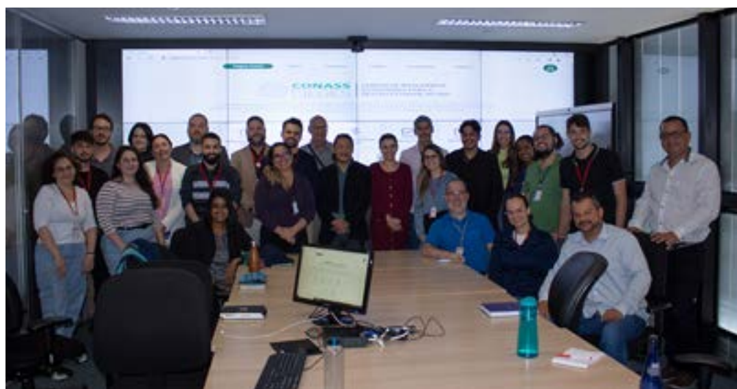
Projeto é fruto de parceria entre a Secretaria de Estado de Saúde e o Conselho Nacional de Secretários de Saúde