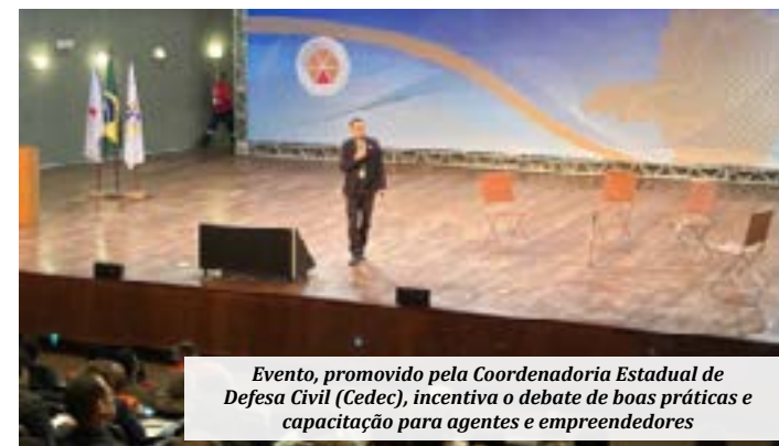
Evento, promovido pela Coordenadoria Estadual de Defesa Civil (Cedec), incentiva o debate de boas práticas e capacitação para agentes e empreendedores