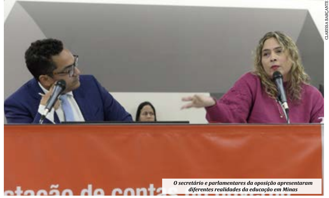
O secretário e parlamentares da oposição apresentaram diferentes realidades da educação em Minas

Quanto ao ensino superior, o gestor informou que foram investidos R$ 338 milhões em 2023 e que em breve será lançado o campus da Universidade Estadual de Montes Claros (Unimontes) em Salinas (Norte de Minas).