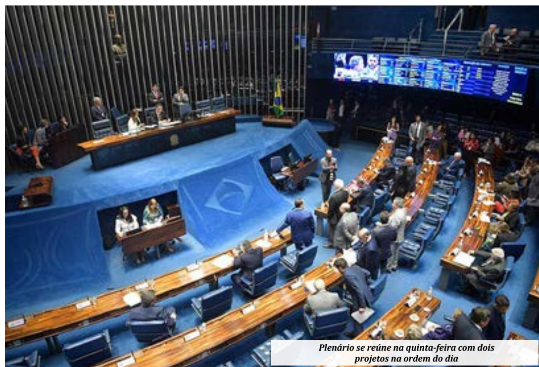
Plenário se reúne na quinta-feira com dois projetos na ordem do dia

Na Comissão de Educação (CE), o projeto de lei teve como relatora a senadora Teresa Leitão (PT-PE) e foi aprovado com emenda para assegurar a possibilidade de bolsa também na lei da carreira de técnicos-administrativos em educação (Lei 11.091, de 2005). Ainda segundo a emenda, os valores serão pagos diretamente pelas instituições ou por meio de agência oficial de fomento, de fundação de apoio ou de organismo internacional amparado por tratado ou convenção internacional. (Agência Senado)