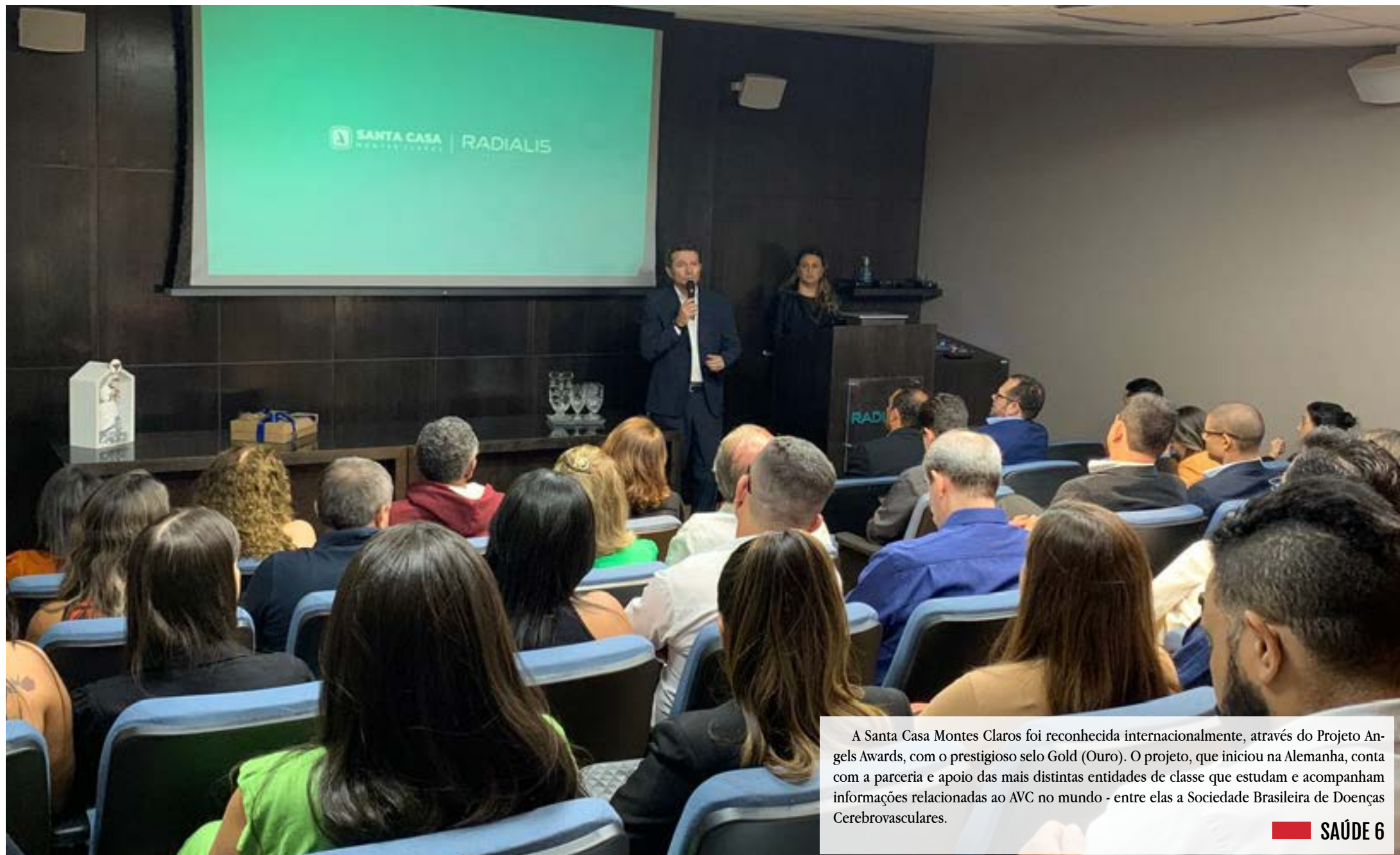
A Santa Casa Montes Claros foi reconhecida internacionalmente, através do Projeto Angels Awards, com o prestigioso selo Gold (Ouro). O projeto, que iniciou na Alemanha, conta com a parceria e apoio das mais distintas entidades de classe que estudam e acompanham informações relacionadas ao AVC no mundo - entre elas a Sociedade Brasileira de Doenças Cerebrovasculares.