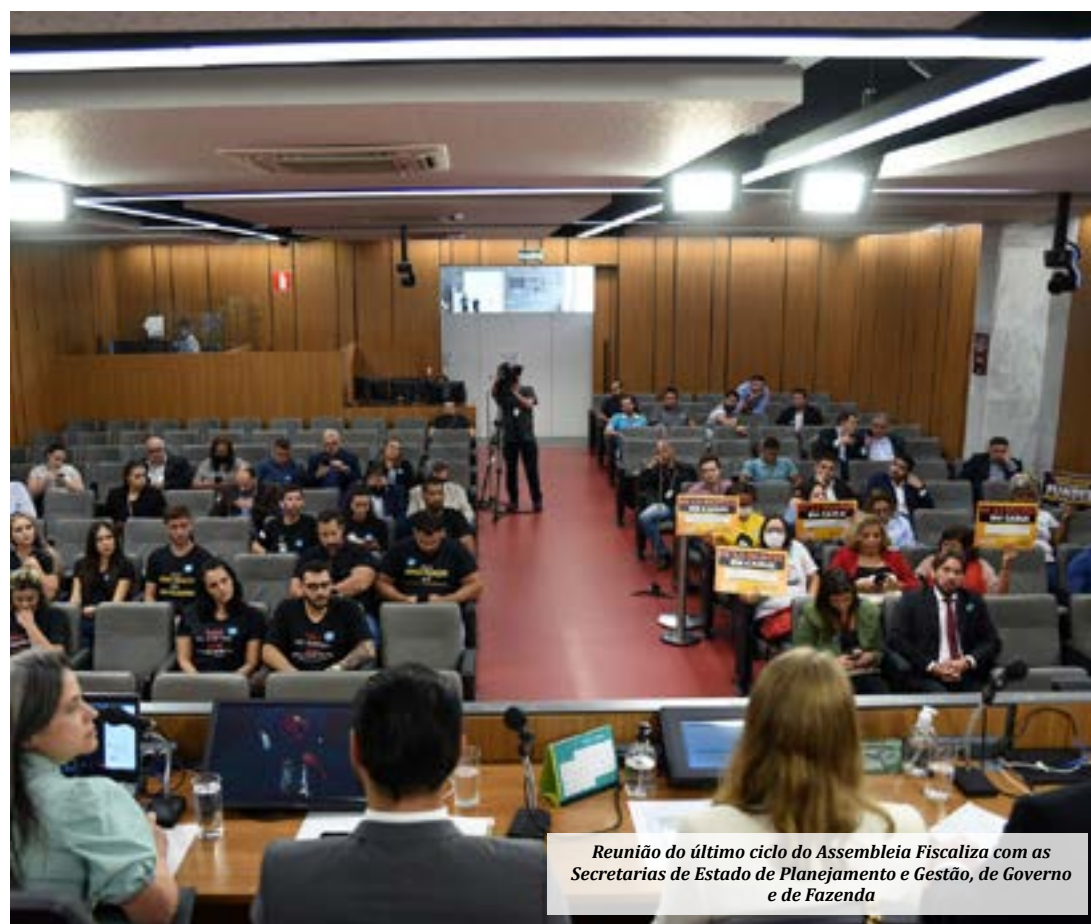
Reunião do último ciclo do Assembleia Fiscaliza com as Secretarias de Estado de Planejamento e Gestão, de Governo e de Fazenda

- Reuniões e visitas de fiscalização: nas reuniões de fiscalização, as comissões da Assembleia debaterão diversos assuntos de interesse da sociedade. As comissões também farão visitas a locais que prestam serviços públicos para verificar suas condições de funcionamento. Esse é o primeiro ciclo do prestação de contas do governo nessa nova configuração do Assembleia Fiscaliza. (Portal ALMG)