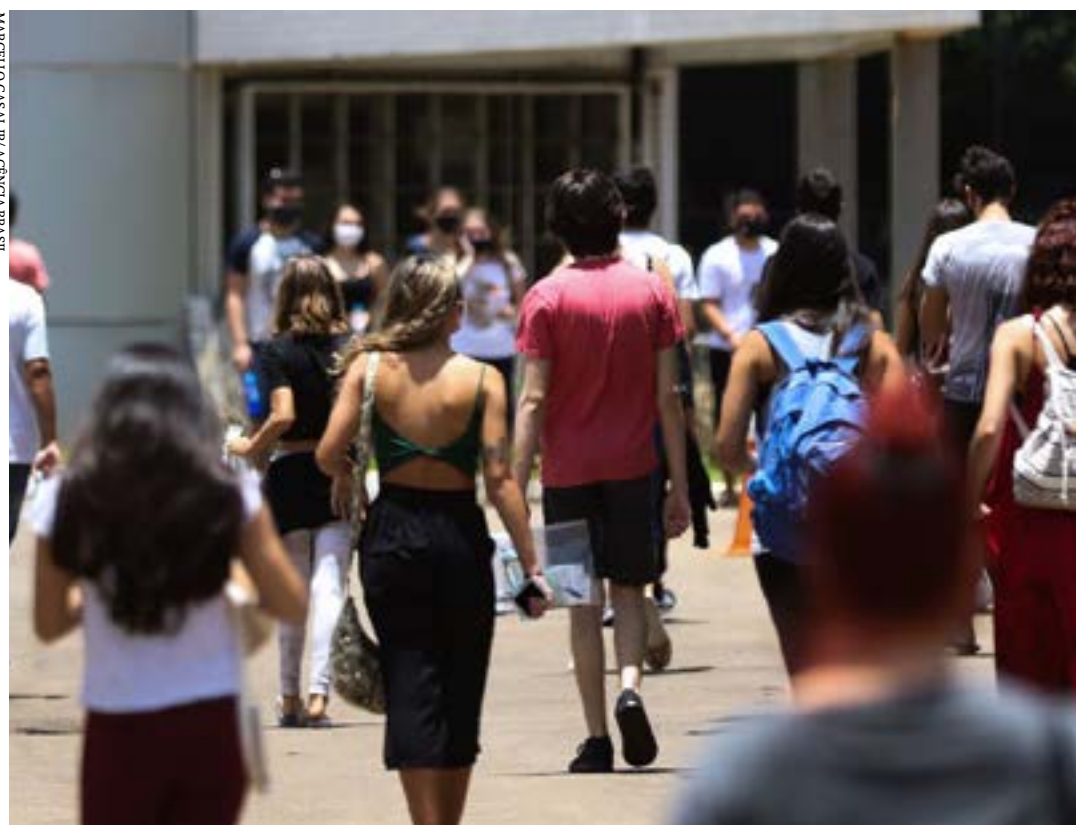
Total de inscritos vem caindo desde 2017