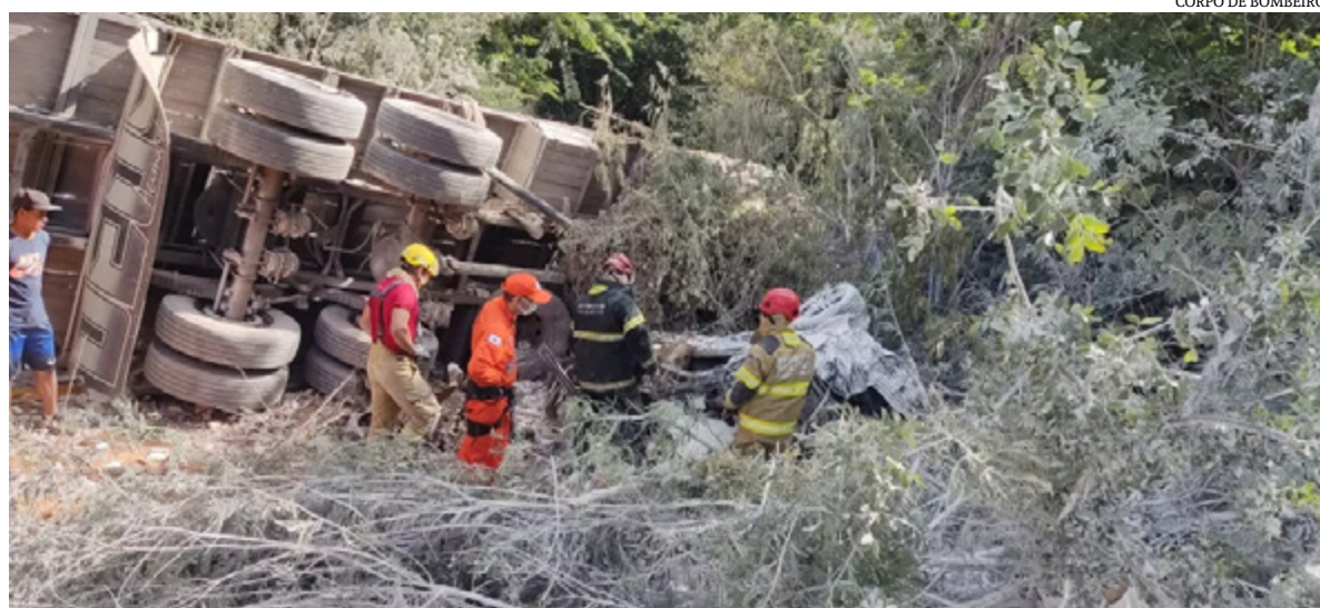
CORPO DE BOMBEIROS

No último sábado (26), seis pessoas morreram e uma ficou ferida em um grave acidente envolvendo um carro, um caminhão e uma carreta na BR-251, em Francisco Sá (MG). Todas as vítimas fatais estavam no carro que ficou completamente destruído. Segundo as primeiras informações do Corpo de Bombeiros, testemunhas contaram que o caminhão carregado com gesso descia a Serra de Francisco Sá quando perdeu os freios, invadiu a contramão e bateu de frente com o carro, que estava na frente da carreta.