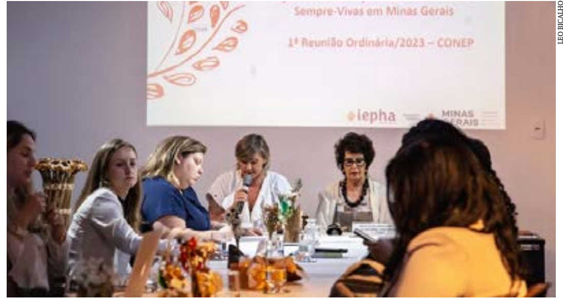
Decisão vai beneficiar cerca de 20 comunidades localizadas em Bocaiuva, Olhos d'Água e outros cinco municípios do Estado

O Governo de Minas, por meio da Secretaria de Estado de Cultura e Turismo (Secult-MG) e do Instituto Estadual do Patrimônio Histórico e Artístico de Minas Gerais (Iepha-MG), anuncia que o Sistema Agrícola Tradicional dos Apanhadores e Apanhadoras das Flores Sempre-Vivas foi declarado como Patrimônio Cultural Imaterial de Minas Gerais. A deliberação sobre o Registro do Sistema Agrícola Tradicional das Sempre-Vivas foi apresentada durante a 1ª Reunião Ordinária/2023 do Conselho Estadual do Patrimônio Cultural (Conep), no auditório do Centro de Arte Popular (CAP).