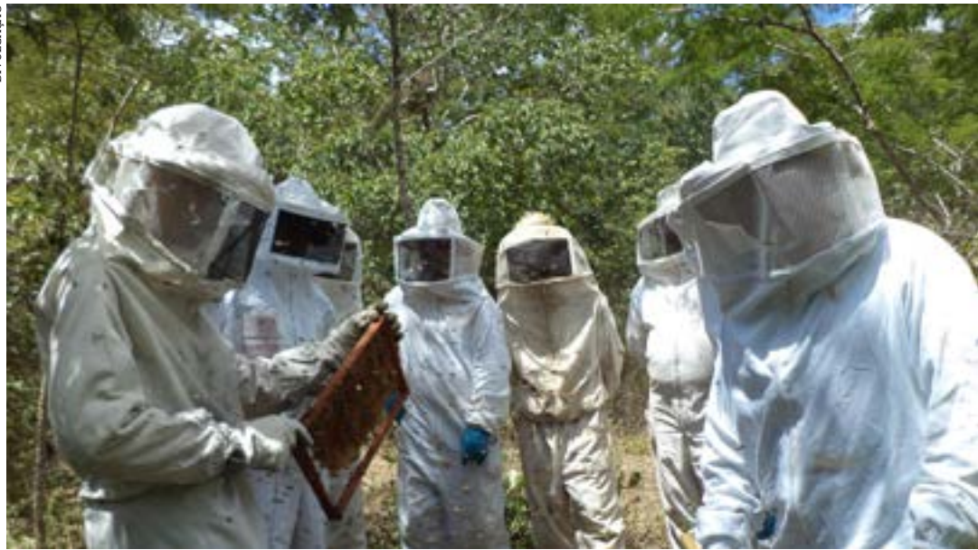
Apicultores da região receberam do Governo Federal um entreposto para processamento de até mil toneladas de mel por ano, além de uma unidade de beneficiamento de própolis e pólen em contêineres

“Com o investimento do MIDR no norte de Minas, por meio da apicultura, foi possível trabalhar na produção, no processamento, e também conseguimos promover abertura de mercado por conta da questão das boas práticas”, afirma. “Agora, temos muita gente trabalhando na apicultura, que é uma área essencial para o desenvolvimento da nossa região norte de Minas”, completa. (Ascom MIDR)