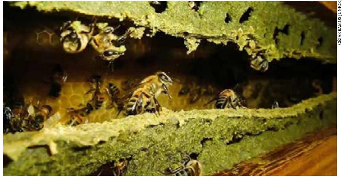
Denúncia de mortandade de abelhas será investigada em audiência