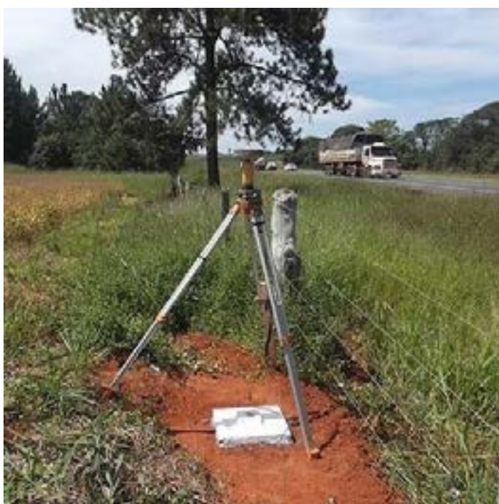
O georreferenciamento será realizado em 67 áreas de posseiros devidamente cadastrados. A ação é parte do Programa Estadual de Regularização Fundiária Rural

Teve início, na última terça-feira (13/6), por meio do Programa Estadual de Regularização Fundiária Rural, a medição de 67 áreas devolutas do Estado, no município de Mirabela. A responsável pelo serviço é a Empresa Seta Engenharia.