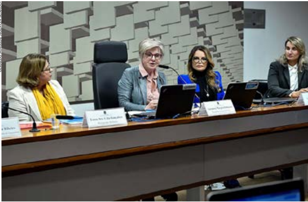
Denúncia de mortandade de abelhas será investigada em audiência

Segundo a secretária, a vítima de violência doméstica em Mato Grosso primeiro deve ir à delegacia de polícia, que demanda a Secretaria de Assistência Social por meio de formulário com perfil da mulher. O documento também é direcionado aos municípios, para que haja atendimento em centros de referência de assistência social. Caso a vítima interrompa esses atendimentos, o benefício é cancelado. Para ter direito ao cartão, a mulher deve ter renda mínima de R$ 105 por mês, mas valores recebidos de programas de assistência social não entram nessa conta. (Agência Senado)