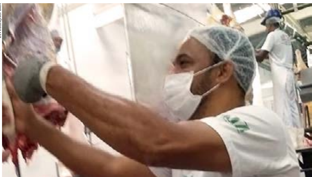
Medida garante ao consumidor que o produto foi registrado, inspecionado e fiscalizado pelo Instituto

O mercado de carne de galinha caipira no Brasil apresenta oportunidades promissoras para produtores que desejam atender à demanda por alimentos saudáveis e naturais. Com o crescimento do interesse dos consumidores por produtos diferenciados, é possível aproveitar as tendências e investir na produção de galinhas caipiras, seguindo as dicas de manejo e comercialização mencionadas. Dessa forma, é possível aproveitar as oportunidades de mercado e contribuir para o desenvolvimento sustentável da atividade avícola no país. (Portal Comprerural)