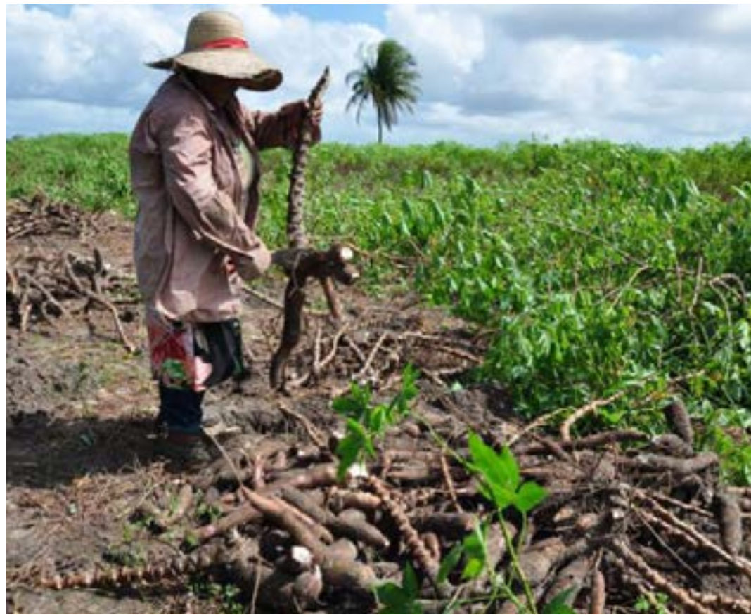
Entre as iniciativas há propostas de soluções para fortalecimento da cadeia da mandioca em Minas Gerais

Entre os projetos selecionados, há propostas de soluções para transição agroflorestal e produção de mel (Ceará), fruticultura familiar (Pernambuco), cadeia da mandioca (Minas Gerais), bovinocultura leiteira (Rio Grande do Norte) e piscicultura (Piauí). (Ascom BNB)