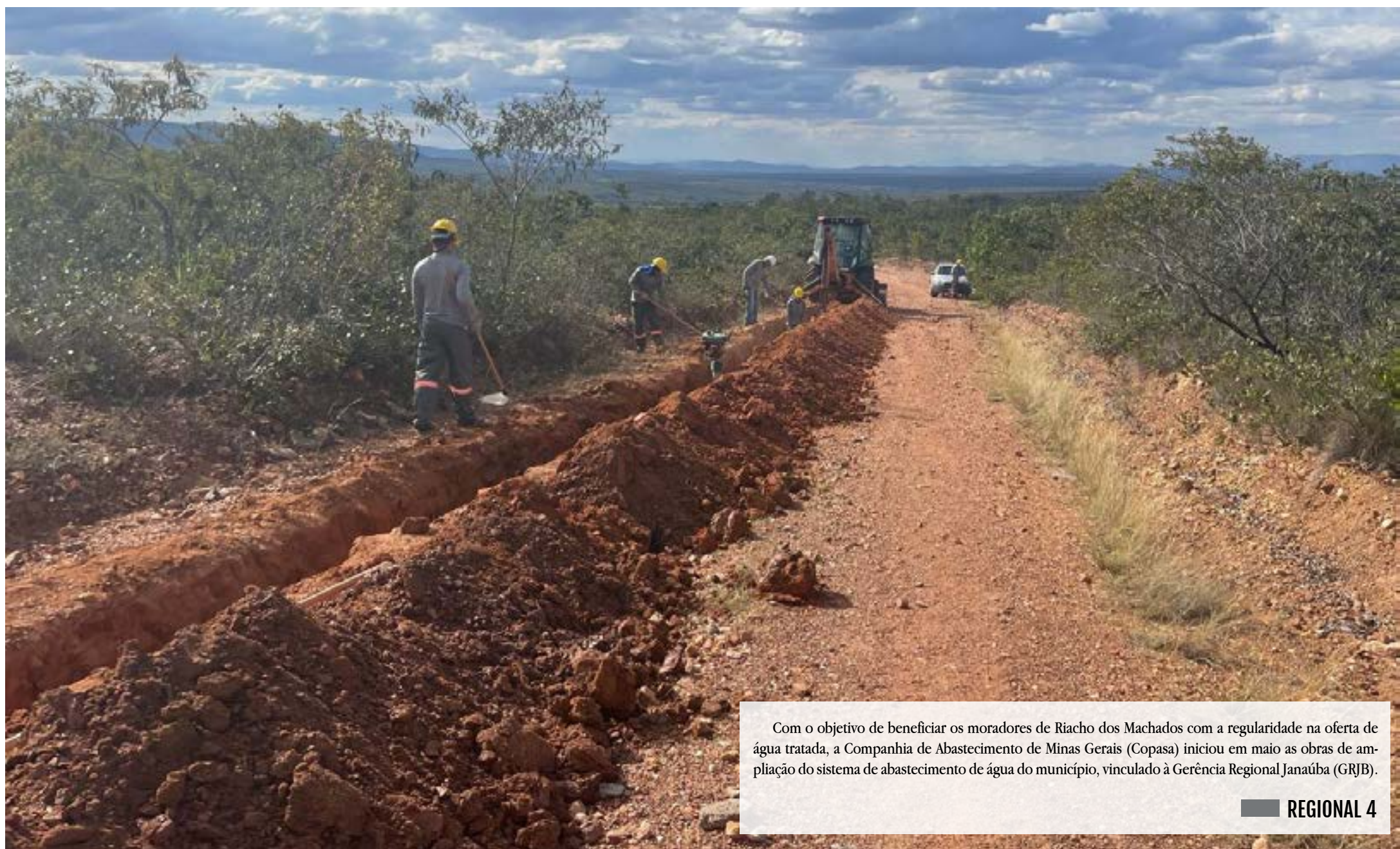
Com o objetivo de beneficiar os moradores de Riacho dos Machados com a regularidade na oferta de água tratada, a Companhia de Abastecimento de Minas Gerais (Copasa) iniciou em maio as obras de ampliação do sistema de abastecimento de água do município, vinculado à Gerência Regional Janaúba (GRJB). REGIONAL 4