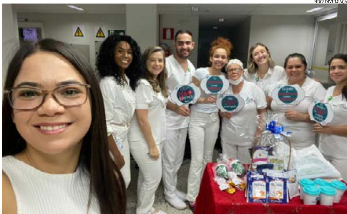
O hospital Dilson Godinho (HDG) reforçou a importância do Combate à Desnutrição Hospitalar. A data oficial é 6 de junho e marca o Dia "D" de Combate à Desnutrição. A iniciativa da Braspen é tornar público e de conhecimento não apenas dos profissionais da área assistencial, mas de toda a sociedade.