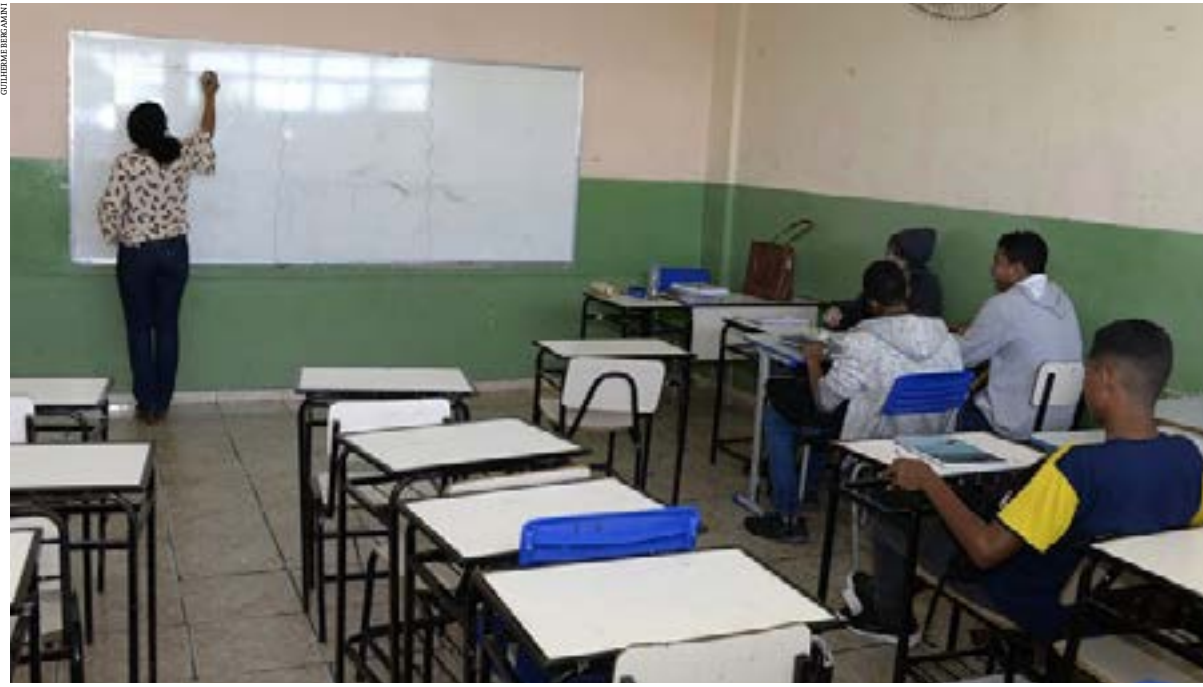
Diretoras aposentadas temem inclusive a possibilidade de precisarem devolver parte dos valores recebidos ao longo dos últimos anos

AGE orientou instalação de processo administrativo contra esses servidores aposentados para anular opção remuneratória