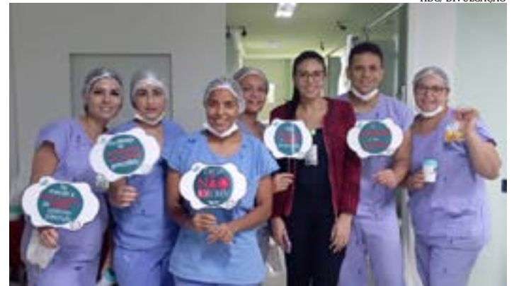
Ações de "cultura" da identificação/diagnóstico precoce, tratamento e prevenção aconteceram em todos os setores assistenciais

O hospital Dilson Godinho (HDG) reforçou a importância do Combate à Desnutrição Hospitalar. A data oficial é 6 de junho e marca o Dia "D" de Combate à Desnutrição. A iniciativa da Sociedade Brasileira de Nutrição Parenteral e Enteral (Braspen) é tornar público e de conhecimento não apenas dos profissionais da área assistencial, mas de toda a sociedade, os problemas causados pela desnutrição