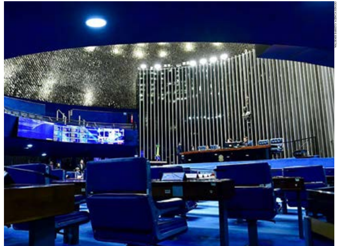
Também está na pauta projeto sobre avaliação e revisão de incentivos fiscais

jeitas a regimes especiais, como menores de idade. Na Comissão de Relações Exteriores (CRE), o acordo foi relatado pelo senador Carlos Viana (Podemos-MG). (Agência Senado)