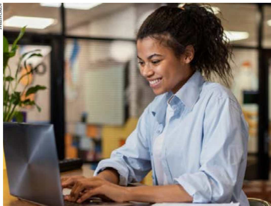
Conforme dados do Caged, micro e pequenas empresas tiveram saldo de quase 19 mil postos de trabalho, com queda de quase 14% em relação a março

PERFIL DAS CONTRATAÇÕES - As contratações mais comuns nos micro e pequenos negócios mineiros em abril foram de homens na faixa etária de 18 a 24 anos e com Ensino Médio completo – representam 59,4% dos postos de trabalho preenchidos. Curiosamente, esse perfil foi o mais assíduo nas demissões no mês em questão, com mais de 60% dos vínculos de empregos encerrados. O salário médio pago de admissão foi de R$ 1.742,76, praticamente na mesma faixa do salário de desligamento (R$ 1.749,30). (Agência Sebrae)