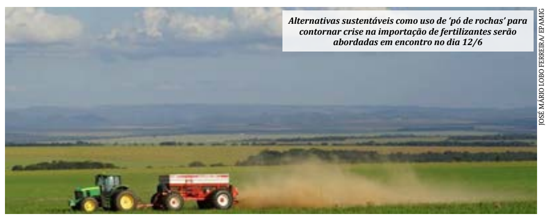
Alternativas sustentáveis como uso de ‘pó de rochas’ para contornar crise na importação de fertilizantes serão abordadas em encontro no dia 12/6

De acordo com o pesquisador, os remineralizadores são saída viável e “regionalizada” (por serem