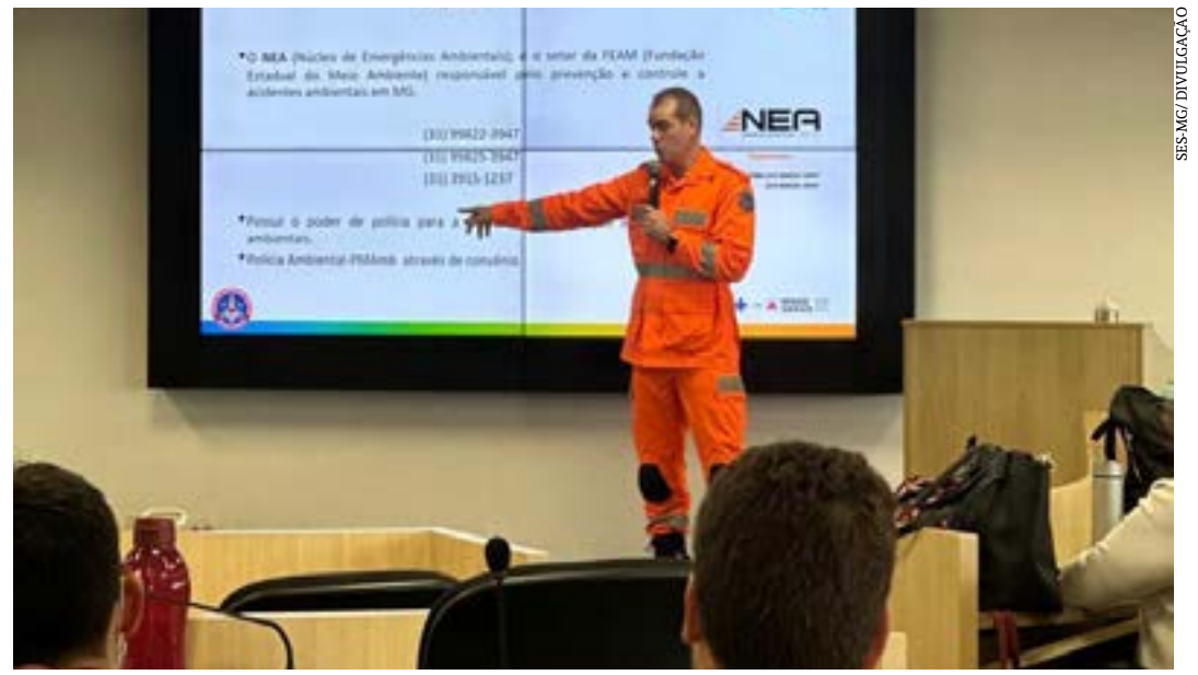
Oficina reuniu diversas áreas da Secretaria para definição de ações coordenadas em desastres

Emergências Ambientais (NEA), setor da Fundação Estadual de Meio Ambiente (Feam) responsável pela prevenção e controle de acidentes ambientais em Minas Gerais, foram registradas 456 co-