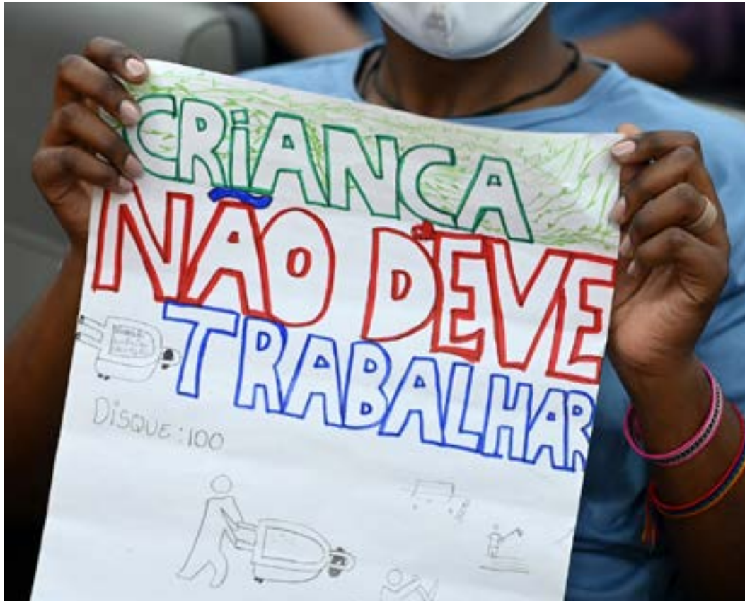
Aumento do trabalho infantil já havia sido debatido pela Comissão do Trabalho, da Previdência e da Assistência Social ano passado.

Políticas de enfrentamento ao trabalho infantil estarão em debate em audiência pública realizada pela Comissão de Participação Popular da Assembleia Legislativa de Minas Gerais (ALMG) na segunda-feira (12), às 14 horas, no Espaço José Aparecido de Oliveira.