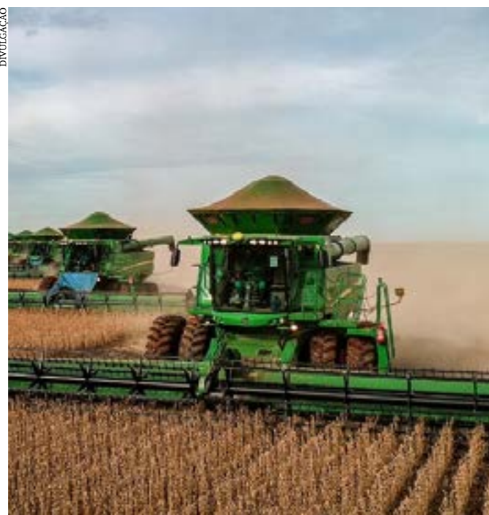
O setor Agropecuário registrou a maior alta do indicador, com avanço de 21,6% no primeiro trimestre de 2023

O setor, mesmo durante a pandemia do Covid-19, continuou a trabalhar, com sol ou chuva, garantindo e transformando o Brasil num dos dois ou três maiores produtores e exportadores de produtos agrícolas do mundo — ou, como acontece em muitos casos, no número 1. O agro sustenta e faz prosperar toda uma cadeia de produção na indústria, no comércio e no universo da tecnologia. Fornece emprego, renda e impostos. (Portal Comprerural)