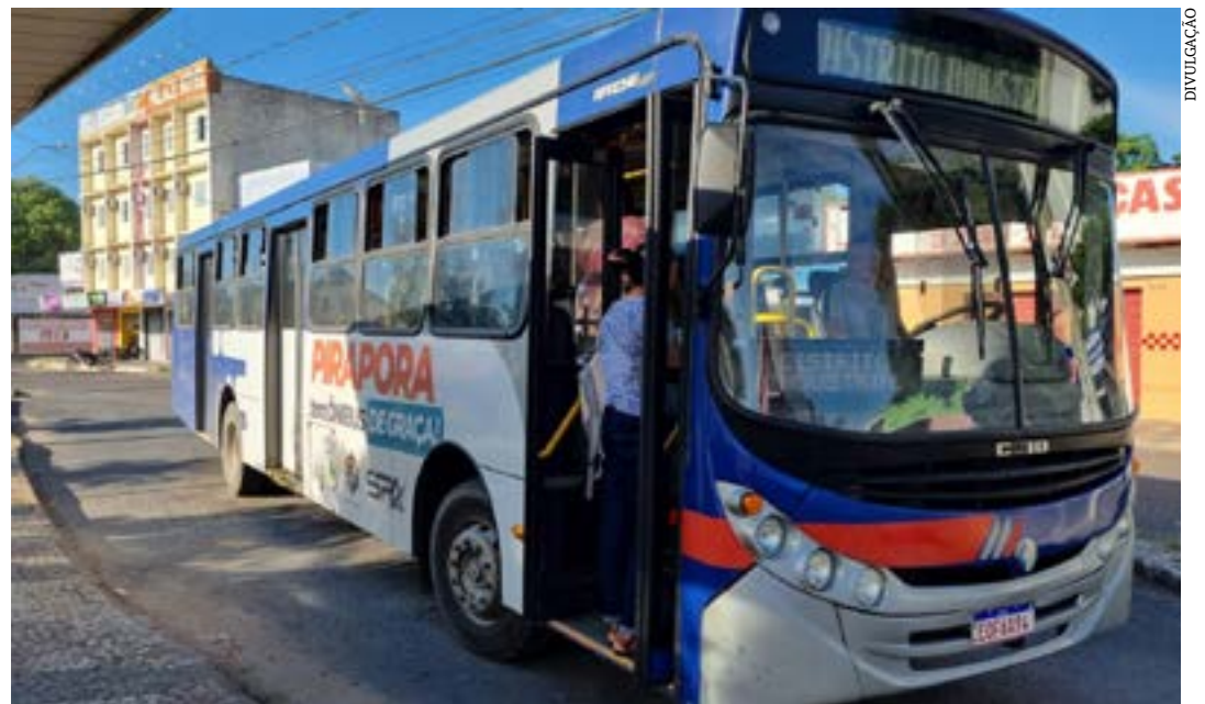
O atual prefeito garantiu, inclusive, que irá aumentar as linhas e rotas para ampliar o benefício