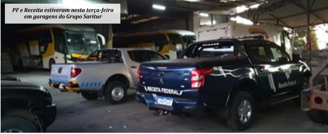
PF e Receita estiveram nesta terça-feira em garagens do Grupo Saritur