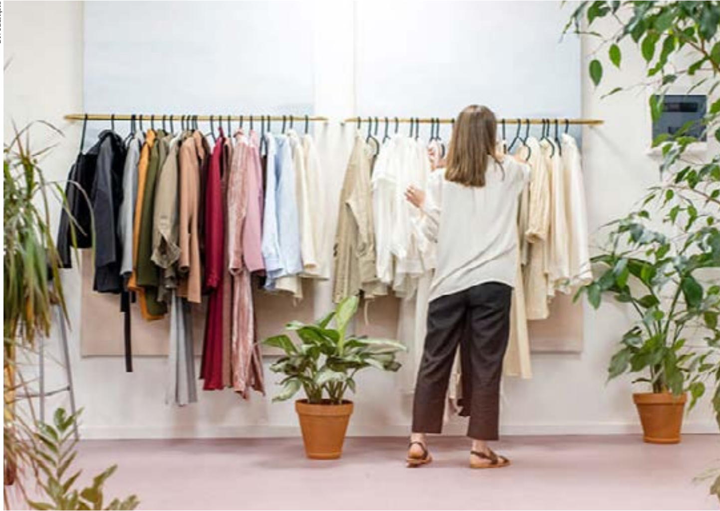
Número de novos empreendimentos no ano é 10,6% superior ao registrado no mesmo período de 2022, revela balanço da Junta Comercial de Minas

Minas Gerais fechou o mês de maio com 7.161 novas empresas abertas em todo o estado, o que representa avanço de 1,83% em relação ao mesmo mês de 2022, quando foram abertas 7.032 novas empresas. Nos cinco primeiros meses do ano, em Montes Claros foram abertas 810, um crescimento de 9,75% na comparação com o mesmo período do ano passado. O incremento de novos negócios colocou Montes Claros no quinto lugar do ranking do Estado.