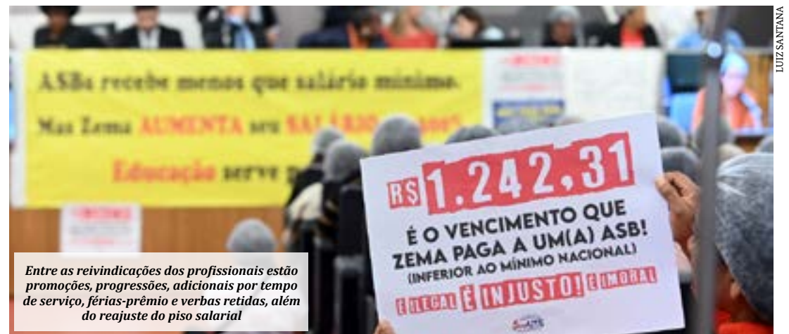
Entre as reivindicações dos profissionais estão promoções, progressões, adicionais por tempo de serviço, férias-prêmio e verbas retidas, além do reajuste do piso salarial