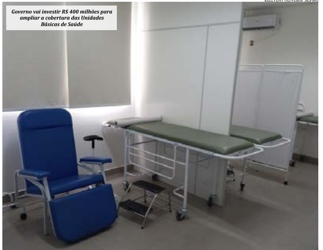
Governo vai investir R$ 400 milhões para ampliar a cobertura das Unidades Básicas de Saúde

Em complementação, a SES-MG publicou, também, a Resolução SES-MG Nº 8.754, de 16 de maio de 2023, que estabelece as normas gerais de adesão, execução, acompanhamento, controle e avaliação do processo de concessão de incentivo financeiro para construção de UBS em 2023. (Agência Minas)