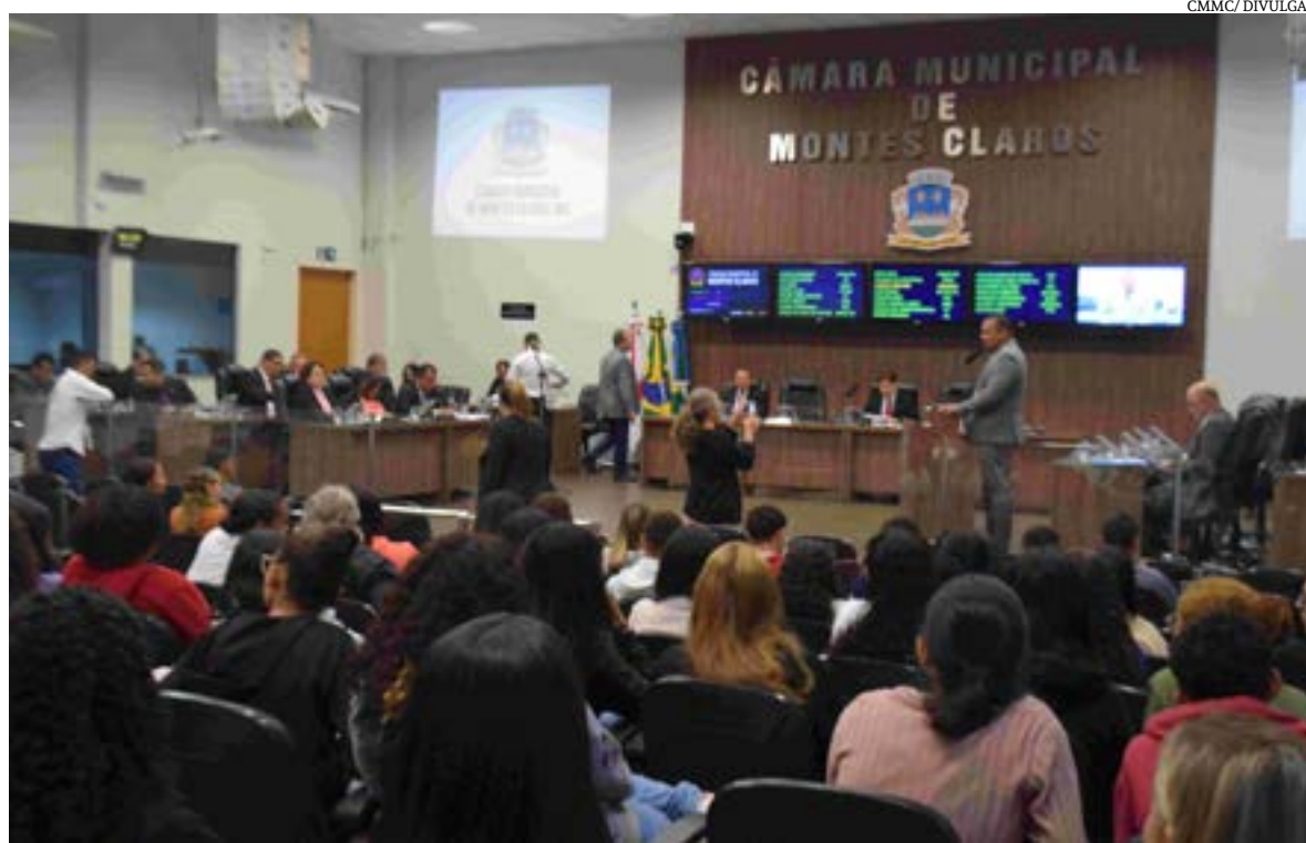
Alterar o valor pago a médicos pediatras, nos regimes de plantão no atendimento pela rede pública de saúde, foi um dos projetos aprovados nessa terça-feira (6), pelos vereadores na Câmara Municipal.