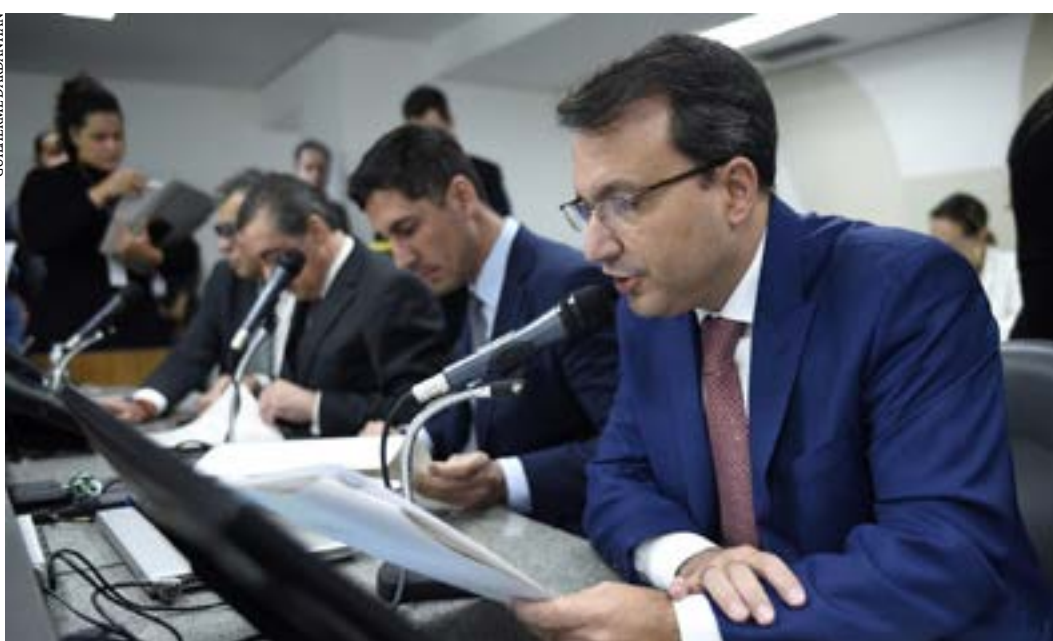
Os deputados da CCJ deram aval a proposição que estabelece novos critérios para repartição da parcela do ICMS pertencente aos municípios