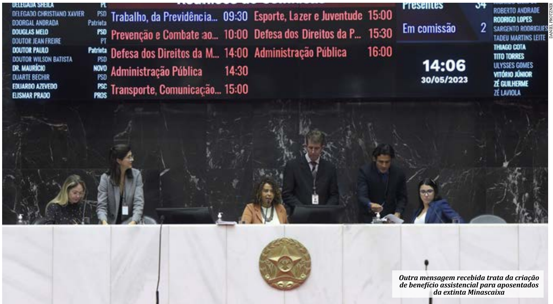
Outra mensagem recebida trata da criação de benefício assistencial para aposentados da extinta Minascaixa

Segundo a Mensagem 29/23 do governador, o projeto de lei do piso nacional dispõe sobre o