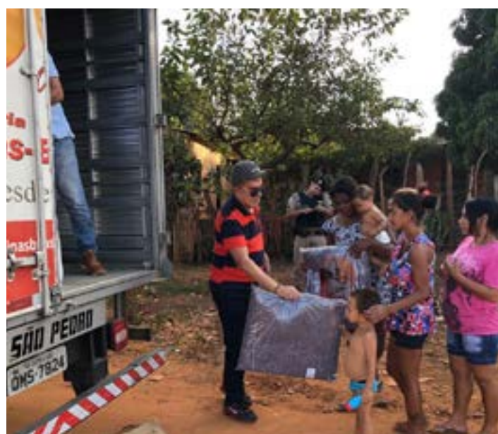
JÁ iniciei a CAMPANHA DO FRIO e conto a participação dos amigos me enviando um, dois ou mais para cobrir um irmão carente neste inverno que se aproxima. Esta foto foi no ano passado