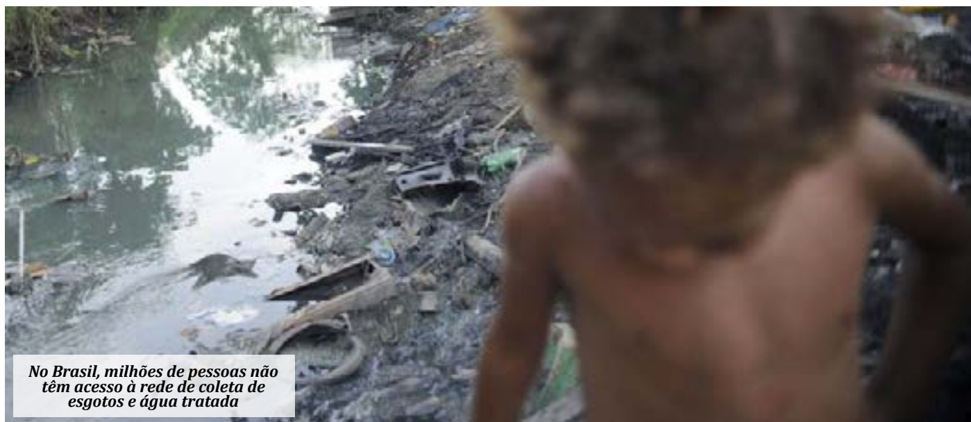
No Brasil, milhões de pessoas não têm acesso à rede de coleta de esgotos e água tratada

No início de maio, a Câmara aprovou projeto que suspende dispositivos de dois decretos presidenciais de regulamentação do novo marco do saneamento básico. (Agência Câmara)