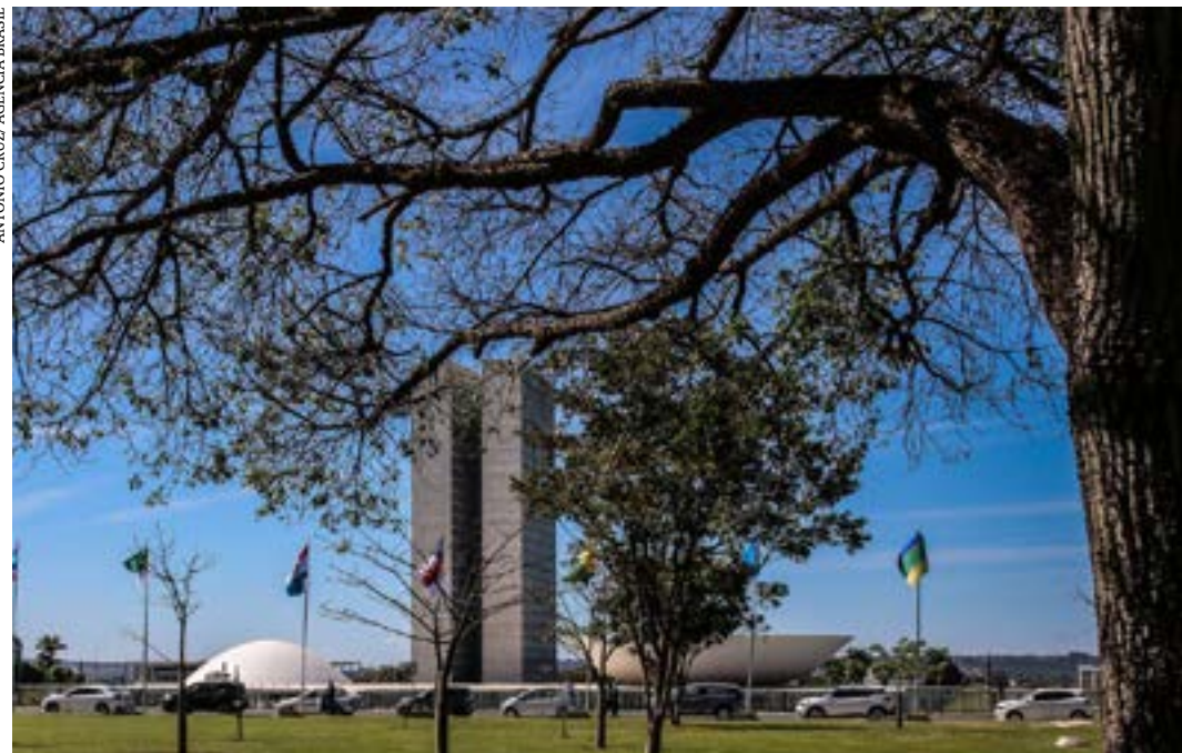
Projeto de lei complementar foi aprovado na Câmara na semana passada

O primeiro item, de autoria do senador Veneziano Vital do Rêgo (PSB-PB), determina que as empresas de grande porte que tomarem empréstimo junto ao Banco Nacional de Desenvolvimento Econômico e Social (BNDES) deverão promover parceria técnica com universidades públicas brasileiras (PL 6.039/2019), com o objetivo de aumentar a interação de professores, pesquisadores e estudantes com o mercado e fomentar a produção científica. (Agência Brasil)