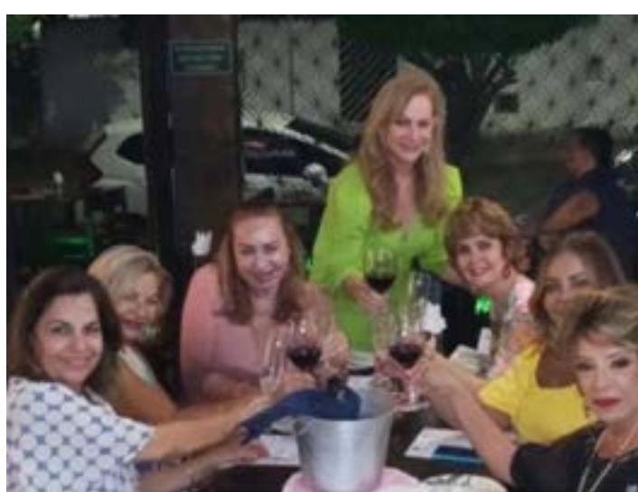
UM BRINDE as aniversariantes deste mês