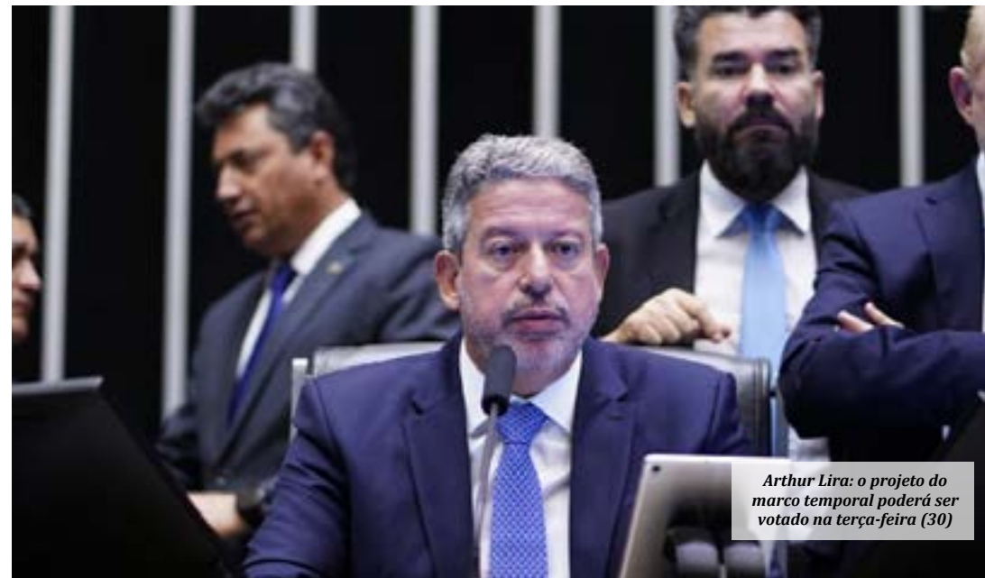
Arthur Lira: o projeto do marco temporal poderá ser votado na terça-feira (30)

O julgamento do STF sobre o marco temporal está marcado para o dia 7 de junho. Os ministros vão decidir se a promulgação da Constituição Federal deve ser adotada como parâmetro para definir a ocupação tradicional da terra por indígenas. O relator da ação, ministro Edson Fachin, votou contra a tese do marco temporal. (Agência Câmara)