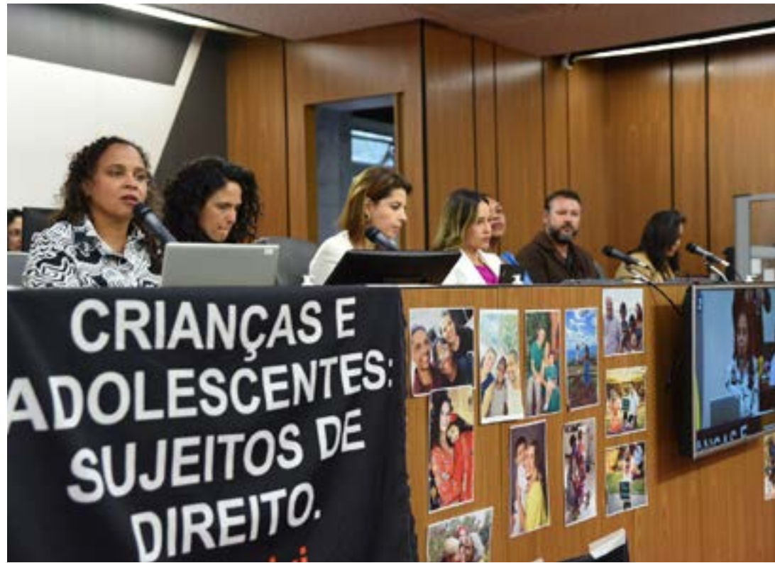
Os participantes da audiência pública defenderam que as crianças e adolescentes à espera de adoção têm direito a uma nova família