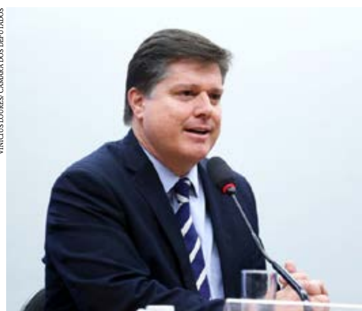
Deputado Baleia Rossi recomendou a aprovação da proposta

A Comissão de Constituição e Justiça e de Cidadania (CCJ) da Câmara dos Deputados aprovou o Projeto de Lei 5177/19, que cria o Dia Nacional de Conscientização sobre as Distrofias Musculares, a ser celebrado anualmente no dia 17 de setembro, com a realização de campanhas educativas pelo poder público sobre essas doenças.