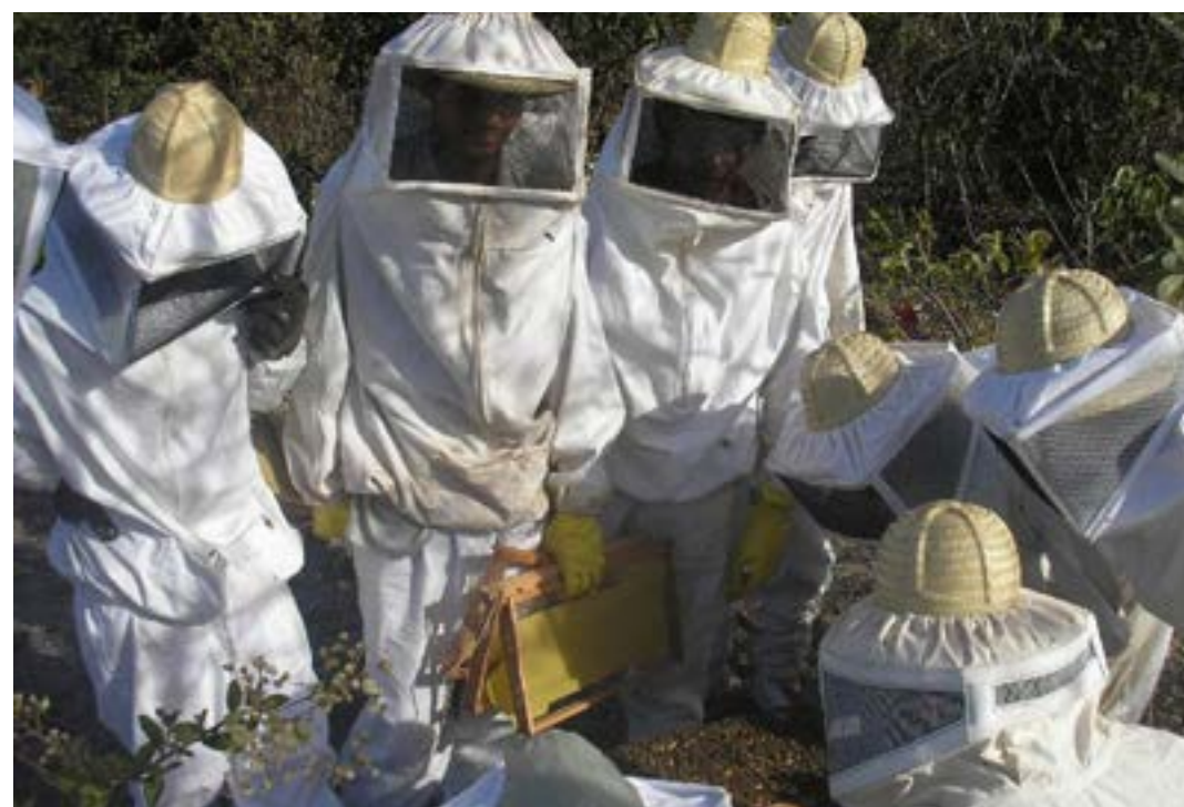
Apicultura garante ocupação para cerca de 13 mil pessoas em Minas Gerais

ovos sem ajuda de outras. Todas realizam o trabalho fundamental de polinização, que garante a produtividade agrícola.