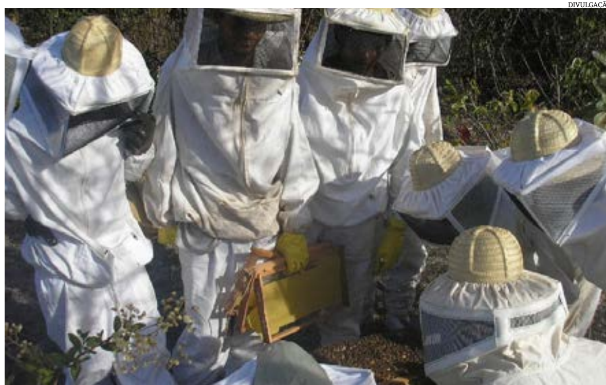
A receita das exportações mineiras de produtos apícolas alcançou US$ 20,5 milhões, em 2022, o que representou um salto de 25% em relação ao ano anterior. No mercado interno, os apicultores também tiveram bons resultados.