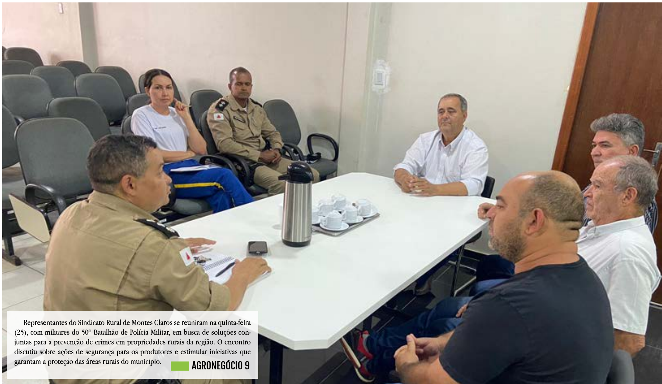
Representantes do Sindicato Rural de Montes Claros se reuniram na quinta-feira (25), com militares do 50º Batalhão de Polícia Militar, em busca de soluções conjuntas para a prevenção de crimes em propriedades rurais da região. O encontro discutiu sobre ações de segurança para os produtores e estimular iniciativas que garantam a proteção das áreas rurais do município. AGRONEGÓCIO 9