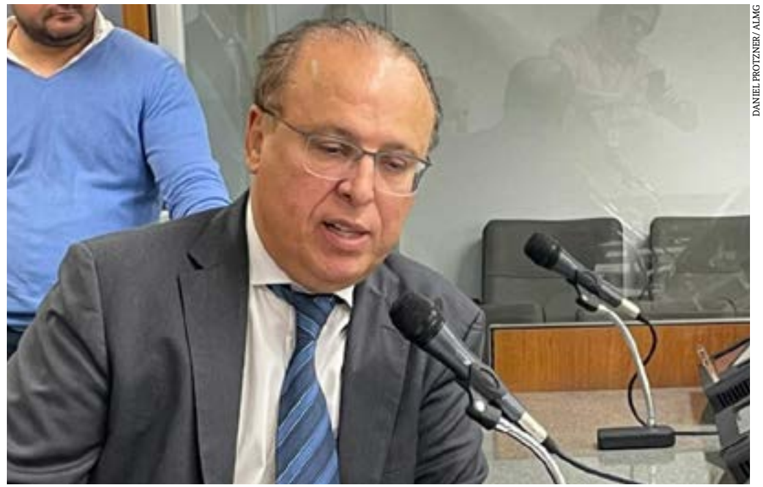
Segundo o parlamentar, a celeridade na liberação dessas novas conexões à rede elétrica da Cemig é fundamental à manutenção e ampliação de milhares de empregos e renda gerados