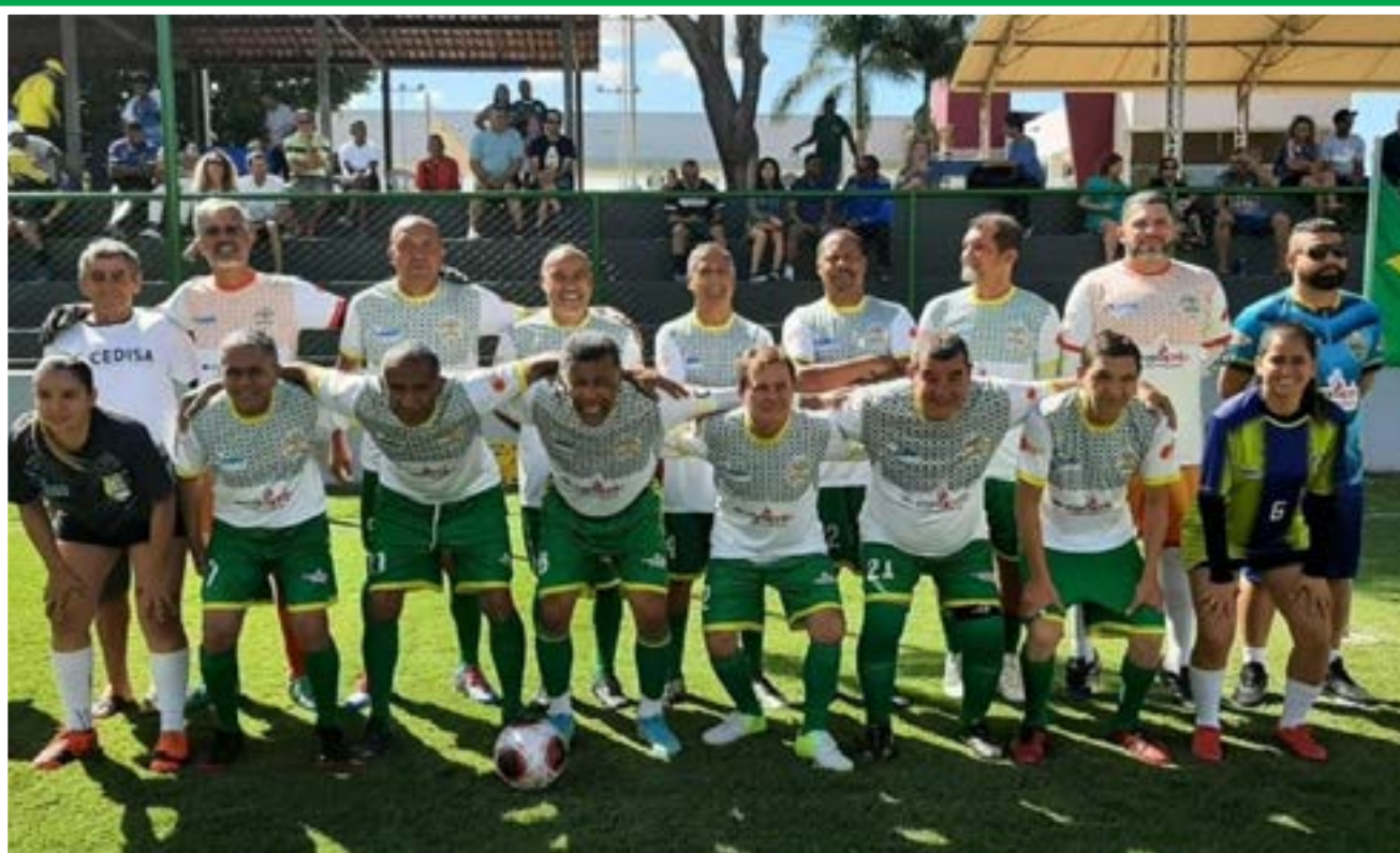
Fogo no Espeto é Campeão do Campeonato Interno de Futebol Soçaite Super Sênior AABB 2023

Em 2010, o Cruzeiro levou o clássico para a cidade do interior. Então líder, a Raposa perdeu por 4 a 3, com três gols do atacante Obina e um pênalti perdido por Montillo. (Superesportes)