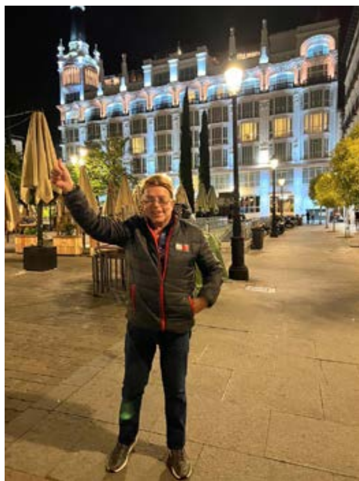
VIVA a Espanha, país bellissimo que adoro visitar