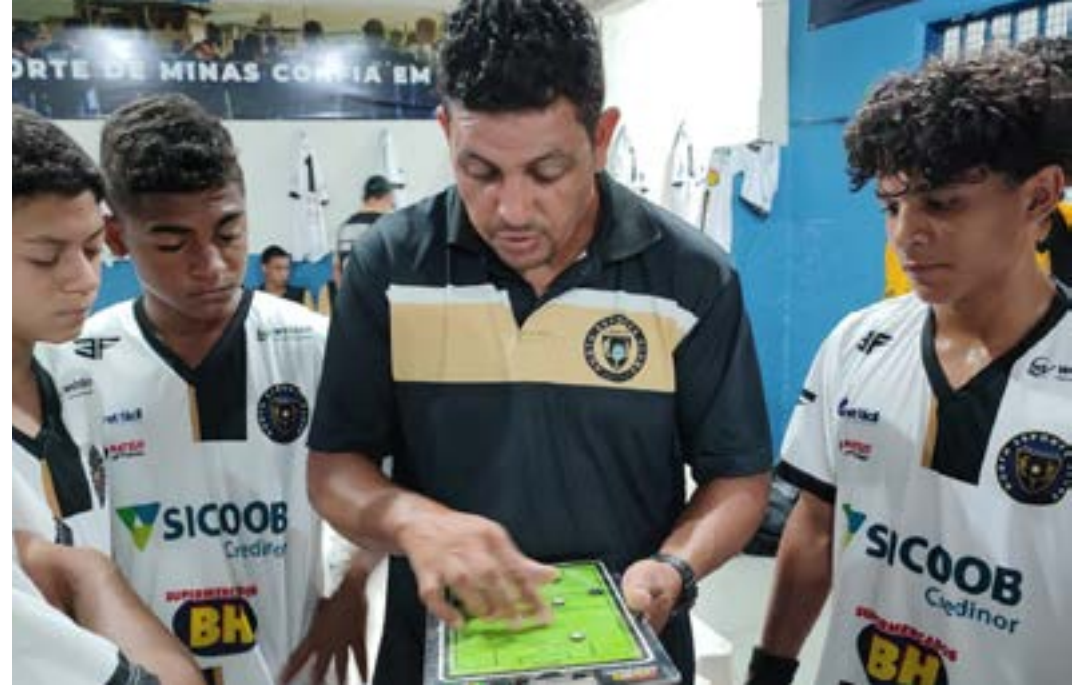
Times Sub-15 e Sub-17 enfrentam o Manchester/Atlético, no domingo

Assim como no profissional, as "Criias do North" também têm compromisso neste fim de semana. Pelo Campeonato Mineiro Sub-15 e Sub-17 - 2ª Divisão -, o North Esporte Clube fará o duelo regional do Norte