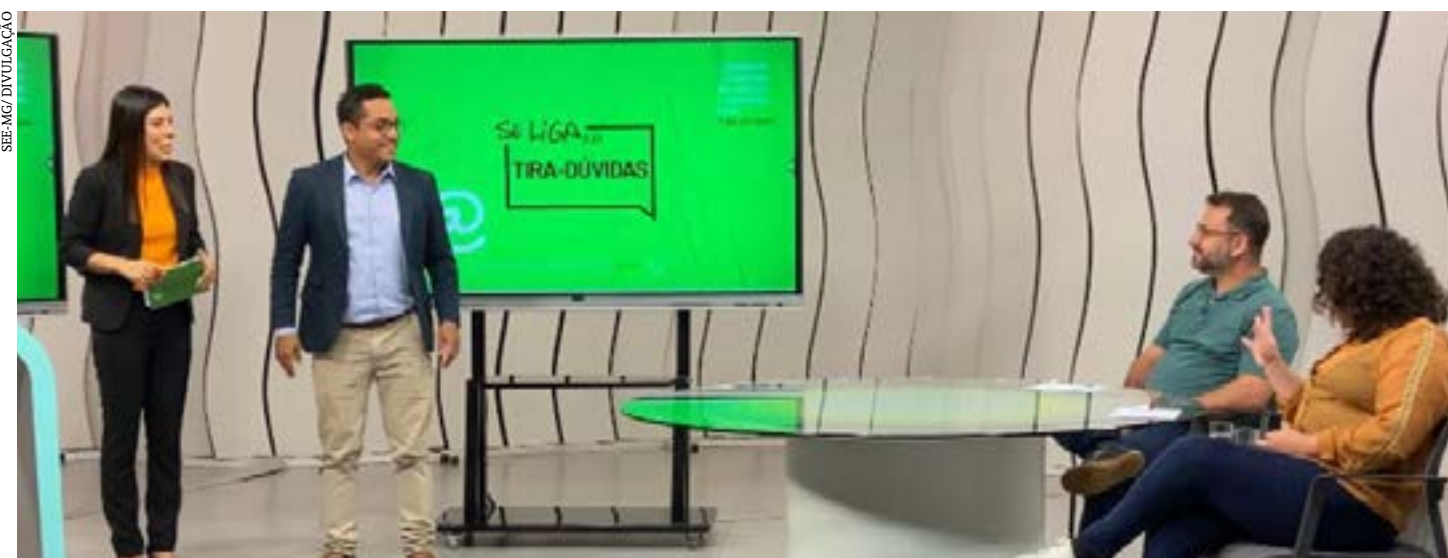
Veiculado pela Rede Minas, desde 2020, a iniciativa foi criada para auxiliar no estudo remoto de estudantes da rede pública de ensino durante a pandemia

O Se Liga na Educação vai ao ar, pela Rede Minas, de segunda a sexta-feira das 7h30 às 12h30, sendo ao vivo das 11h15 às 12h30. O público ainda pode acessar as transmissões por meio do canal da emissora no YouTube, a qualquer momento, e conferir outros conteúdos, como o Quiz, o short e o Se Liga Rapidin. Também é possível acessar o programa por meio do site seliga.educacao.mg.gov.br/.