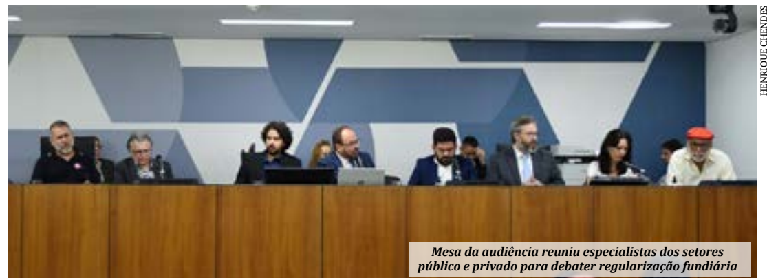
Mesa da audiência reuniu especialistas dos setores público e privado para debater regularização fundiária

Por fim, ele sugeriu que as entidades que atuam nessa área busquem recursos também na iniciativa privada, especialmente junto a fundos de investimentos dispostos a auxiliar projetos de impacto social. "Os recursos públicos para regularização fundiária não são suficientes; precisamos do mercado financeiro para complementar. Tem pessoas do bem lá, que podem oferecer o recurso de uma forma amigável", apostou.