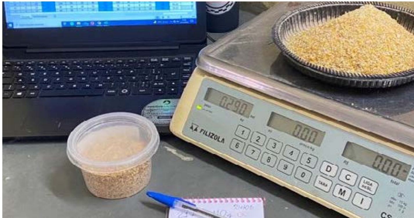
De acordo com a pesquisa, a farinha de baru pode substituir parte do milho na alimentação de bezerros leiteiros

Um fruto nativo do cerrado pode se tornar uma alternativa para alimentação de bezerros leiteiros. O baru foi tema de estudo do mestre em Produção Animal pelo Instituto de Ciências Agrárias (ICA) da UFMG, Lucas Gomes Vieira. "A fase de cria na bovinocultura leiteira é caracterizada pelos altos custos de produção devido a oscilações de preços para aquisição de substitutos do leite, concentrados comerciais e mão-de-obra especializada. Por ser considerado um período chave na lucratividade das fazendas leiteiras, a inclusão do coproduto do baru na alimentação de bezerros leiteiros, de forma que não com-