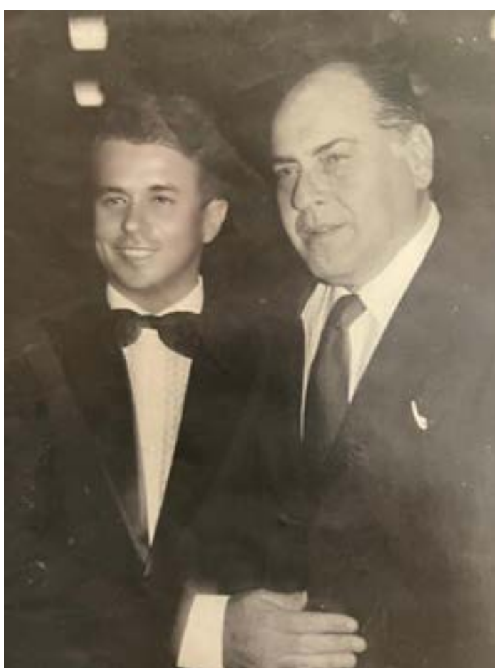
RELEMBRANDO: Como todos sabem, este jornalista trouxe a Montes Claros inúmeras personalidades políticas como presidentes, ministros, senadores, vários governadores para a grande noite das PERSONALIDADES DO ANO DO NORTE DE MINAS. E entre eles, um que veio por duas vezes foi o governador HÉLIO GARCIA, um dos políticos mais sábios da nossa história. Estou aí com o mesmo no Automóvel Clube