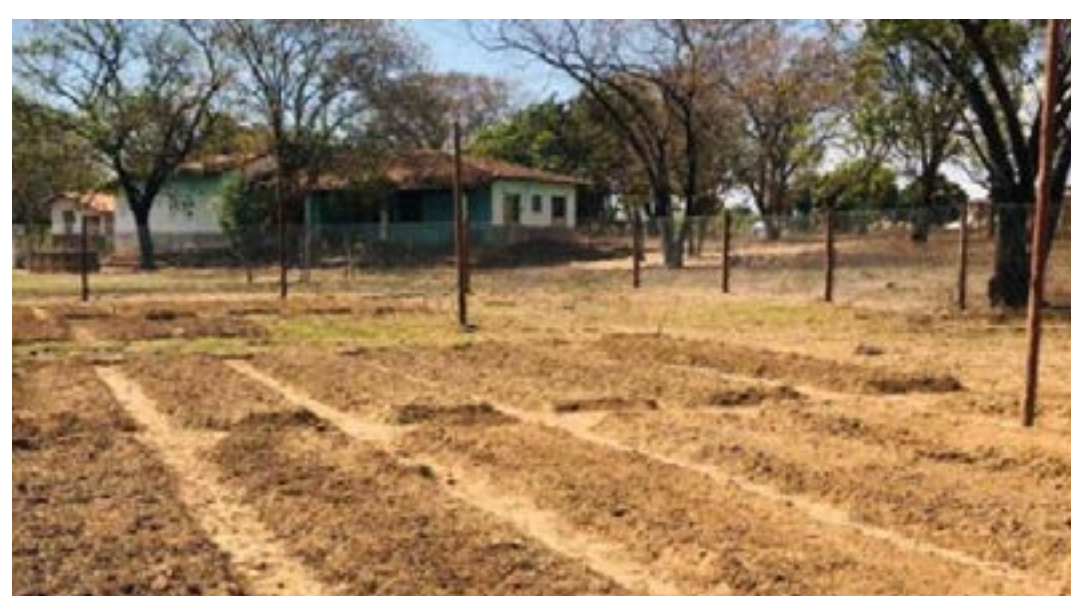
Comunidade local será beneficiada por programa de geração de renda e sustentabilidade

As famílias que foram selecionadas para participar preencheram os critérios que consideraram a renda e a vulnerabilidade dos cadastrados. A Fucam já possui hortas agroecológicas em Esmeraldas, na região Central do estado, e os municípios de Januária e de Juvenília, no Norte de Minas. (Agência Minas)