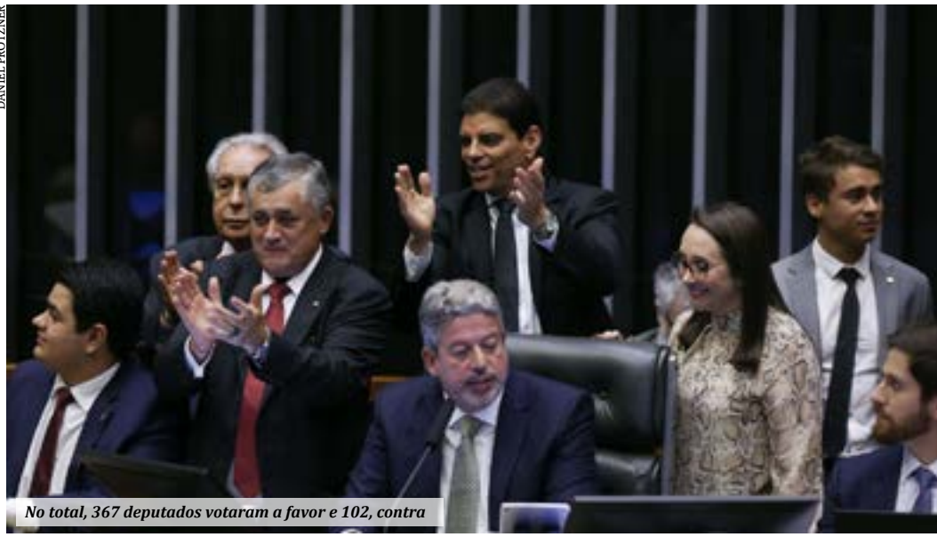
No total, 367 deputados votaram a favor e 102, contra

Mais cedo, em audiência pública na Câmara dos Deputados, o ministro da Fazenda, Fernando Haddad, afirmou que o novo arcabouço fiscal está sendo construído de forma a "despolarizar" o país e que tem conversado com parlamentares da base governista e da oposição em busca de apoio ao projeto. (Agência Brasil)