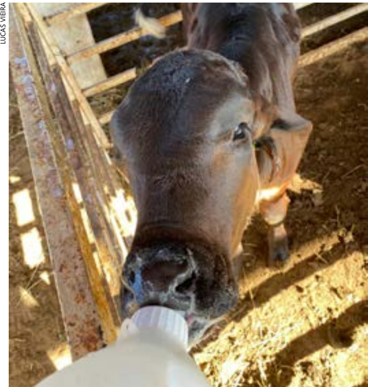
Animais receberam farinha de baru como parte da alimentação por 60 dias

De acordo com estudo, farinha de baru pode substituir parte do milho utilizado nos primeiros meses de vida dos animais