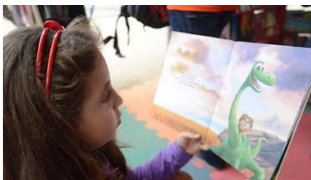
Brasil ficou entre os últimos em avaliação internacional

Em entrevista à Agência Brasil, o diretor do Instituto Interdisciplinaridade e Evidências no Debate Educacional (Iede), Ernesto Martins, destacou a importância de o país integrar uma pesquisa educacional comparativa. "É um marco o Brasil participar do PIRLS, essa avaliação de leitura, porque é importante o Brasil se comparar com o mundo para a gente ver de fato se a aprendizagem, o ensino que a gente está