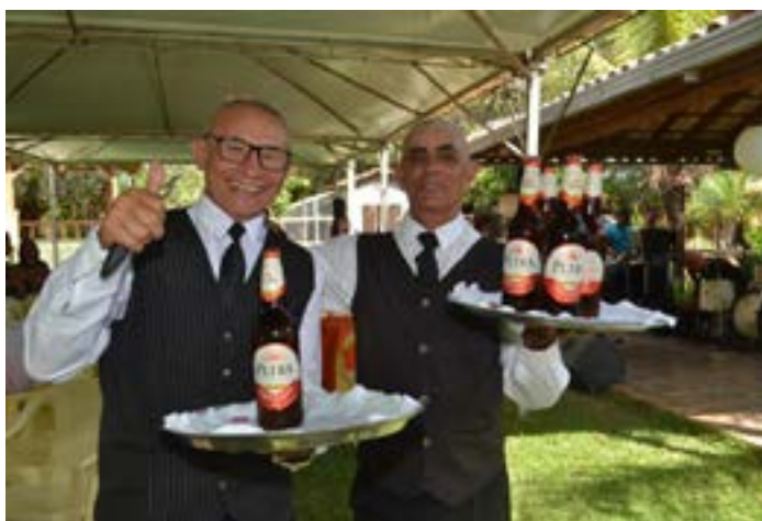
A EQUIPE de garçons do BUFFET MARILUCIA PIMENTA serviu a PETRA COM FARTURA e geladíssima

A Prefeitura de Moc, por meio da Secretaria Municipal de Meio Ambiente e Desenvolvimento Sustentável (SEMMA), faz a limpeza dos parques municipais de forma regular, mantendo os espaços sempre limpos e agradáveis. Infelizmente, porém, tem sido verificado o aumento do descarte irregular de resíduos nesses locais, especialmente após comemorações e encontros. Diante disso, a SEMMA solicita que os visitantes dos parques recolham seu lixo, principalmente os recicláveis, ao final das comemorações. É importante ressaltar que há lixeiras espalhadas por toda a área dos parques, facilitando o descarte correto dos resíduos. Levantar sacos plásticos para armazenar o lixo gerado durante as atividades é uma ótima dica para garantir o descarte correto dos resíduos. Dessa forma, todos saem ganhando: os parques ficam limpos, a população feliz, e o meio ambiente é protegido. A colaboração de cada visitante é essencial para manter esses espaços saudáveis e agradáveis para todos.