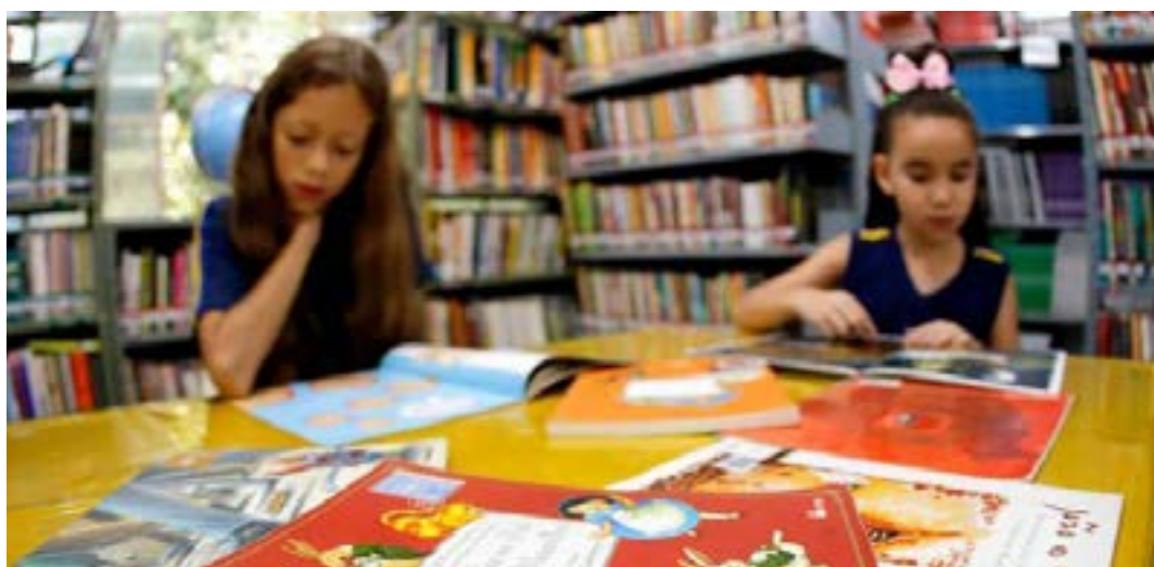
Primeira edição do ano selecionou escolas com as melhores taxas de participação na Avaliação Diagnóstica

O objetivo da iniciativa é reconhecer publicamente as práticas e experiências bem-sucedidas das escolas públicas estaduais com destaque nos resultados de participação, desempenho e fluxo escolar. (Agência Minas)