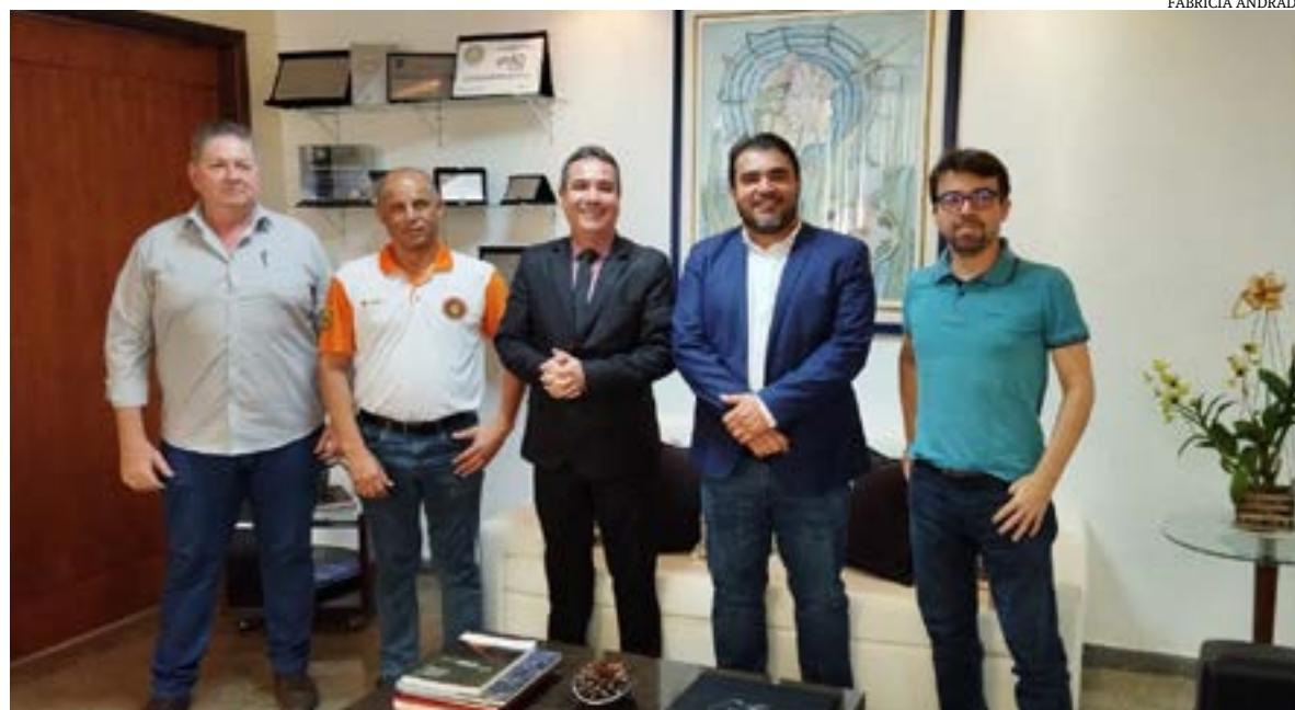
A Universidade Estadual de Montes Claros contribui com a produção de mel silvestre na região onde atua, a partir de ações conjuntas com a Cooperativa dos Apicultores e Agricultores Familiares do Norte de Minas (Coopemapi).