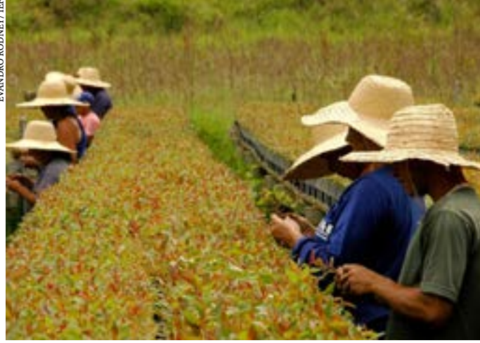
Iniciativa conecta prestadores de serviço e agentes públicos ou privados interessados em investimentos sustentáveis

Ampliar as possibilidades de financiamento de projetos de Pagamento por Serviços Ambientais (PSA) desenvolvidos em Minas Gerais, divulgando ações e fomentando parcerias. Essa é a proposta do Banco de Iniciativas de PSA, cadastro público, desenvolvido pela Secretaria de Estado de Meio Am-