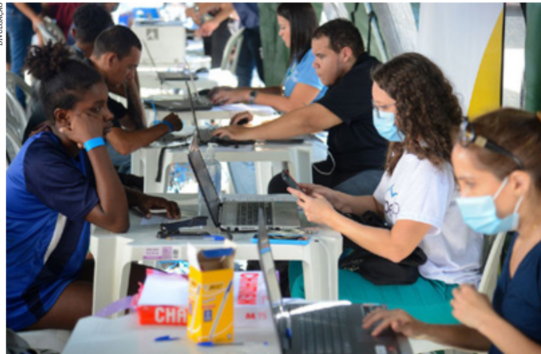
Foram emitidas certidões de nascimento para 6,8 mil pessoas