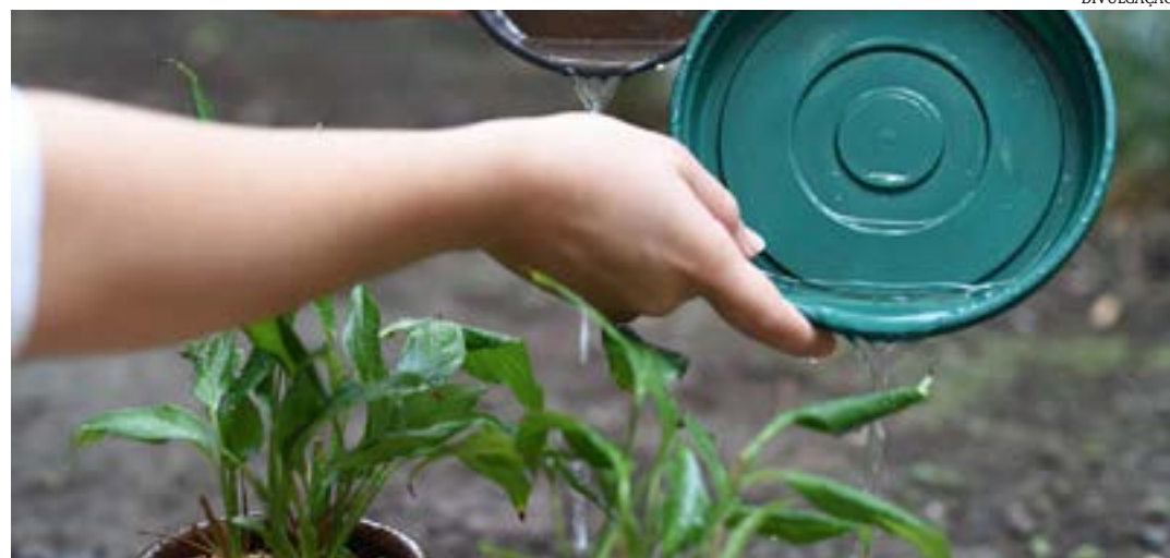
Ações para acabar com recipientes que contribui para a procriação das larvas do mosquito