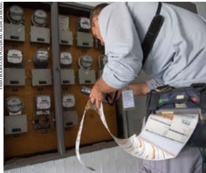
Dados sobre consumo poderão ser fornecidos pelo site da distribuidora

Intenção é permitir que o consumidor final fiscalize a atuação das estatais de energia elétrica