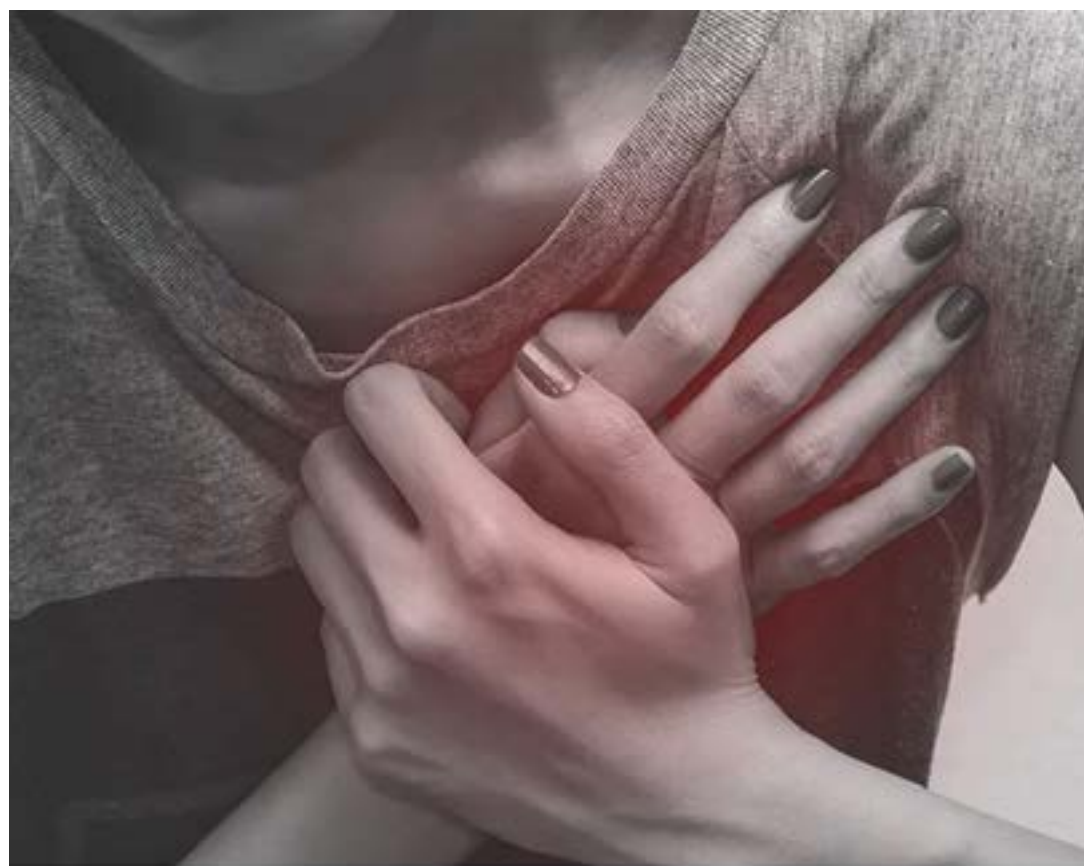
Especialista alerta que as mulheres precisam ficar atentas aos sintomas, que podem se apresentar de forma diferente nelas do que nos homens

A doença cardíaca é a principal causa de morte, não obstétrica, durante a gravidez e no pós-parto, e para quem já apresenta o problema. Os contraceptivos podem contribuir para a ocorrência de doenças cardiovasculares, apesar de atualmente serem menos agressivos, mas, se forem mal indicados e mal controlados, também podem causar efeitos colaterais. (Portal Jornal USP)