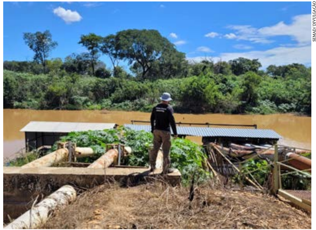
Ação teve como foco locais com alta demanda de recursos hídricos