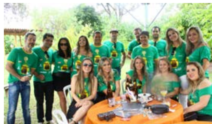
QUANDO A CAMISETA foi na cor verde, veja o animado grupo de nomes conhecidos