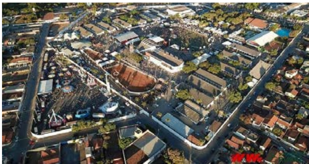
O Parque de Exposições João Alencar Athayde, onde acontece a feira