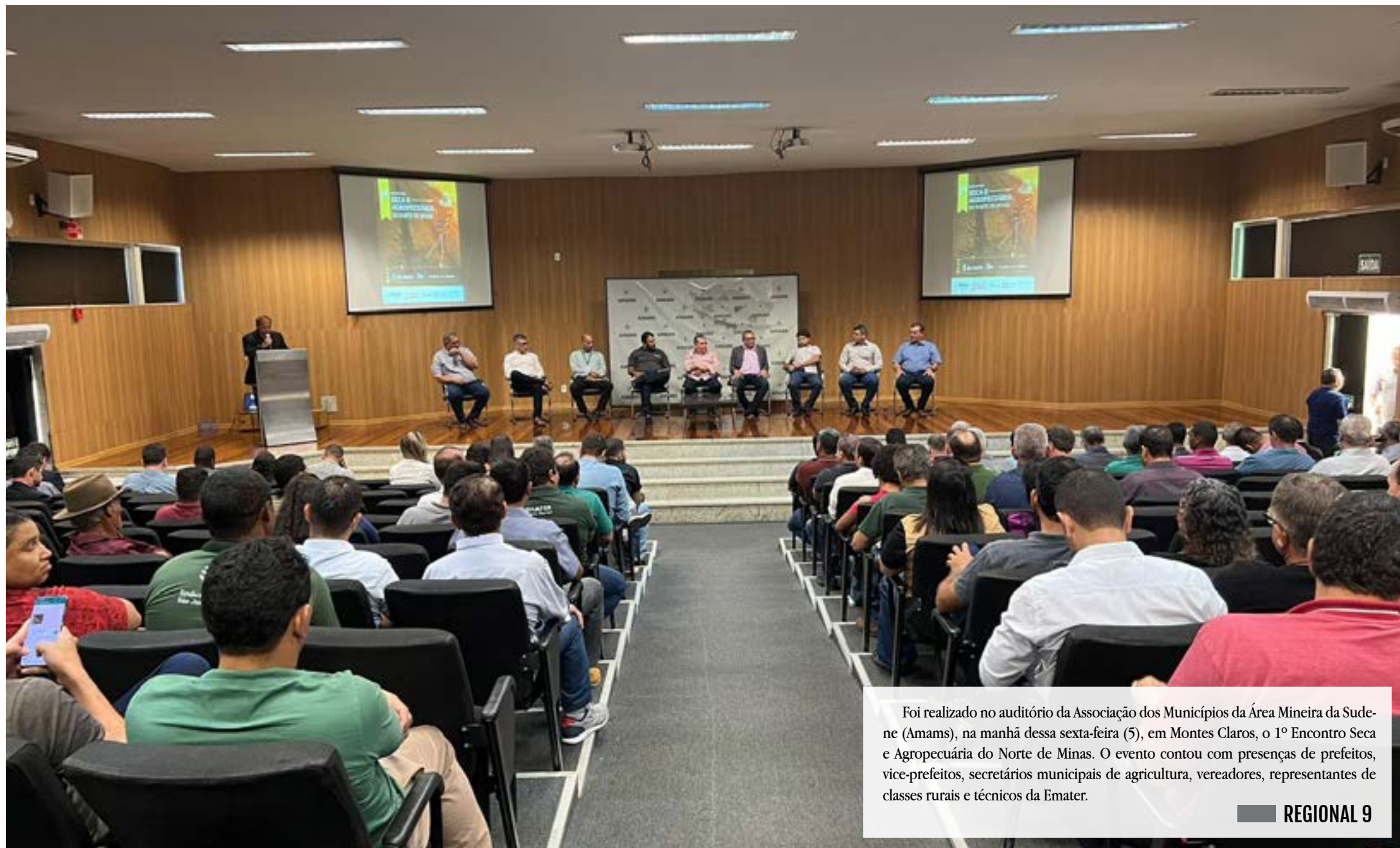
Foi realizado no auditório da Associação dos Municípios da Área Mineira da Sudeste (Amams), na manhã dessa sexta-feira (5), em Montes Claros, o 1º Encontro Seca e Agropecuária do Norte de Minas. O evento contou com presenças de prefeitos, vice-prefeitos, secretários municipais de agricultura, vereadores, representantes de classes rurais e técnicos da Emater.