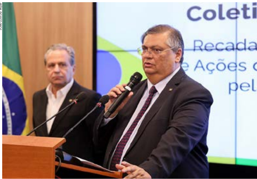
Ministro deve apresentar aos senadores os planos e a agenda estratégica da pasta da Justiça e Segurança Pública

O objetivo do projeto que recebeu aval dos parlamentares da FFO é permitir que municípios utilizem recursos provenientes de repasses do Estado que forem remanescentes de exercícios anteriores