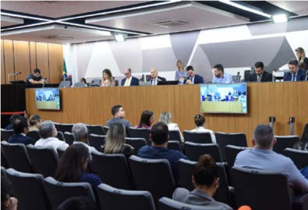
A remuneração dos hospitais que oferecem tratamento contra o câncer pelo SUS foi discutida em audiência pública