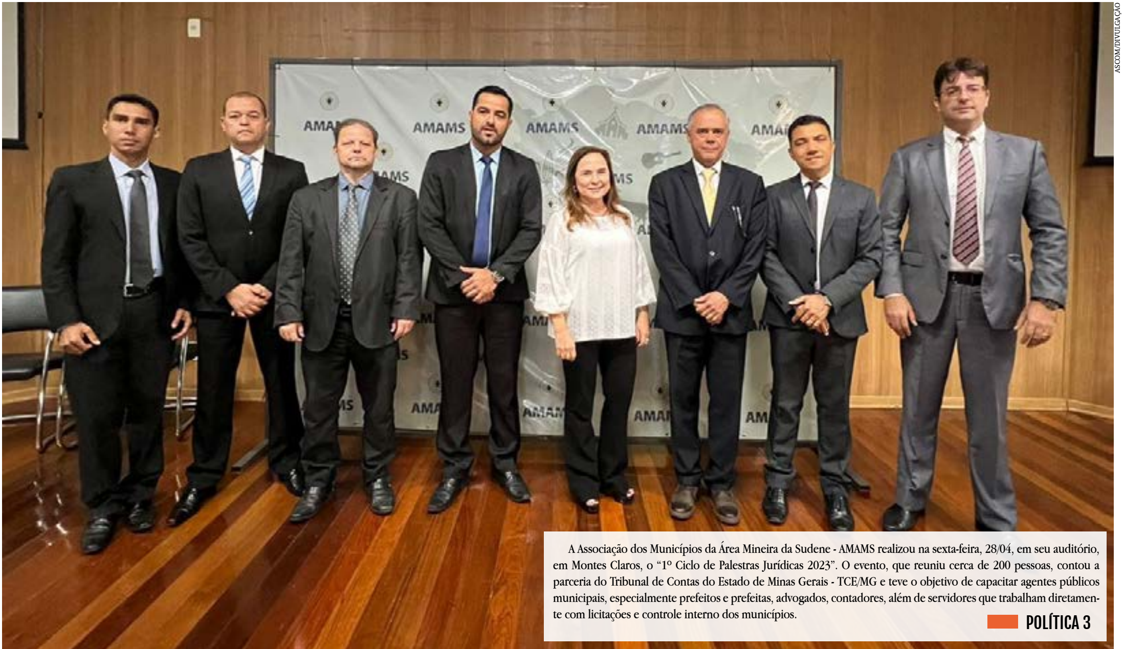
A Associação dos Municípios da Área Mineira da Sudene - AMAMS realizou na sexta-feira, 28/04, em seu auditório, em Montes Claros, o "1º Ciclo de Palestras Jurídicas 2023". O evento, que reuniu cerca de 200 pessoas, contou a parceria do Tribunal de Contas do Estado de Minas Gerais - TCE/MG e teve o objetivo de capacitar agentes públicos municipais, especialmente prefeitos e prefeitas, advogados, contadores, além de servidores que trabalham diretamente com licitações e controle interno dos municípios.