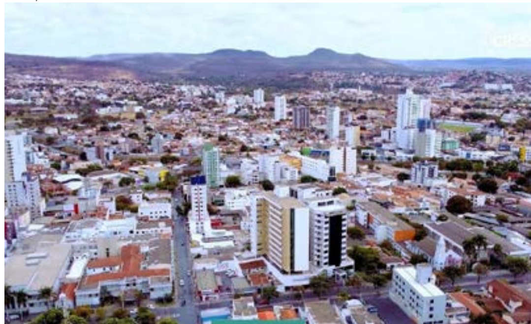
A cidade de Montes Claros também se destaca pela geração de empreendimentos

O Índice de Cidades Empreendedoras, realizado pela Escola Nacional de Administração Pública (Enap), entidade vinculada ao Ministério da Economia que capacita servidores públicos, mostra Montes Claros em 66ª posição no ranking nacional, e a 5ª posição entre as cidades mineiras. O estudo é realizado em parceria com a Endeavor, uma organização sediada na cidade de Nova York que apoia empreendedores com potencial de impacto econômico e social em suas regiões e utiliza, principalmente, bases de dados públicas, como o Produto Interno Bruto (PIB) do Instituto Brasileiro de Geografia e Estatística (IBGE) e o Índice de Desenvolvimento Humano (IDH), que é utilizado pelo Programa das Nações Unidas para o Desenvolvimento