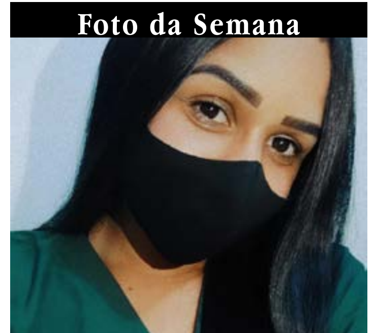
Foto da Semana