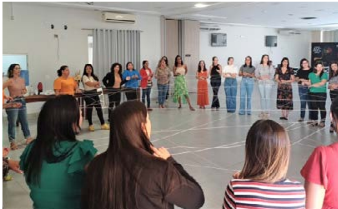
A formação realizada no auditório Cimams

vos conhecimentos por parte dos profissionais, sobretudo no que se refere à organização das atividades voltadas para o atendimento de demandas da população”. (Ascom SES-MG)