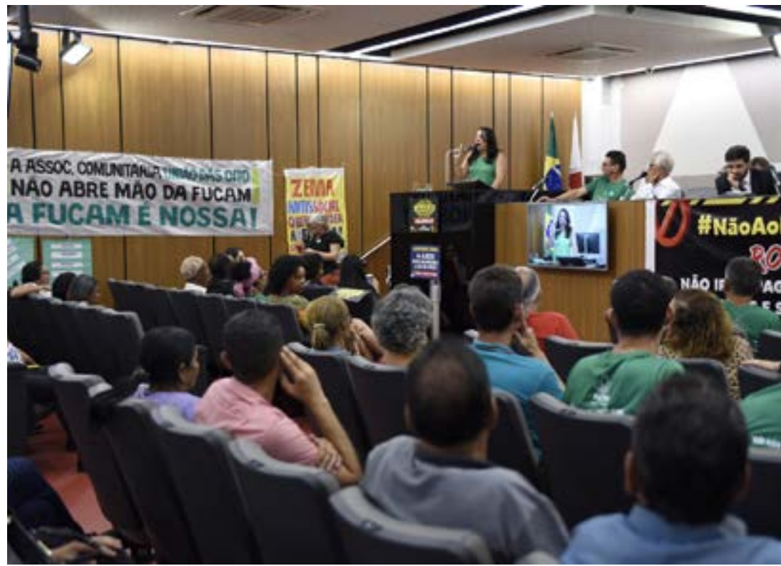
Extinção da Fundação Educacional Caio Martins está na pauta da Comissão e já foi tema de audiências anteriores.

Na Comissão de Constituição e Justiça (CCJ), o projeto recebeu parecer pela sua constitucionalidade na forma do substitutivo nº 1, novo texto que trouxe adequações de técnica legislativa, sem mudar o conteúdo do texto original. (Portal ALMG)