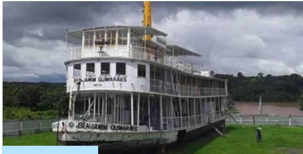
A reforma do Vapor está orçada em quase R$ 242 mil

Os Vereadores agradeceram os esclarecimentos feitos pelo dirigente da Emutur, lamentando a onda de desinformações, notícias falsas, boatos e mentiras que vem sendo propagadas entre a população e, principalmente, nas redes sociais