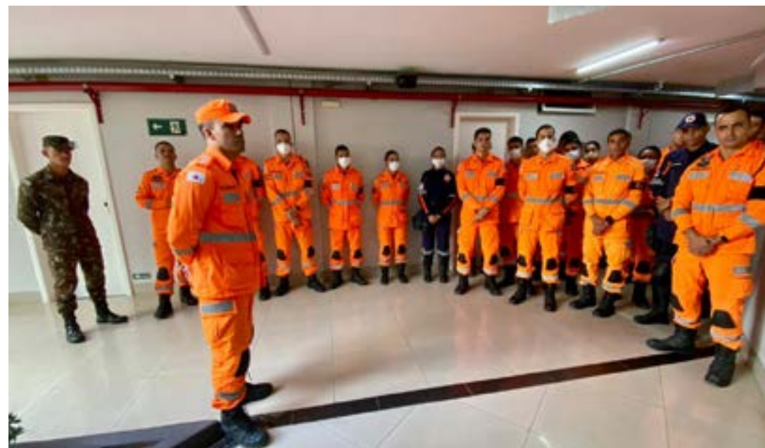
Alunos do Curso Técnico em Emergências Médicas visitam a unidade hospitalar

O Hospital Aroldo Tourinho recebeu na terça-feira (18), a visita dos alunos do Curso Técnico em Emergências Médicas (TEM), realizado pelo 4º Comando Operacional de Bombeiros Militar de Minas Gerais. A visita faz parte da programação do curso que encerrará dia 30 de abril. Estiveram presentes 31 alunos, incluindo integrantes do Corpo de Bombeiros, Exército e Samu.