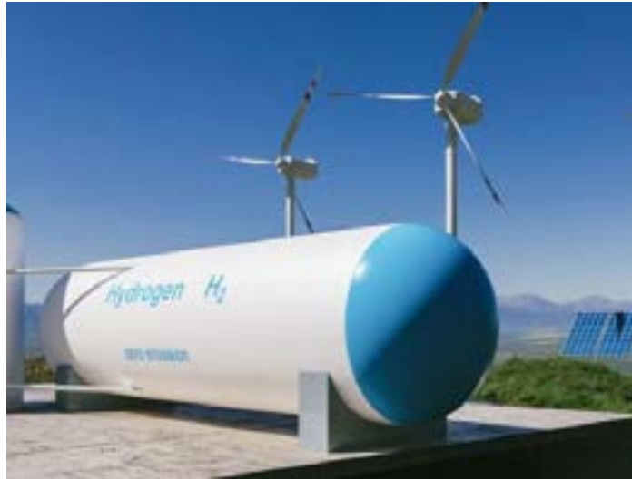
Além de infraestrutura para escoamento da sua produção, o hidrogênio de baixo carbono (H2V) exige a montagem de infraestrutura elétrica robusta