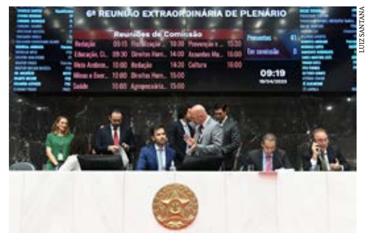
Durante a Reunião Extraordinária de Plenário desta quarta (19), três dispositivos foram votados em separado

poderão ser objeto de credenciamentos, contratos ou convênios. Ficam mantidas, contudo, na Polícia Civil as atividades e competências para realizar investigação criminal e exercer a função de polícia judiciária em matéria de trânsito. (Portal ALMG)