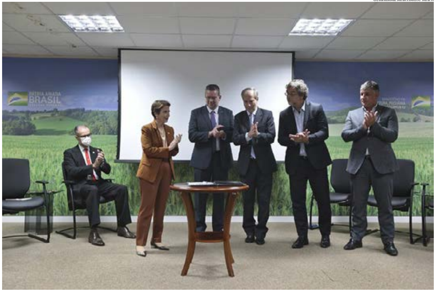
GUILHERME MARTIMON/ MAPA

gências da Anvisa e do Ibama, foi estabelecido na Portaria nº 410, publicada nesta quinta-feira (17). Conteúdos adicionais poderão ser ofertados para atender peculiaridades locais ou regionais, mas não constituirão impedimento ao registro de aplicador de agrotóxicos e afins previsto no Decreto nº 4.074, de 4 de janeiro de 2002. (Portal Ministério da Agricultura)