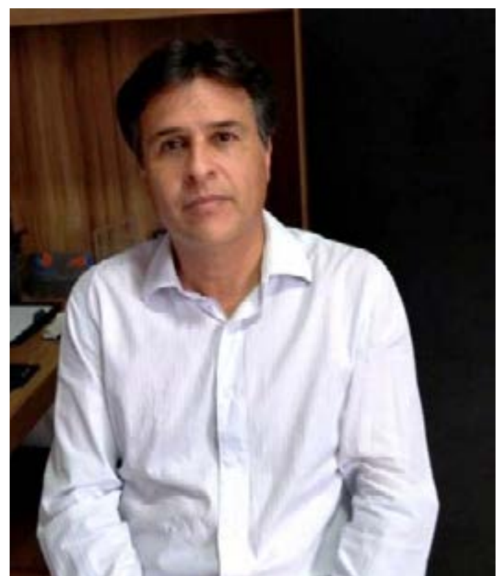
O professor é o novo integrante da Fapemig