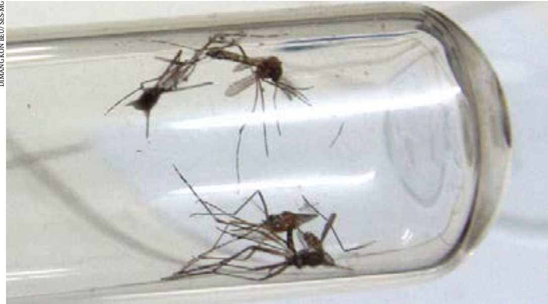
Não deixar água parada em pneus, pratos de plantas e outros objetos é fundamental para evitar a propagação do mosquito da dengue

Campanha alerta para os perigos da dengue, da chikungunya e da zika e traz dicas para se evitar a proliferação do mosquito