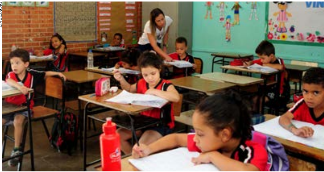
Estudantes público-alvo têm até o dia 19/4 para aderir ao programa que resgata habilidades e competências

O Reforço Escolar é uma estratégia já consolidada pela SEE/MG e mostrou que os jovens que participaram das atividades têm um maior aproveitamento em língua portuguesa e matemática em relação àqueles que também são público-alvo do programa, mas optaram por não participar. Em 2021, cerca de 80 mil estudantes participaram da iniciativa. Já em 2022, o programa atendeu cerca de 90 mil estudantes. (Agência Minas)