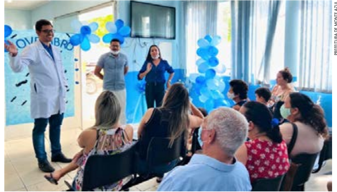
PREFEITURA DE MONTE AZUL

As equipes de Estratégia de Saúde da Família visam a reversão do modelo assistencial vigente, onde predomina o atendimento emergencial ao doente. As famílias passam a ser objeto de atenção no ambiente em que vivem, permitindo uma compreensão ampliada do processo saúde/doença. Isso inclui ações de promoção da saúde; prevenção, recuperação e reabilitação de doenças e agravos mais frequentes.