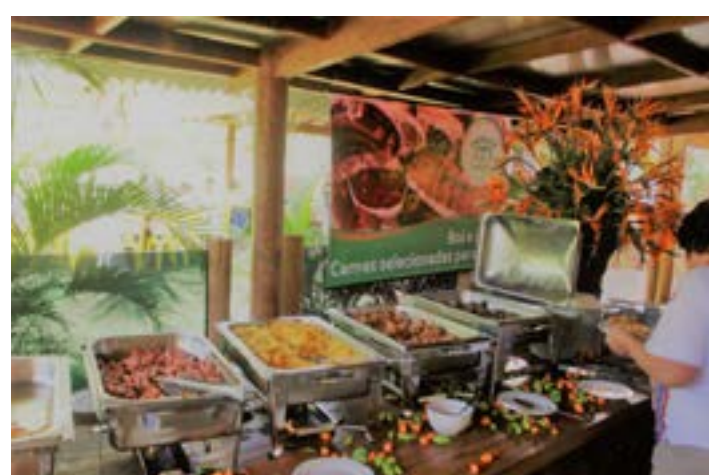
UM DOS APARADORES com comida de buteco