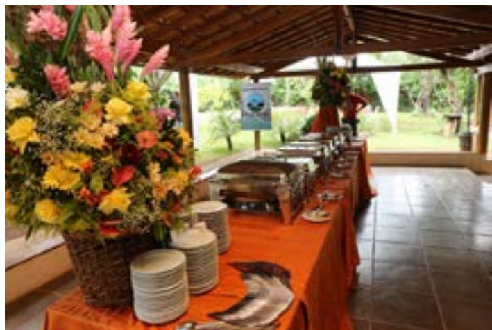
A FEIJOADA DO THEO, como sempre digo, continua 'esquentando', por isso mesmo neste sábado lanço mais uma página especial com outras presenças que estão sempre me prestigiando. Na foto belíssimo arranjo, feito por César Costa, com flores de Vanilda Miranda