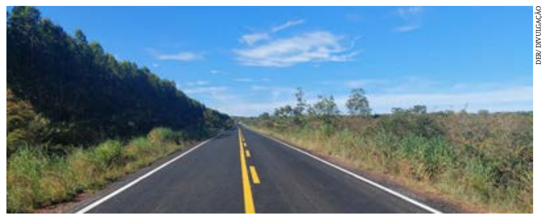
Trecho de 25 quilômetros fica na MGC-367, principal conexão de Minas com o estado da Bahia

A estrada é uma das principais ligações de Minas com a Bahia. Por ela trafegam grande volume de carretas e caminhões transportando eucaliptos cultivados em território mineiro com destino à indústria de celulose da Bahia.