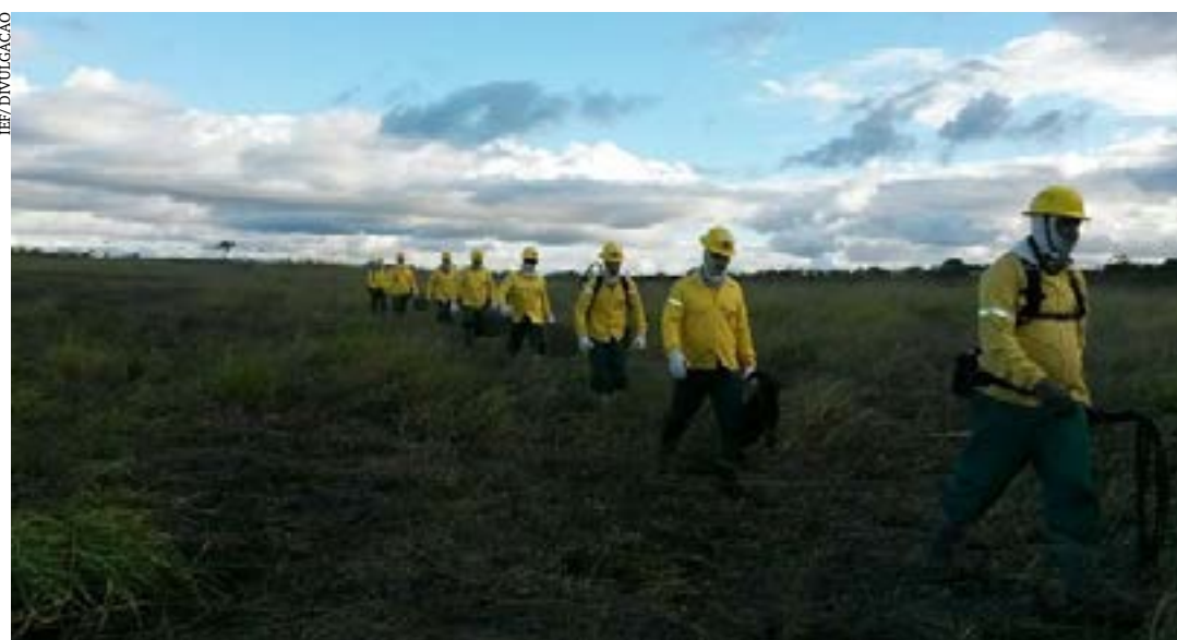
Inscrições para o processo seletivo simplificado podem ser feitas a partir do dia 10/4

Os resultados parcial e final do processo seletivo serão disponibilizados no sítio eletrônico do IEF e nas Unidades de Conservação/Locais de atuação constantes no Edital. (Agência Minas)