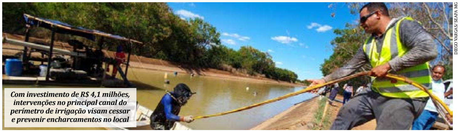
Com investimento de R$ 4,1 milhões, intervenções no principal canal do perímetro de irrigação visam cessar e prevenir encharcamentos no local

PROJETO JAÍBA - Localizado nos municípios de Jaíba e Matias Cardoso, o Perímetro de Irrigação do Jaíba é considerado o maior projeto