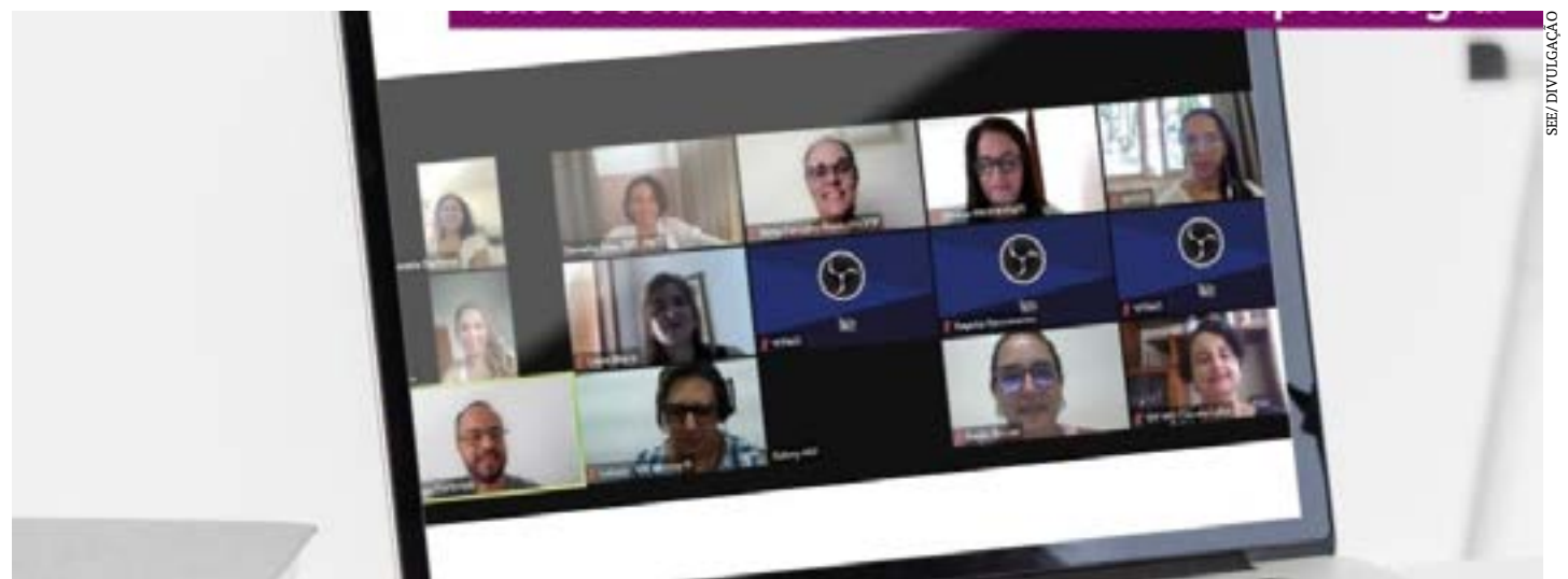
Estado capacita profissionais que atuam nas 721 escolas que oferecem a modalidade para ampliar qualidade e o alcance das estratégias curriculares

Durante os dias de formações, a equipe escolar, EEBCG, analistas e funcionários das SREs e escolas tiveram a oportunidade de alinhamento do modelo pedagógico e de gestão das escolas EMTI com a equipe de implantação.