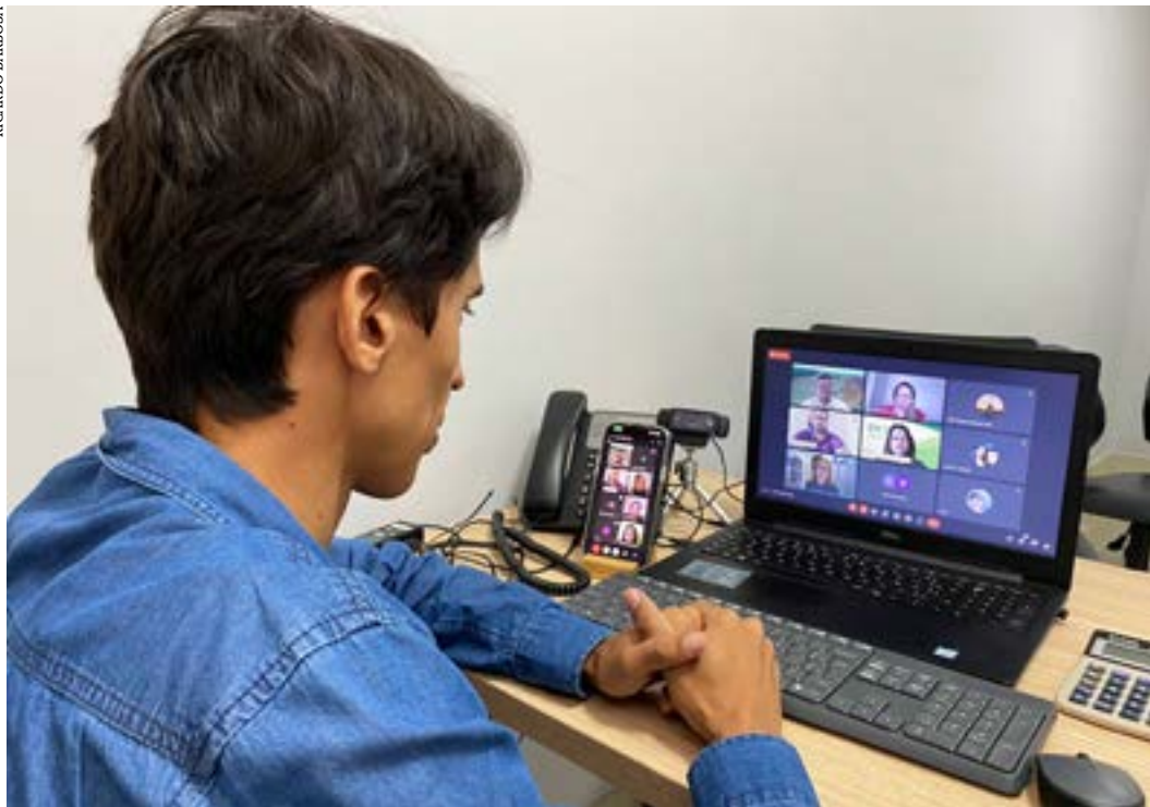
Mudança proposta pela reforma administrativa do governo foi criticada, porque não traria melhorias para as universidades

O texto da reforma administrativa apresentado pelo Governo do Estado rebaixa e desvaloriza as universidades públicas estaduais. A constatação é de representantes da Universidade Estadual de Montes Claros (Unimontes) e da Universidade Estadual de Minas Gerais (Uemg) e foi feita durante audiência pública da Comissão de Educação, Ciência e Tecnologia da Assembleia Legislativa de Minas Gerais (ALMG) realizada nessa quarta-feira (29).