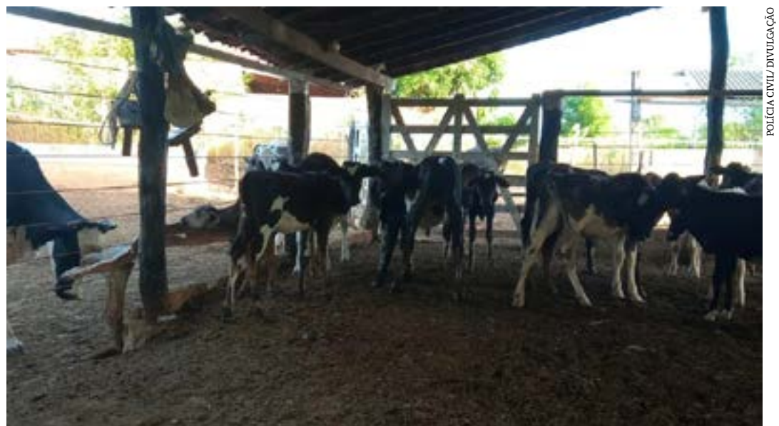
Parte do dinheiro desviado foi utilizado para a compra de cabeças de gado

O homem foi conduzido ao sistema prisional e se encontra à disposição da Justiça. O Instituto Municipal de Previdência dos Servidores Públicos de Espinosa informou em nota que o suspeito foi exonerado do cargo e que uma investigação interna será realizada.