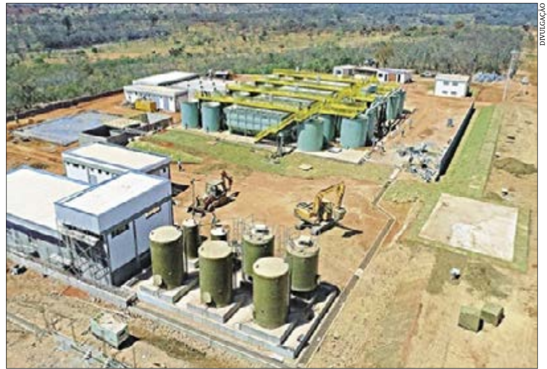
A Estação de Tratamento de Água, em Montes Claros

Claros, foi determinado à Copasa cancelar reajuste feito em 2017 e descontar das contas as repercussões daquele aumento. A Copasa não cumpriu aquela decisão por 29 meses. O Ministério Público então obteve do Judiciário, no fim do ano passado, ordem suspendendo o aumento de cerca de 15% previsto para janeiro deste ano enquanto a Copasa não começar a devolver aos consumidores o que devia ter descontado de suas contas naqueles 29 meses. A Copasa, após tentar sem sucesso derrubar a decisão junto à Presidência do TJMG, começa a cumpri-la em Montes Claros, sob a fiscalização do MP, do Município e da Amasbe. Vitória do consumidor de Montes Claros. Algumas contas já estão vindo zeradas em virtude do início da devolução da cobrança indevida ocorrida durante 29 meses.