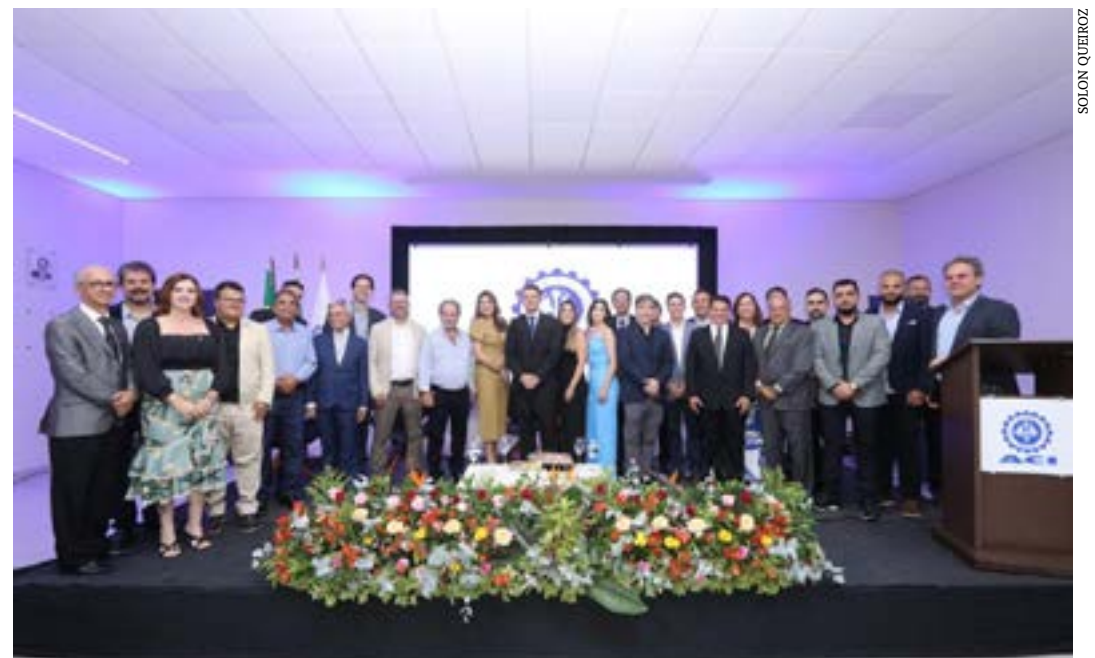
A nova diretoria