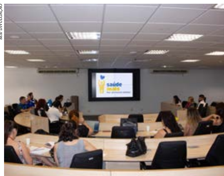
Ações de enfrentamento à dengue, zika e chikungunya foram desenvolvidas durante a semana

A Secretaria de Estado de Saúde de Minas Gerais (SES-MG) reuniu-se em Belo Horizonte, com representantes do Centro de Operações de Emergência (COE Arboviroses) do Ministério da Saúde (MS) e membros da Organização Panamericana de Saúde (Opas) para encerramento da visita técnica das duas entidades realizada nesta semana para apoio às ações de enfrentamento à dengue, zika e chikungunya no estado.