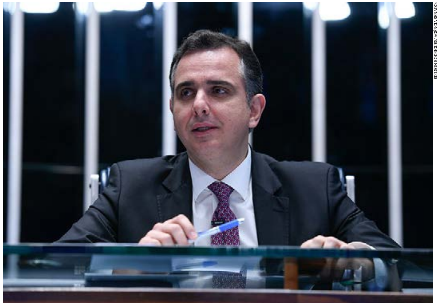
Projeto de Pacheco, de nova lei do impeachment, tem regras processuais detalhadas e estende número de crimes de responsabilidade e de autoridades que podem ser punidas com o afastamento definitivo

República que constituir, organizar, integrar, manter, financiar ou fazer apologia de grupos armados, civis ou militares, contra a ordem constitucional e o Estado Democrático. Outro crime previsto é fomentar a insubordinação das Forças Armadas ou dos órgãos de segurança pública.