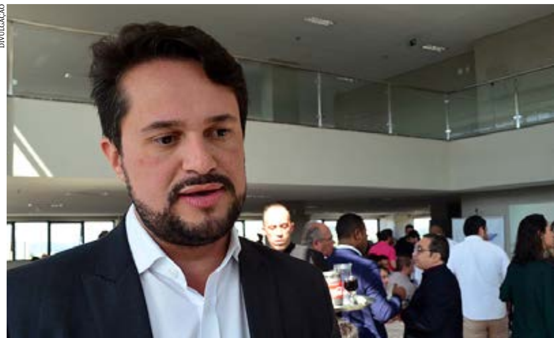
Fernando Passalio destaca a importância da interiorização de oportunidades

O secretário de Estado de Desenvolvimento Econômico, Fernando Passalio, reforça que o avanço socioeconômico proporcionado por iniciativas como a 6ª Semana do Artesão Mineiro, é fundamental para alavancar as oportunidades geradas para estes profissionais em todas as partes do estado. Ele ainda destaca a importância da interiorização das oportunidades para a geração de negócios e renda nos municípios. "O Governo de Minas entende como fundamental o impulsionamento das atividades artesanais, principalmente no interior do estado, como forma de enaltecer a nossa história, cultura e identidade, bem como, criar mais empregos e aumentar a renda do cidadão mineiro", explica Passalio.