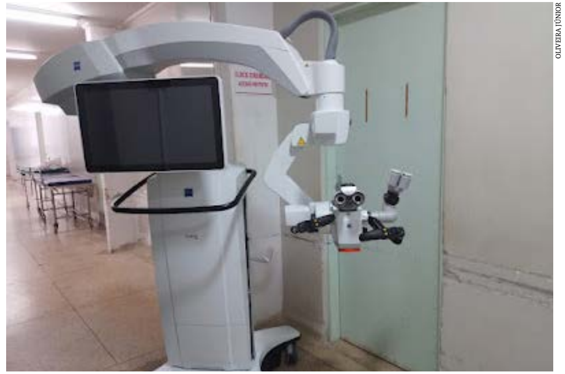
Novo equipamento irá aprimorar a qualidade da assistência prestada aos pacientes SUS

Constante capacitação dos profissionais, saúde hospitalar humanizada, valorização dos funcionários com melhorias salariais e pagamento em dia são algumas de várias ações positivas que o Hospital Regional tem recebido desde janeiro de 2021 com a atual direção. (OLIVEIRA JÚNIOR – Colaborador)