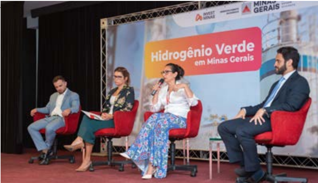
Encontro faz parte de série que vai debater oportunidades e desafios do novo setor de energia limpa