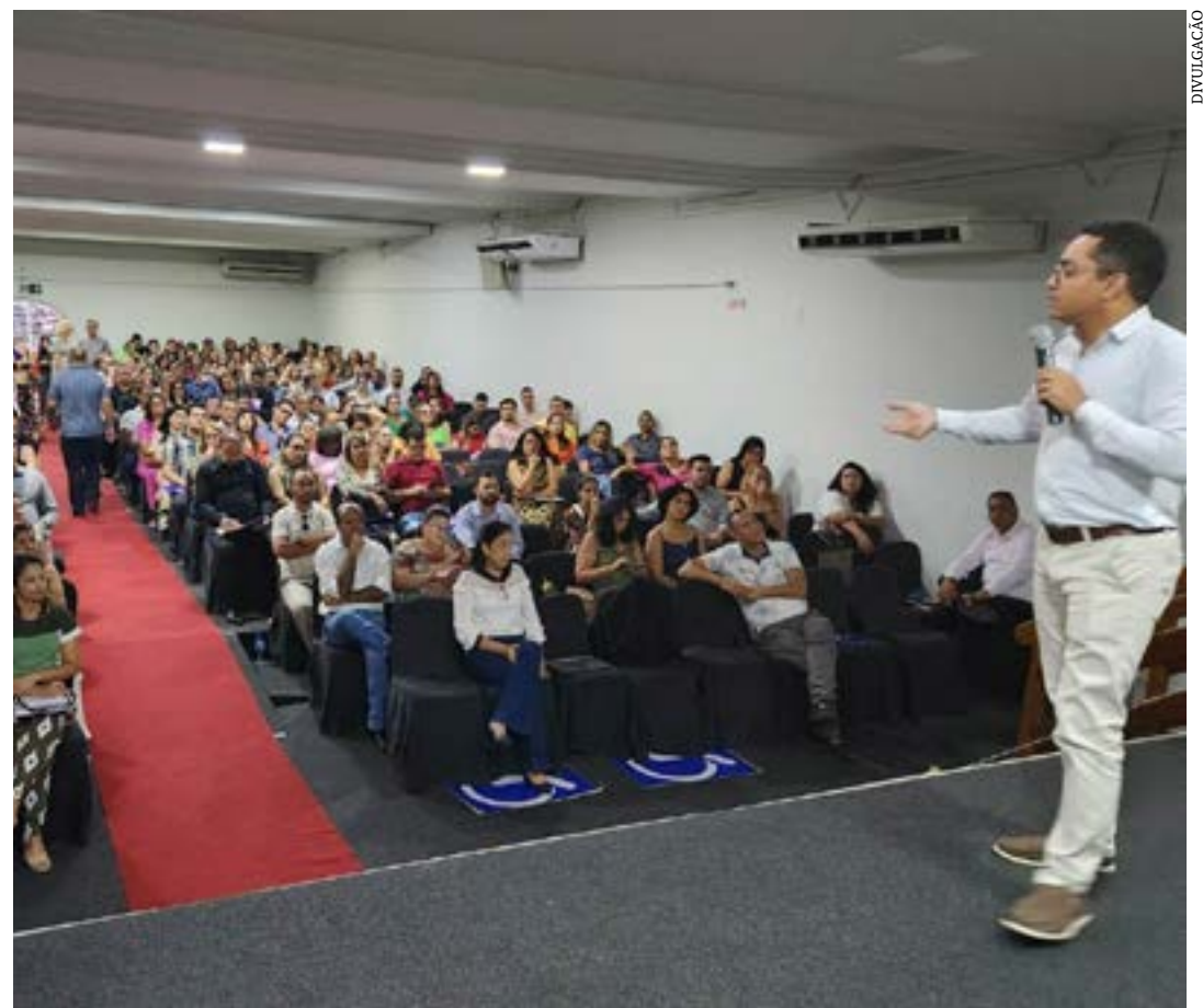
Secretário Igor de Alvarenga e equipe se reuniram com diretores e inspetores escolares; ação integrada para alinhar metas e ampliar qualidade do ensino na rede estadual

Também em Montes Claros, a Escola Estadual Secundino Tavares, do bairro Jardim Panorama II, recebeu a equipe da SEE/MG que conheceu espaços, servidores e atividades desenvolvidas na unidade. (Agência Minas)