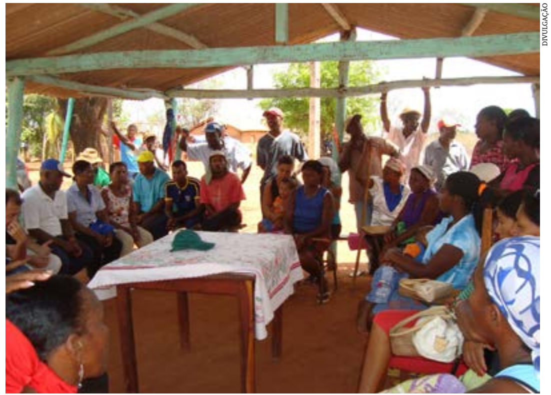
Reunião no quilombo Brejo dos Crioulos, em São João da Ponte

“A promoção de direitos para as comunidades quilombolas no Brasil é um ato de reparação à enorme dívida histórica que o Estado brasileiro tem com estas populações. A partir do Programa Aquilomba Brasil, no eixo acesso à terra, vamos organizar, junto com o Incra, uma agenda nacional de titulação, que começa com os títulos entregues hoje pelo nosso presidente”, afirmou a ministra da Igualdade Racial, Anielle Franco. A titulação, de responsabilidade do Instituto Nacional de Colonização e Reforma Agrária (Incra), é a última etapa do processo de reconhecimento de um território tradicional.