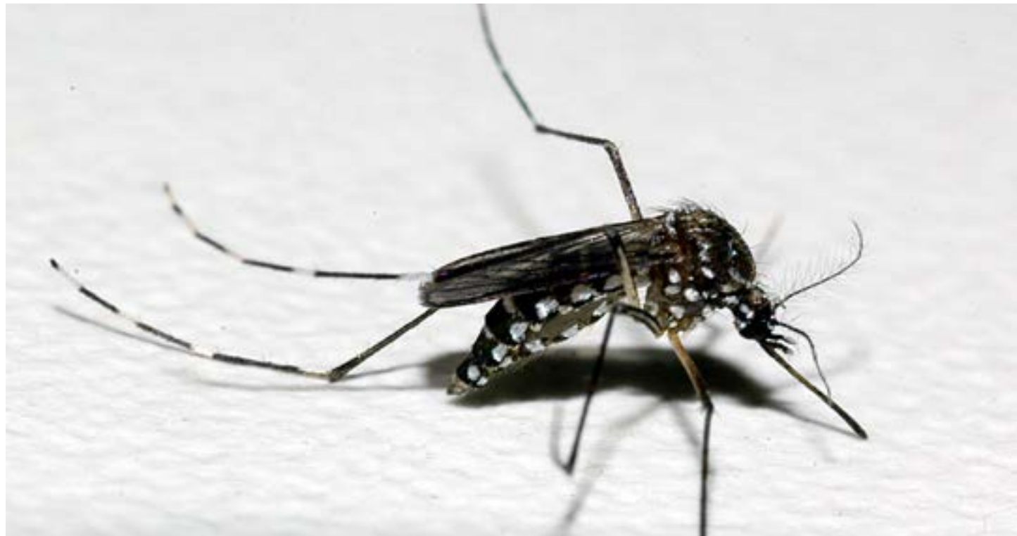
Parceria vai integrar e fortalecer ações, além de capacitar equipes dos municípios

Quanto ao vírus zika, até o momento foram registrados 130 casos prováveis. Há seis casos confirmados para a doença e não há óbitos por zika em Minas Gerais, até o momento. (Agência Minas)