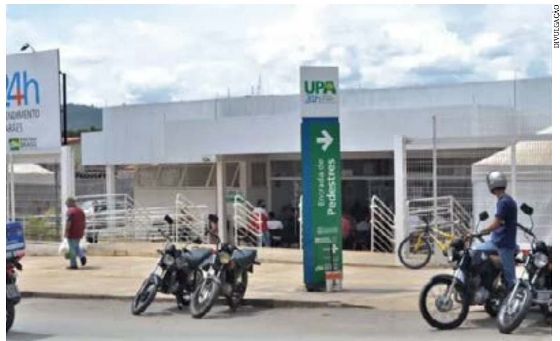
UPA Chiquinho Guimarães

A previsão é de que o primeiro ciclo de implantação do PNGC, contemplando 31 Unidades de Pronto Atendimento, seja iniciado a partir deste mês. Ao todo serão nove etapas, com término previsto para junho de 2024.