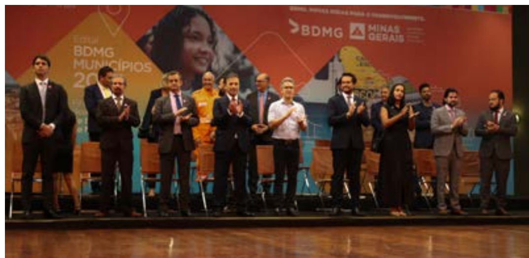
Condições inéditas facilitam o acesso de municípios ao crédito, para desenvolvimento de ações essenciais que melhoram a vida dos mineiros

As linhas de crédito foram simplificadas em três vertentes de atuação: Cidades Sustentáveis (saneamento, geração de energia solar,