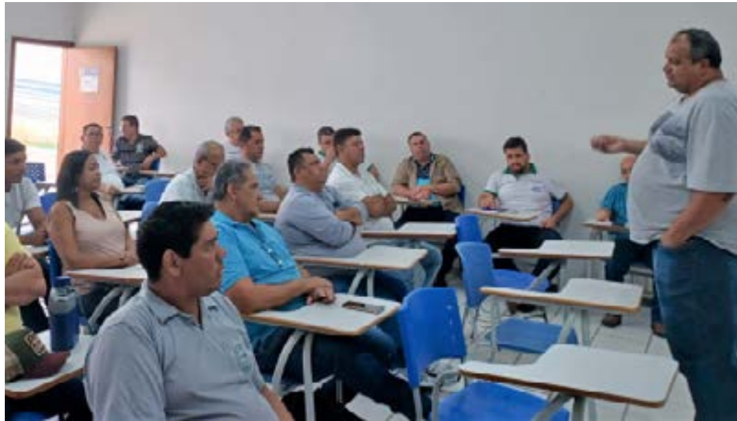
Documento apresentado pela Secretaria de Estado de Saúde estabelece estratégias e políticas públicas de combate à doença

Além da prorrogação do prazo para aplicação dos recursos, a Resolução 8.386 viabilizou novo repasse de incentivo financeiro aos municípios para aplicação em ações de enfrentamento das arboviroses. Para o Norte de Minas isso representou, no segundo semestre de 2022, novo aporte superior a R$ 3,6 milhões. (Ascom SES-MG)