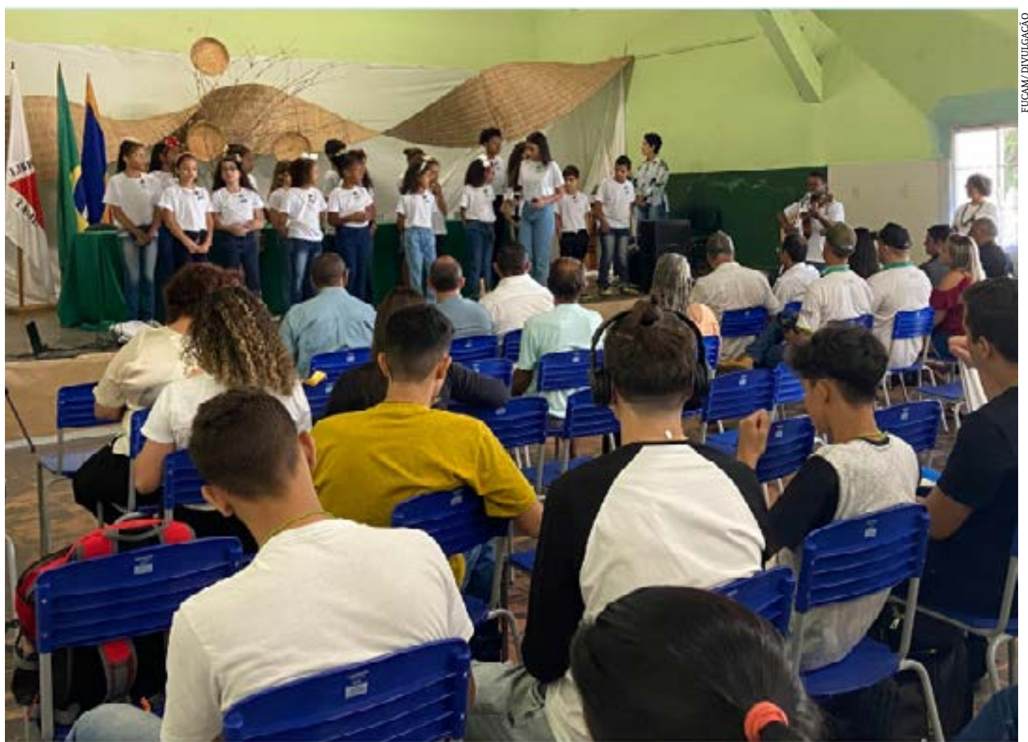
Inserida em diferentes realidades, instituição também promove capacitação em áreas como apicultura, hortas orgânicas e comunitárias, panificação e processamento de alimentos

Hoje, 2.137 alunos estão matriculados nas oito escolas