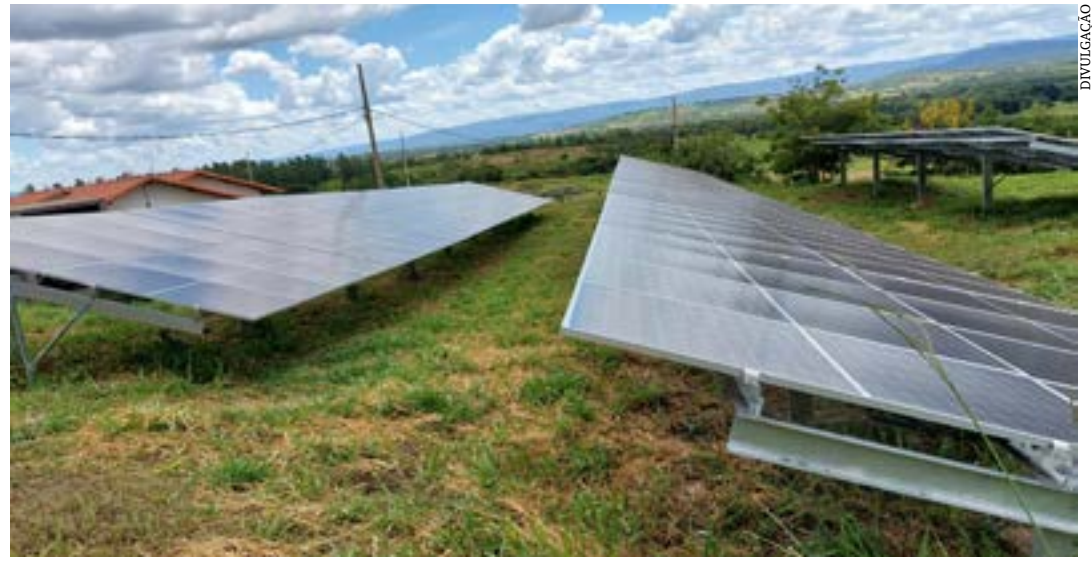
O evento visa inserir os pequenos negócios na cadeia de geração distribuída de energia fotovoltaica

O território mineiro responde sozinho por 14,5% de toda a potência instalada de energia solar