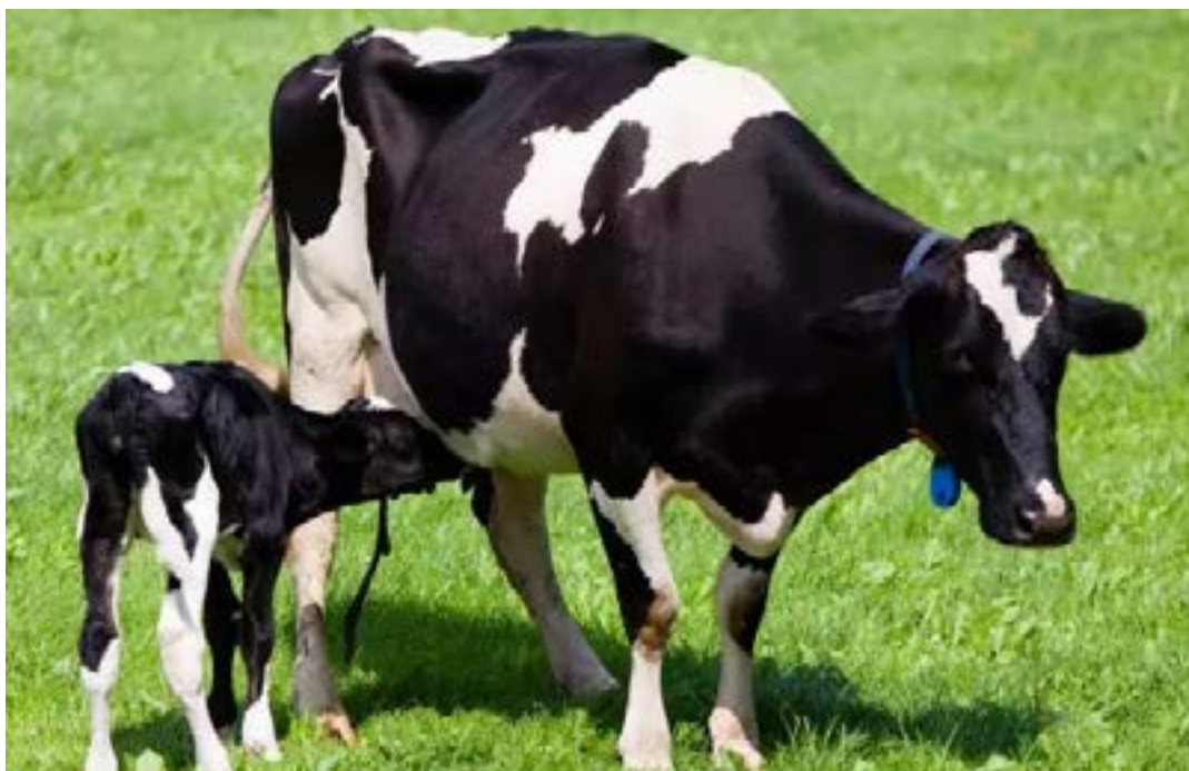
O ideal é que o bezerro seja encorajando a consumir alimentos sólidos como os concentrados iniciais a partir do quarto dia de vida

Podemos concluir que o processo de crescimento das papilas do rúmen é autogerado e permite que bezerras alimentados com concentrados ainda nas primeiras semanas de vida tenham desenvolvimento ruminal em idade precoce, o que promove o desmame precoce. (Portal Comprerural)