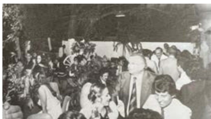
RECORDAR É VIVER - Como sempre digo: para refrescar a memória de todos, pois não custa nada lembrar que comandeí a noite montes-clarense durante 12 anos como proprietário, do histórico, THEO-HOUSE no final da década de 1970 e parte da 1980. Era onde tudo acontecia e tinha um grande espaço para eventos, onde haviam grandes bailes, e ficava superlotado como estão vendo nesta foto. Era um complexo como digo como tinha também, boate, barzinho e a famosa pista de patins. Bons tempos...