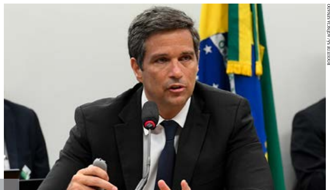
Roberto Campos Neto pode ser convidado pela CAE a explicar as altas taxas de juros

Aumentar, diminuir ou manter a Selic depende de como o Copom avalia riscos e oportunidades no cenário macroeconômico.