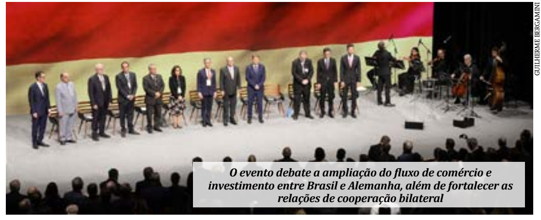
O evento debate a ampliação do fluxo de comércio e investimento entre Brasil e Alemanha, além de fortalecer as relações de cooperação bilateral

Entre os dias 13 e 14 de março, o EEBA promove debates sobre a ampliação do fluxo de comércio e investimento entre Brasil e Alemanha, além de fortalecer as relações de cooperação bilateral. A programação abrange visitas técnicas a empresas e encontros de negócios.