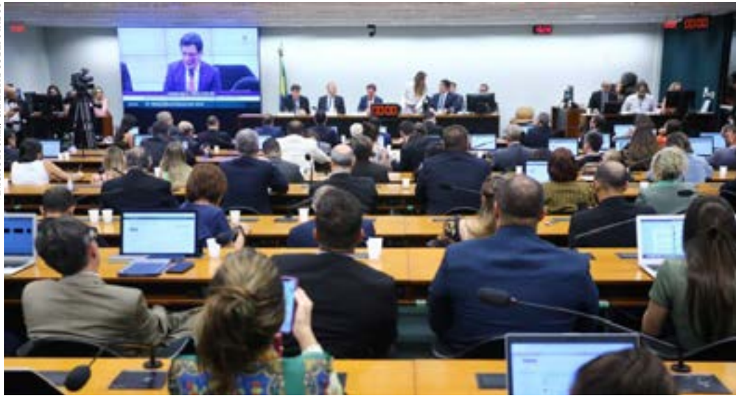
Audiência pública do grupo de trabalho da reforma tributária

O grupo de trabalho da reforma tributária (PEC 45/19) promove audiência pública nesta terça-feira (14) para tratar do diagnóstico do sistema tributário atual. O debate foi proposto pelos deputados Sidney Leite (PSD-AM) e Ivan Valente (Psol-SP).