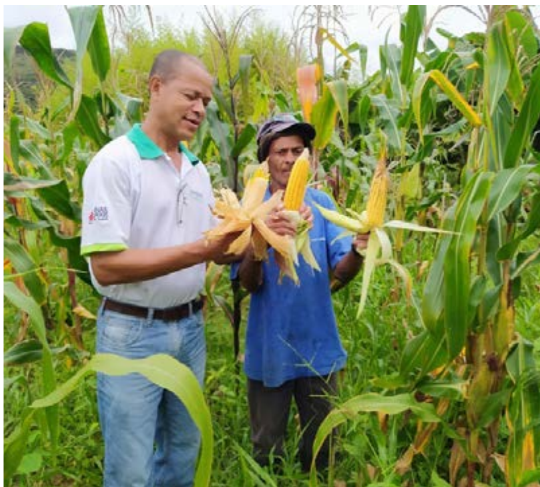
Emater-MG estima que segunda safra do grão pode ser uma das maiores dos últimos anos