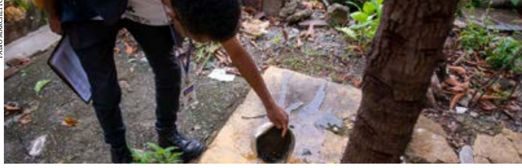
Ferramenta desenvolvida pela Secretária de Estado de Saúde (SES-MG) é aberta à população e facilita visualização da ocorrência das doenças em MG

O Governo de Minas, por meio da Secretaria de Estado de Saúde de Minas Gerais (SES-MG), lançou o Painel Arboviroses: Vigilância Epidemiológica, um portal de internet para a divulgação dos casos, óbitos e incidência de dengue, chikungunya e zika no estado. A ferramenta traz maior visibi-