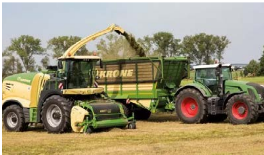
O agronegócio tem aumentado a sua demanda por novas formas de acesso a consórcio para aquisição de maquinários agrícolas

taxas mais atrativas e de forma mais célere, o que também gera o aumento da competitividade no setor. "Ainda, em razão do open finance, houve o aumento das possibilidades para os consumidores, quando iniciou-se o compartilhamento de dados das instituições financeiras com o BC, trazendo melhores taxas com melhores condições de pagamento, soluções mais personalizadas e menos burocracia e demora para conseguir oferecer um produto ou serviço para o cliente", salienta a advogada. O processo de modernização do ambiente regulatório no país vem favorecendo cada vez mais a oferta de crédito, seja por meio de fintechs e cooperativas, com taxas de juros mais competitivas e processos menos burocráticos. (Portal Comprerural)