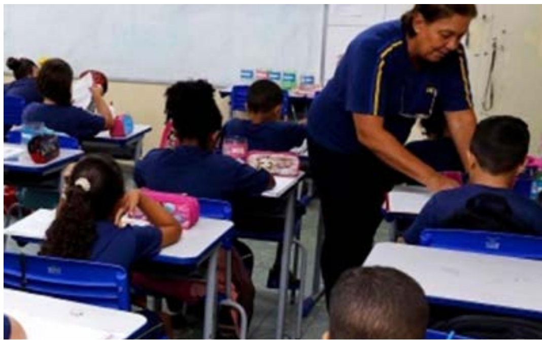
Objetivo é implementar atividades pedagógicas diferenciadas, com foco em melhorias e propósito de atenuar efeitos negativos do período de isolamento social