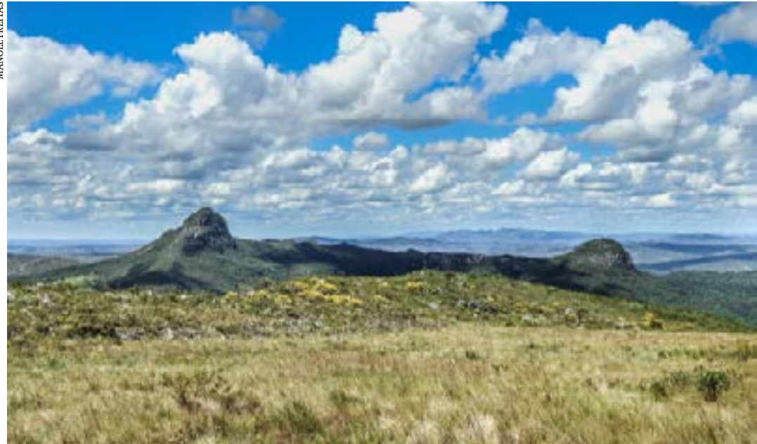
Iniciativa pretende estimular o turismo e o desenvolvimento econômico nos cinco municípios do Norte de Minas e Vale do Jequitinhonha que integram o destino