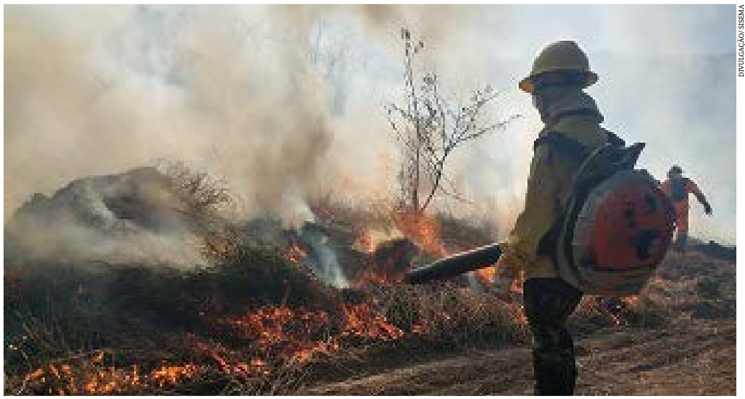
A prática foi regulamentada em 2020