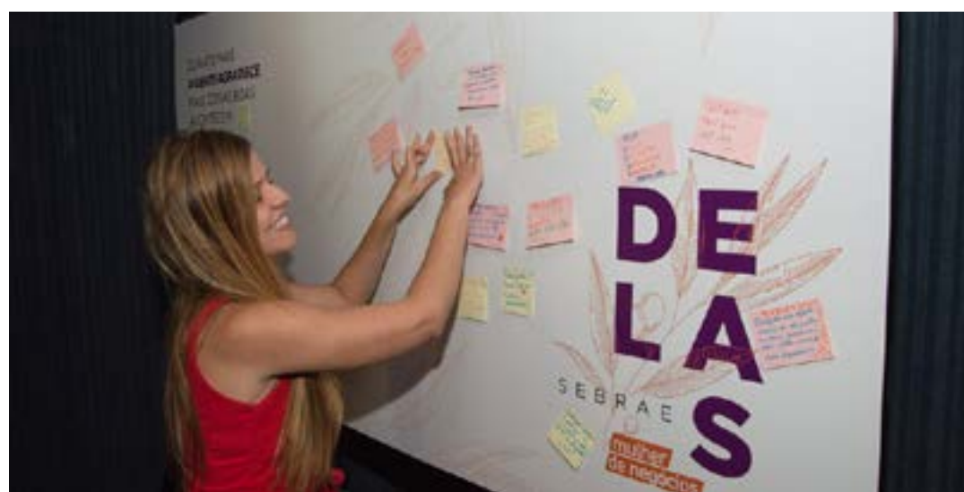
Programa visa estimular o empreendedorismo feminino, e será desenvolvido em Barrocão, Bocaina e Vila do Sítio

Os interessados podem se inscrever pelo link: https://docs.google.com/forms/d/e/1FAIpQLSdLMQbTuG46Xkvo07IAsXaGBZk8BZMm0zGi-sOCz-G4505HNPQ/viewform . (Agência Sebrae)