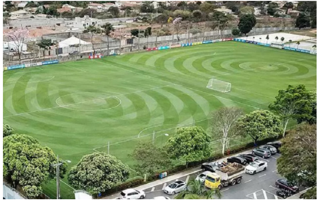
Segundo o Cruzeiro, Toca da Raposa II tem 83 mil metros quadrados

Recentemente, a Direcional Engenharia lançou os condomínios Conquista Lagoa e Conquista Pampulha, a poucos metros de distância da Toca da Raposa II. As unidades com 2 dormitórios variam de R$ 170 mil a R$ 200 mil.