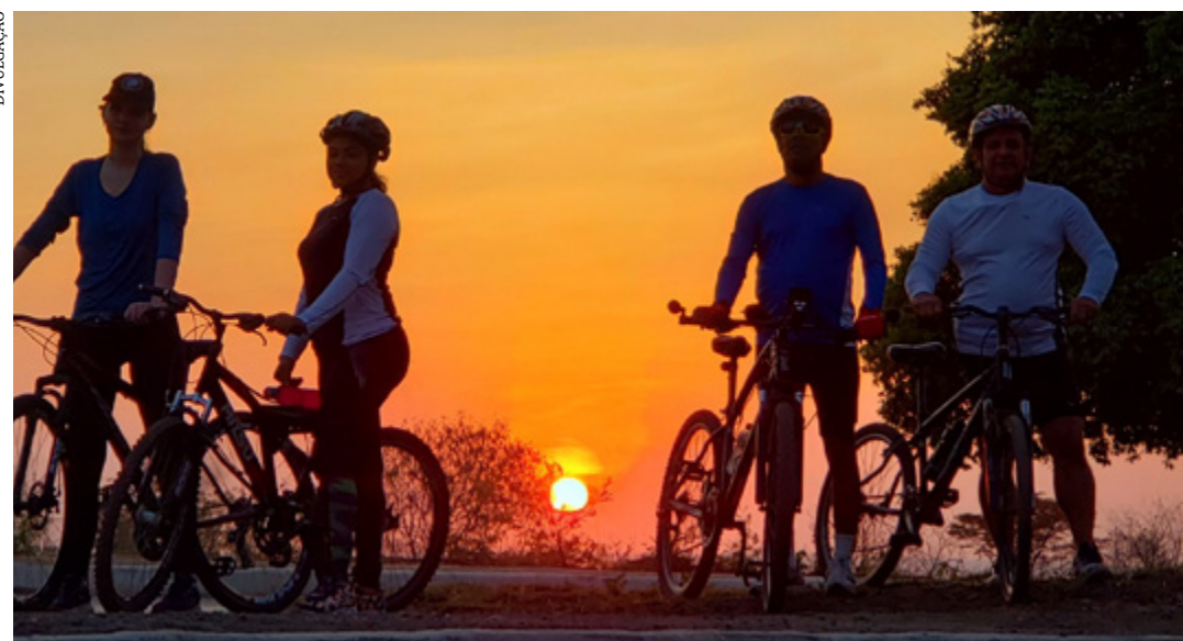
Em Montes Claros o esporte é popularmente chamado de "pedal"

Segundo o Strava, Montes Claros está entre as cidades com mais adeptos do ciclismo em Minas Gerais