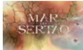
Mimoso ficam frente a frente.

Ben tenta conversar com Sol. Lumiar dá um falso recado de Sol para Jenifer e mente para o marido sobre o encontro com a mãe de sua aluna. Sol desconfia quando Jenifer conta que Lumiar deu um recado seu para ela. Vitinho pede para uma pessoa fingir ser fã de Wilma e ela se irrita quando a mesma se lembra dela por causa de Lui. Sol procura Lumiar, e as duas combinam de manter Jenifer e Ben afastados. O rosto de Lui volta ao normal. Ben fica preso no Tribunal.