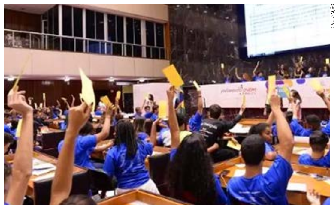
Edição de 2023 do PJ Minas vai debater o tema “Jovem e Mercado de Trabalho”

Essa é a 19ª edição do projeto, que terá como tema “Jovem e Mercado de Trabalho”. Participam 153 cidades, sendo 46 ingressantes, divididas em 20 polos. (Ascom ALMG)