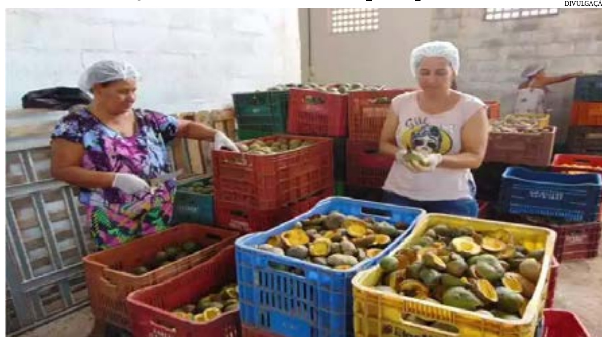
Ao mesmo tempo em que pesquisadores e produtores rurais se unem para combater a ameaça da broca do pequizeiro e apostam no plantio de mudas para salvar a espécie nativa, o símbolo do cerrado experimenta grande diversificação da sua cadeia produtiva – um incentivo a mais para o cuidado de um tesouro que movimenta a economia de muitas cidades.