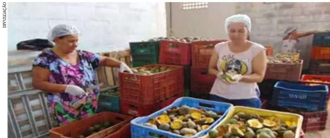
Pesquisadoras da Unimontes apostam no produto obtido a partir somente das flores do pequi e buscam registrar a marca e a identificação de origem

Ao mesmo tempo em que pesquisadores e produtores rurais se unem para combater a ameaça da broca do pequi e apostam no plantio de mudas para salvar a espécie nativa, o símbolo do cerrado experimenta grande diversificação da sua cadeia produtiva – um incentivo a mais para o cuidado de um tesouro que movimenta a economia de muitas cidades. Depois do aparecimento do pequi congelado e de derivados como a polpa, o óleo e até a cerveja de pequi, chega ao mercado um novo produto relacionado à planta: o mel monofloral do pequi.