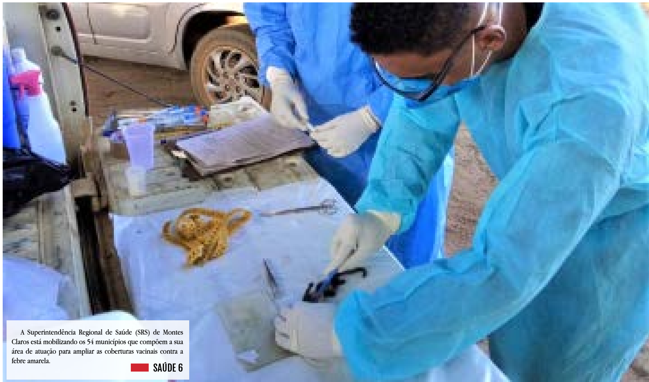
A Superintendência Regional de Saúde (SRS) de Montes Claros está mobilizando os 54 municípios que compõem a sua área de atuação para ampliar as coberturas vacinais contra a febre amarela.