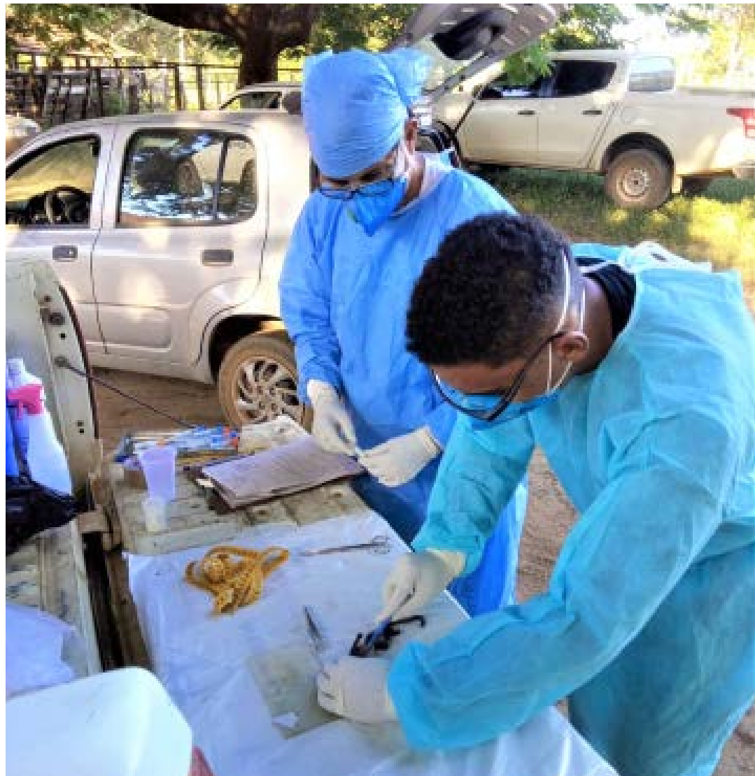
SRS DE MONTES CLAROS

A pessoa que recebeu uma dose da vacina antes de completar cinco anos de idade está indicada a tomar uma dose de reforço, independente da faixa etária. (Ascom SES-MG)