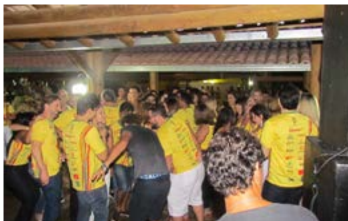
VEJA ANIMAÇÃO na pista