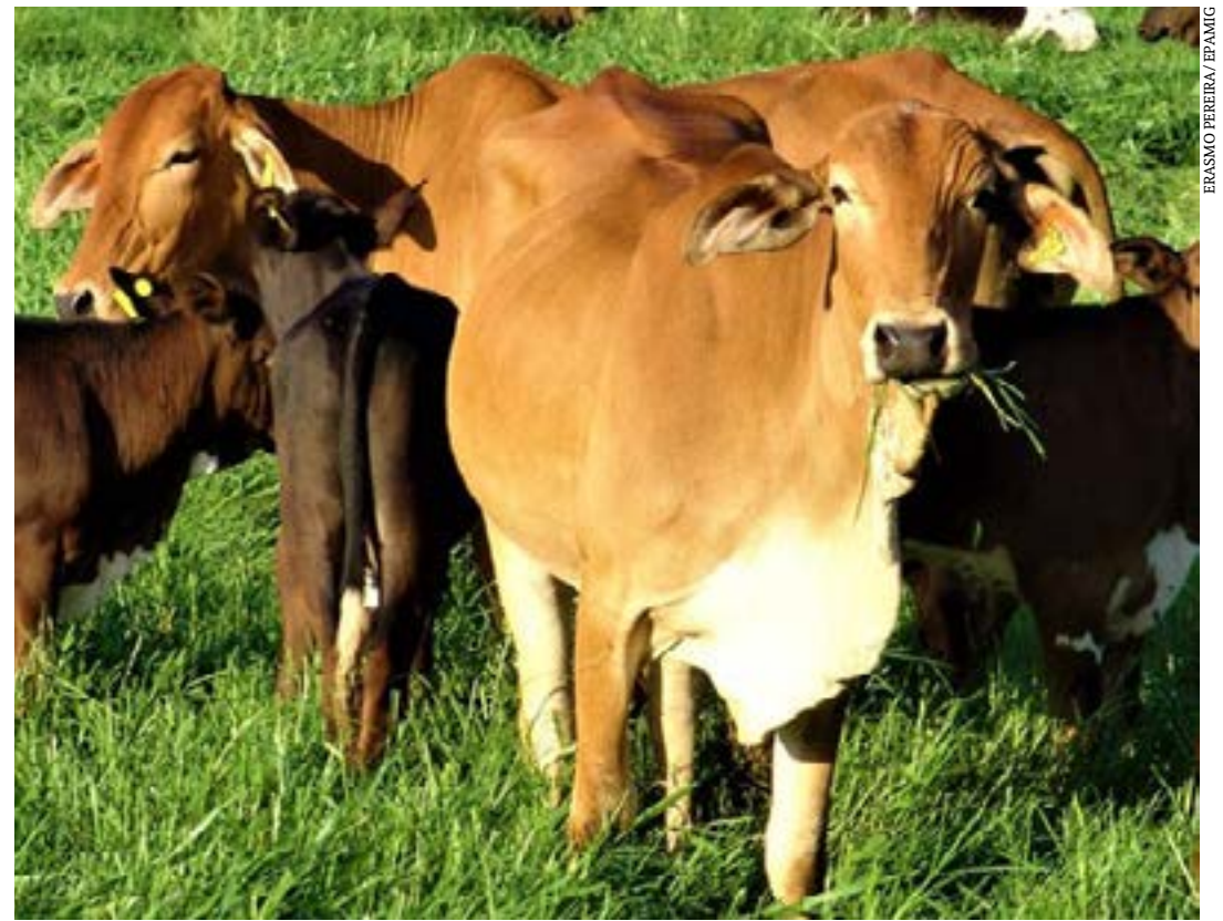
Diferimento de pastagem é capaz de preservar a forragem para uso no período

ainda outros fatores que podem auxiliar no manejo do diferimento de pastagem, como adubação e suplementação, e os produtores devem procurar o auxílio de técnicos ou extensionistas quando optarem pela técnica de diferimento. “É um cálculo complexo, que vai além de variantes como ‘quantidade de piquetes’ e ‘número de animais’.