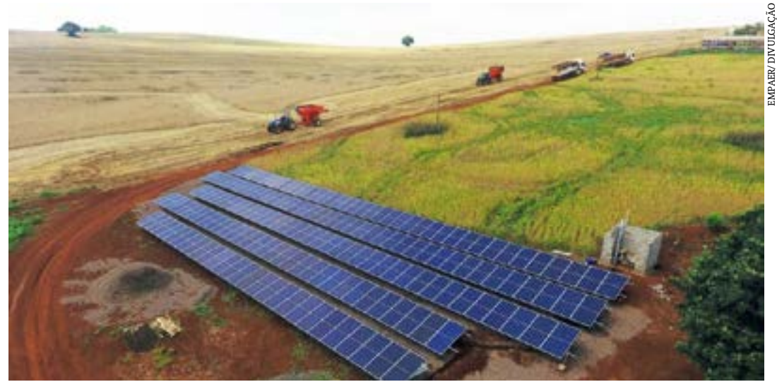
A tecnologia neste setor pode trazer oportunidades de trabalho e renda para as famílias rurais, reduzindo as desigualdades através do desenvolvimento sustentável

A energia solar apresenta enorme potencial de expansão no agronegócio, com diversos benefícios econômicos, ambientais e sociais. A tecnologia neste setor pode trazer oportu-