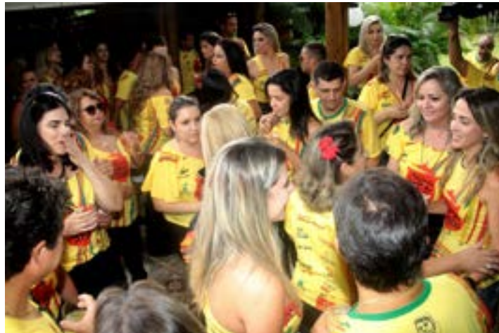
PARTE DO SALÃO superlotado, no Vichi Maria