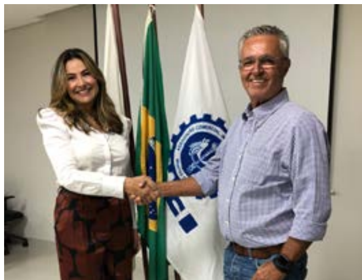
Diferimento de pastagem é capaz de preservar a forragem para uso no período