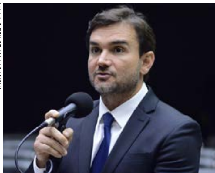
O autor da proposta, deputado Celso Sabino