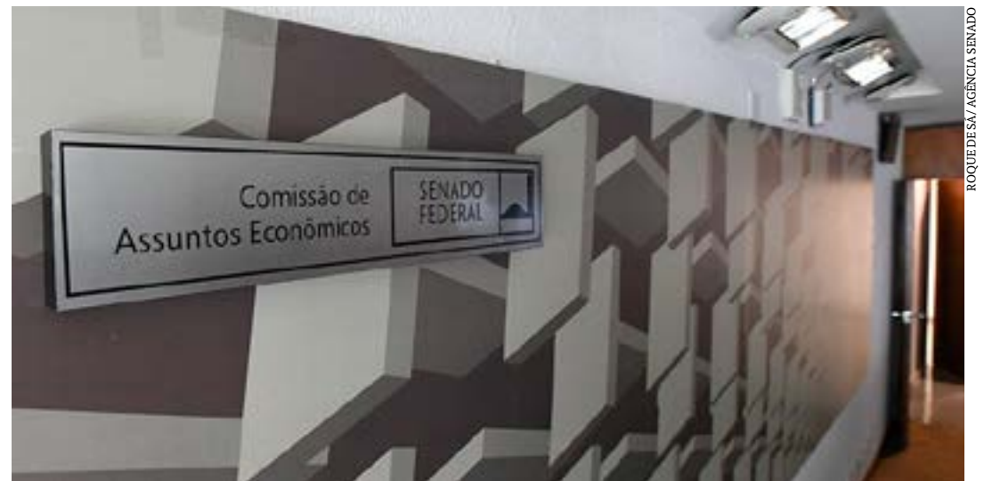
A comissão tem 27 integrantes e está entre as maiores do Senado

O tema de trabalho e emprego responde por 19 projetos na CAE. O PL 4.890/2019, do senador Chico Rodrigues (PSB-RR), incentiva a contratação de trabalhadores com 60 anos ou mais. O PL 824/2022, do então senador Fernando Collor (AL), prevê o pagamento de seguro-defeso ao pescador artesanal em caso de desastre ambiental. (Agência Senado)