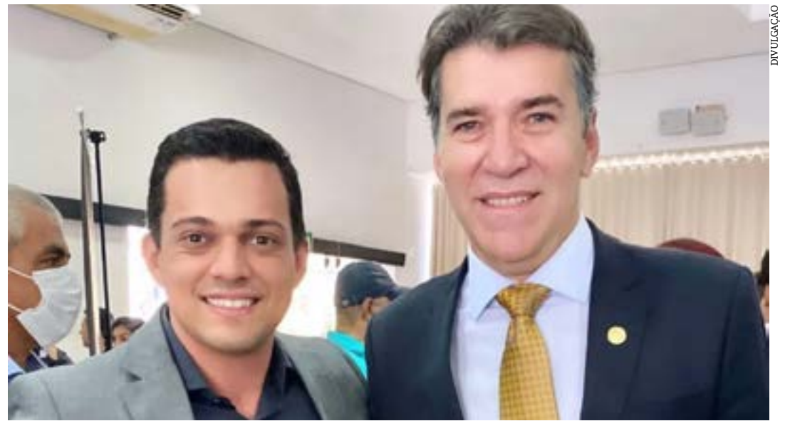
O presidente Pedro Braga com o procurador-geral de Justiça de Minas Gerais, Jarbas Soares Júnior

O transporte escolar gratuito é garantido aos alunos da rede pública estadual do ensino regular que residem nas áreas rurais, conforme legislação vigente. Para o atendimento desses estudantes, o Estado repassa, mensalmente, por meio do PTE, os recursos financeiros para as prefeituras que administram e gerenciam o serviço. A previsão é que até o final da primeira quinzena de fevereiro seja realizado o pagamento da primeira parcela do PTE/MG aos municípios atendidos, dentro do novo enquadramento do programa. (Ascom Ammesf)