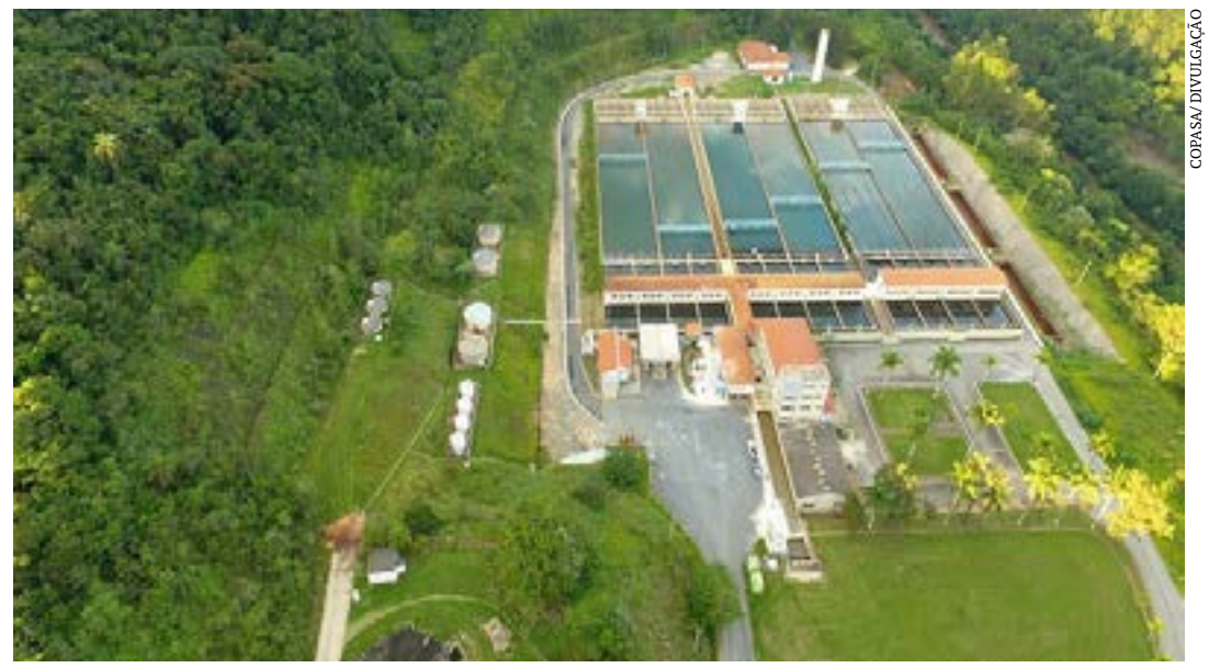
Ideia é promover adesão ao programa estadual. Inscrições pela plataforma Trilhas do Saber começam em 13/2

Mais informações podem ser obtidas com a Diretoria de Resíduos Sólidos Urbanos e Drenagem de Águas Pluviais, pelo e-mail rafael.freitas@meioambiente.mg.gov.br. (Agência Minas)