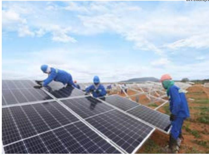
Norte de Minas é o maior gerador de energia solar do Estado, dentre outras fontes renováveis, podendo tornar-se fornecedor mundial do H2V - 100% limpo