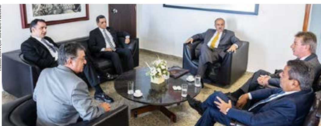
Pacheco se reuniu com o governador e parlamentares de Roraima para discutir crise relacionada à retirada de garimpeiros de terras indígenas

saúde pública. Nesta terça-feira a Força Aérea Brasileira anunciou que reabrirá parcialmente o espaço aéreo sobre as terras ianomânis em Roraima para permitir, até 13 de fevereiro, a retirada espontânea dos garimpeiros da região. (Agência Senado)