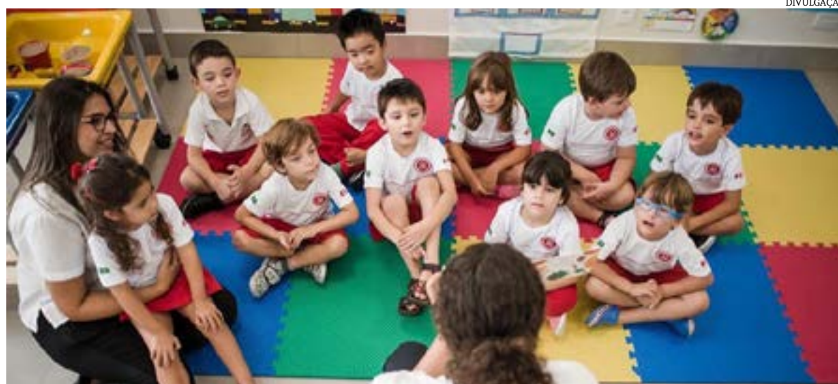
Educação Infantil, Ensino Fundamental e Médio de alta qualidade, e é fundamentada nas melhores práticas que posicionam a educação canadense entre as melhores do mundo. Na Maple Bear, o desenvolvimento de habilidades como liderança, pensamento crítico, colaboração e autonomia, bem como de valores que incentivem o exercício da cidadania e o respeito à diversidade, andam lado a lado com as disciplinas tradicionais.

Escola Maple Bear inova e utiliza método canadense de ensino, em Montes Claros