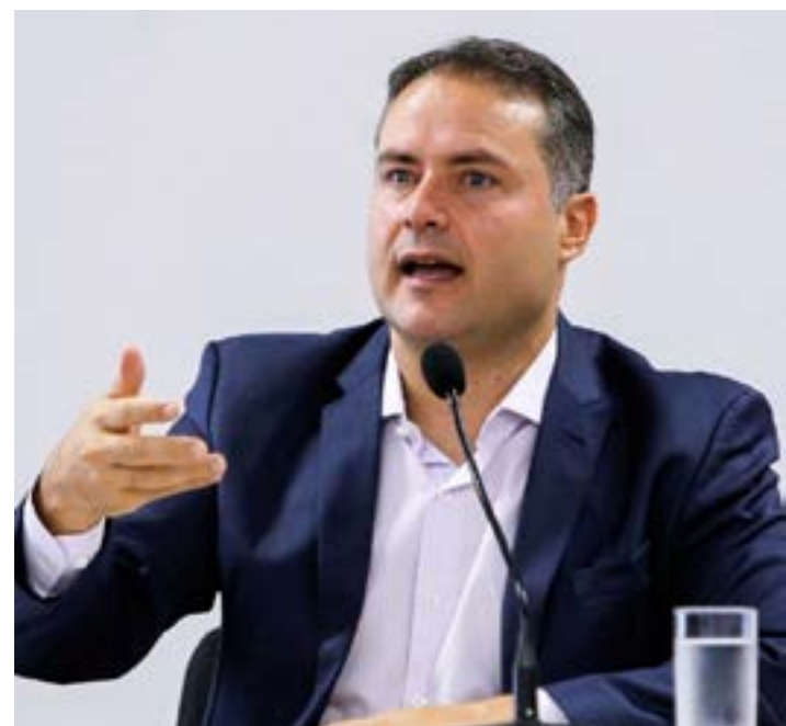
O ministro Renan Calheiros Filho

Lula e sua equipe a fim de garantir os recursos extras para a realização desses sonhos tão antigos do povo norte-mineiro e do Vale do Jequitinhonha. A conclusão dessas obras trará muito desenvolvimento para a nossa região, reduzirá distâncias e sofrimento do nosso povo".