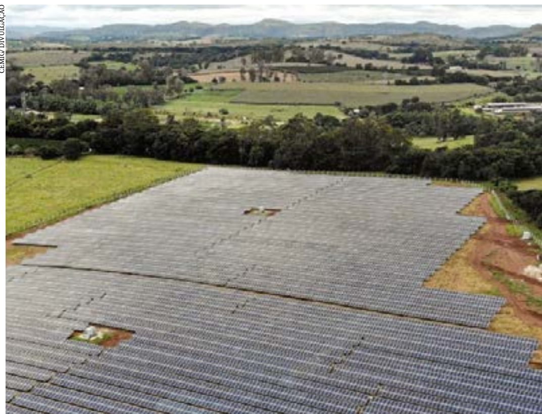
Estado concentra 27% da produção nacional e registra incremento de 750 novos empreendimentos em construção ou com a obra não iniciada

Minas é o primeiro estado no Brasil a atingir a marca de 2 GW em geração centralizada de energia solar fotovoltaica, de acordo com dados da Agência Nacional de Energia Elétrica - Aneel. A geração centralizada inclui usinas elétricas de grande porte, com extensa capacidade geradora.