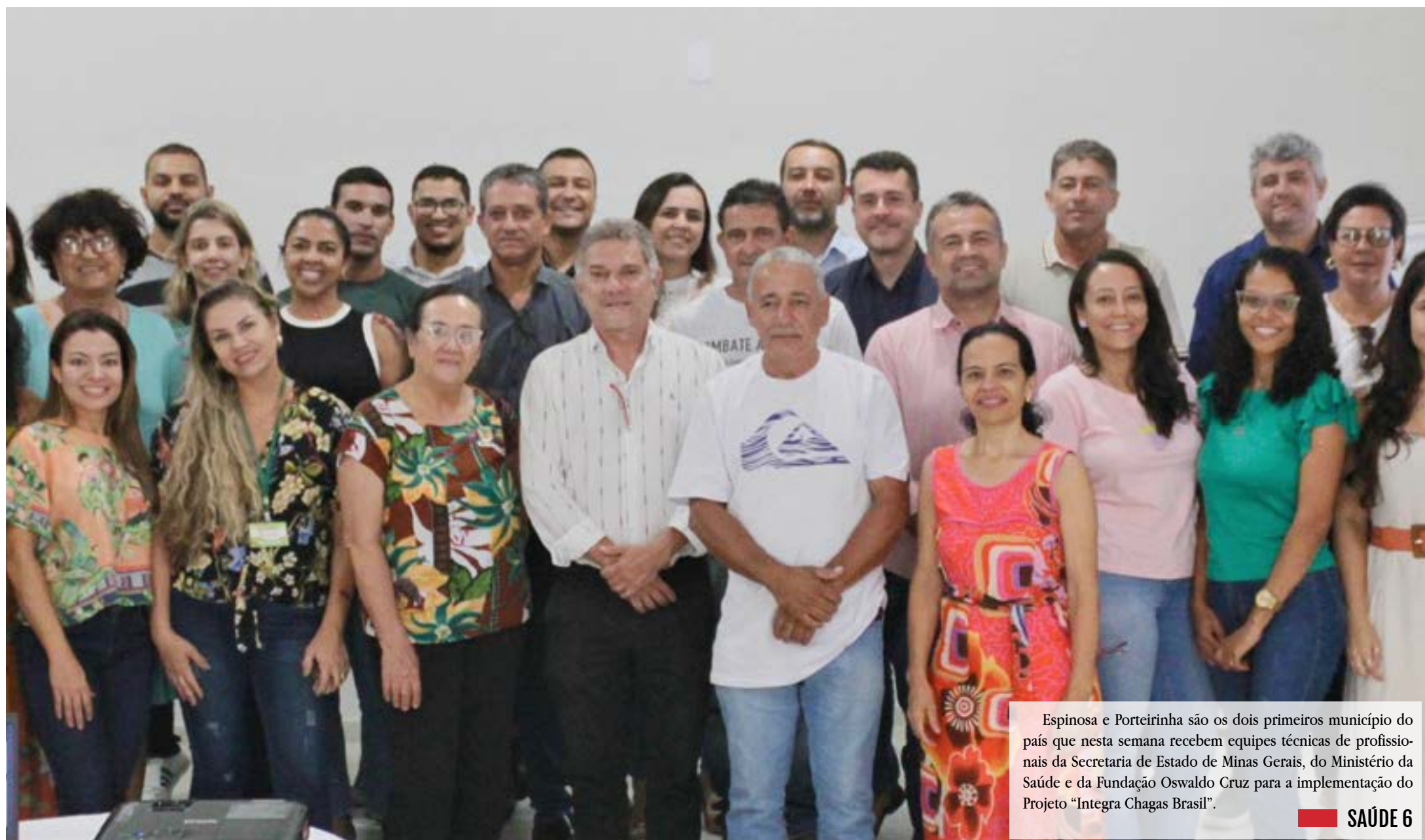
Espinosa e Porteirinha são os dois primeiros município do país que nesta semana recebem equipes técnicas de profissionais da Secretaria de Estado de Minas Gerais, do Ministério da Saúde e da Fundação Oswaldo Cruz para a implementação do Projeto "Integra Chagas Brasil".