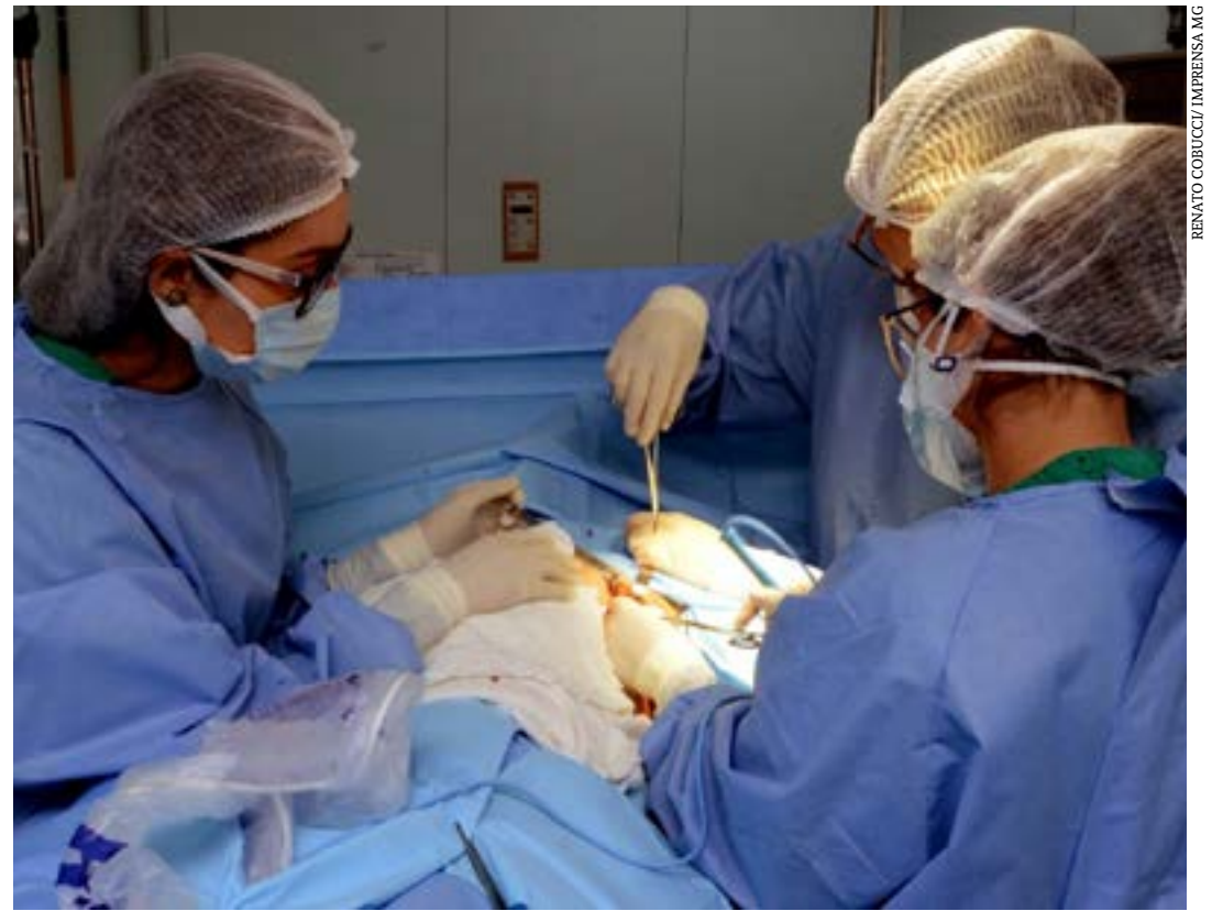
Investimento do governo estadual garante a continuidade do programa Opera Mais e diminui a fila de espera em Montes Claros

“Completamos, há pouco, um ano da nossa política Opera Mais. Em 2022, nós batemos um recorde de cirurgias realizadas. Essa fila veio aumentando, especialmente com a pandemia de Covid-19, e agora, com essa política, estamos conseguindo aumentar a produção