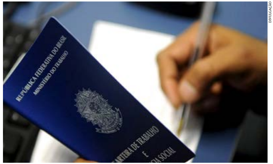
Total supera em quase dez vezes o saldo de emprego das médias e grandes empresas

teve proporção de 39% de empregos nos pequenos negócios, gerando um saldo de 61.009 vagas. Triângulo e Sul do estado vêm logo abaixo, com surgimento de 17.975 e 15.789 postos, respectivamente. Por sua vez, o Centro-oeste e Sudoeste fecharam com um