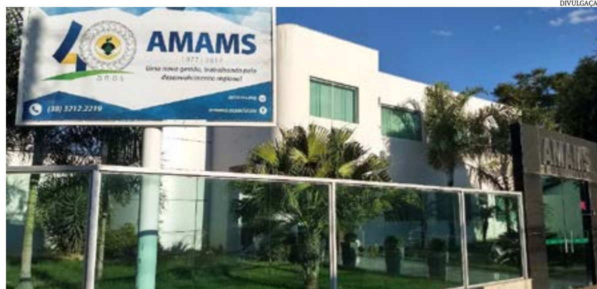
O Portal de Compras Públicas, a Amams, o Cimams e o Codanorte realizam hoje (7) e amanhã, o curso sobre a Nova Lei de Licitações com o tema "Não basta saber sobre a nova lei, é preciso regulamentar", que ira orientar os municípios sobre a importância de regulamentação desta nova lei no âmbito municipal.