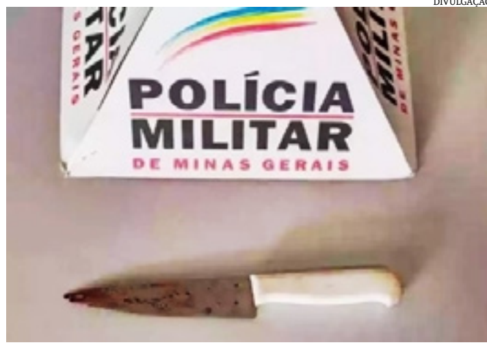
lícia identificou um homem suspeito de ter atingido Antônio com a faca. As buscas continuam a fim de localizá-lo.

A enteada da vítima disse que após a discussão, Antônio foi perseguido por cerca de pessoas que estavam no bar, sendo agredido a pedradas e pauladas, além de um golpe de faca no tórax. A arma ainda não foi localizada pela polícia. A po-