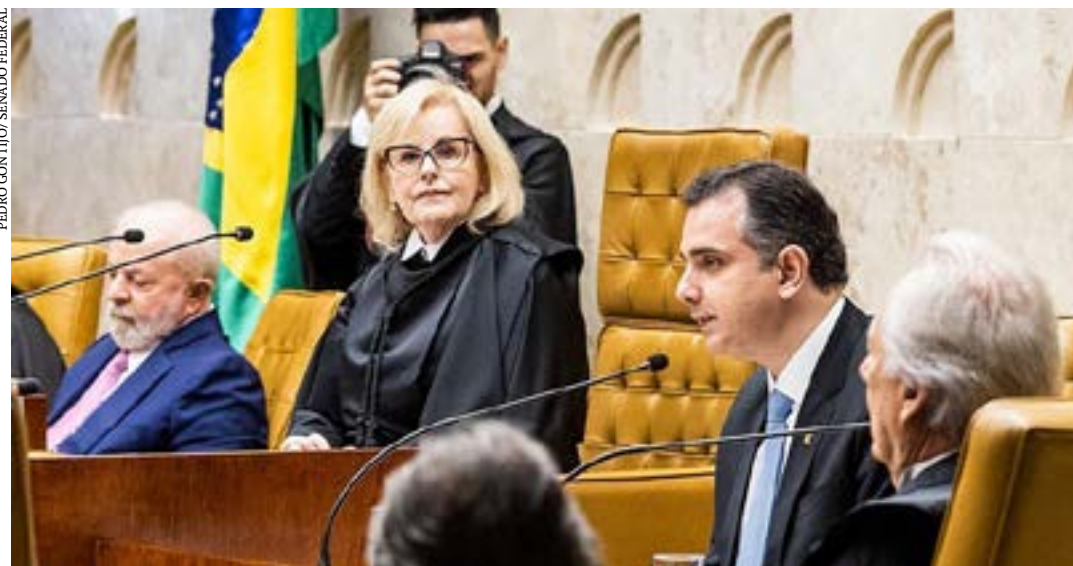
Luiz Inácio Lula da Silva, Rosa Weber e Rodrigo Pacheco durante a abertura do Ano Judiciário

Segundo ele, numa nação marcada pela desigualdade, a tarefa de superá-la deve ser compartilhada entre pessoas e instituições. Lula disse ainda que uma democracia para poucos jamais será uma verdadeira democracia e que o STF é também guardião da dignidade de cada brasileiro e ator fundamental na luta contra a injustiça social.