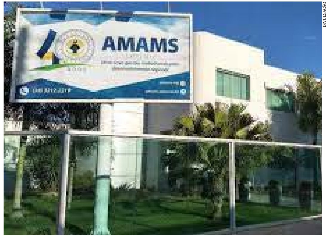
A cidade de Grão Mogol

Ao longo de cada edição, o Unicef e seus parceiros promovem um conjunto de atividades formativas (presenciais e a distância), e oferecem as orientações técnicas necessárias em cada área – educação, saúde, proteção e participação social. E há, ainda, uma grande contribuição estruturante: ajudar os municípios a trabalhar de forma intersetorial e alcançar uma maior eficácia na gestão municipal. Tendo como lógica unir esforços, dentro de cada município, para que a infância e a adolescência sejam prioridade nas políticas públicas.