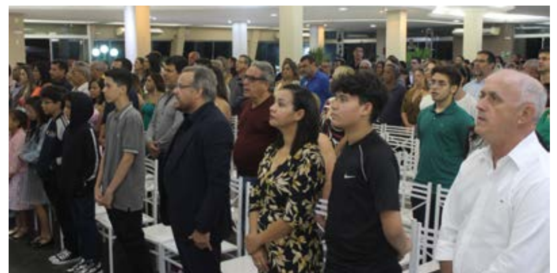
Grande público se fez presente, para acompanhar a posse