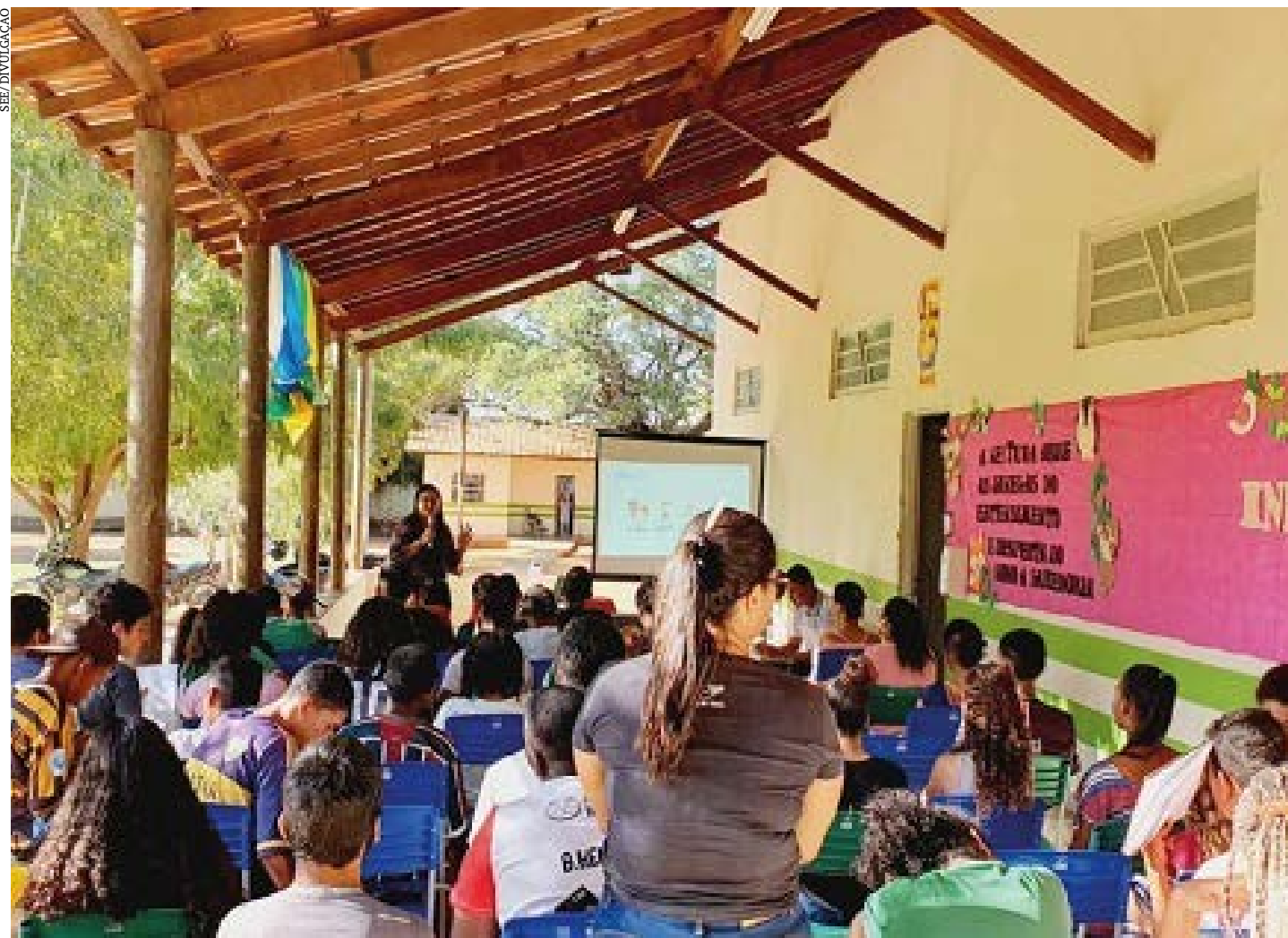
Equipes formadas por psicólogos e assistentes sociais das 47 SREs alinharam metas para 2023 em reunião virtual