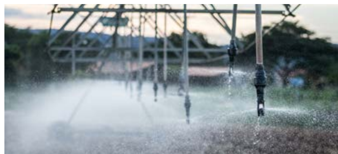
O curso visa formar profissionais para implementação de gestão sustentável dos recursos hídricos e ambientais

Podem se inscrever, profissionais de Agronomia, Engenharia Agrícola e Ambiental, Engenharia Civil, Biologia, Geografia, Engenharia Florestal, Engenharia Ambiental ou áreas afins, fornecendo aos participantes as bases legais, institucionais, regulatórias, organizacionais, operacionais e tecnológicas para o desenvolvimento e implementação de gestão sustentável dos recursos hídricos e ambientais.